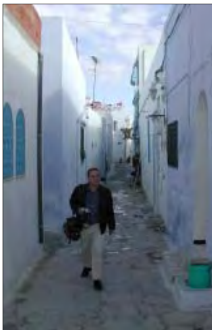
I Tunesien snørkler den ene gyde sig ind i den anden og skaber en labyrint, som man kun svært finder ud af igen.

man. Det viste sig nu, at når man var turist, kunne man godt stille sulten bag gardinerne, men der var ingen tvivl om, at store dele af befolkningen holdt fasten. Flådestyrkens besøg i Tunis var en del af middelhavsdialogen, som er væsentlig for NATO, ikke mindst i den nuværende situation.