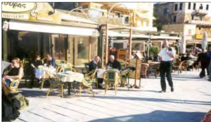
Der hviles ud med en forfriskning.

Der var flere tunge ting. Vi skulle også have returvarer, men vi kunne ikke få det hele før næste dag, hvorfor vi besluttede at lade bilen stå på basen. Der skulle igen søges om tilladelse hos chefen for basen, men efter 2 timers forgæves venten overlod vi bilnøglerne