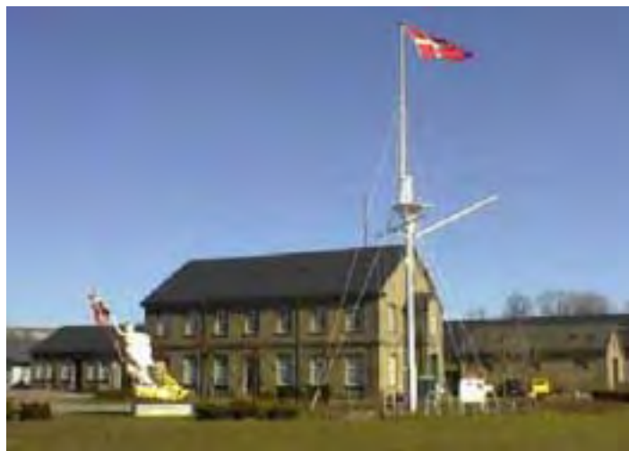
Marinens Bibliotek har til huse i det tidligere Søkortarkiv.

MARINENS BIBLIOTEK Henrik Gerners Plads 1439 København K