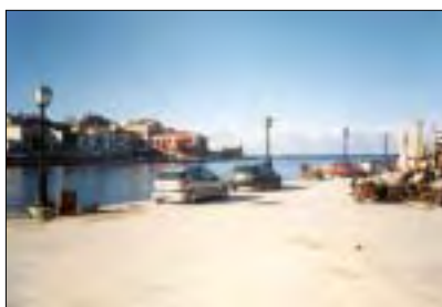
Forsyningstur til Kreta. Læs herom side 10