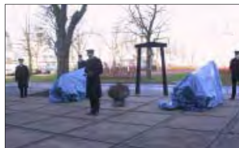
Indvielse af nye kanonrapporter og hvordan blev de lavet? Læs herom side 18