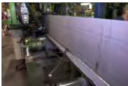
Produktion af T-profiler.