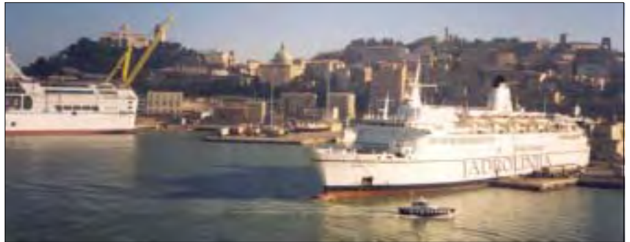
Vi skulle sejle i 20 timer fra Ancona til Patras.

Vel ankommet til Ancona skulle vi finde et hotel, og det viste sig at være ret svært. Lastbilen var par-