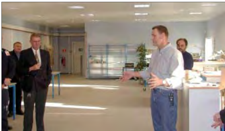
Kryptoværkstedet er beliggende over Garageelementet.

Fra morgenstunden måtte to medarbejdere drage af mod Haderslev for at assistere nogle kunder, som havde fået tilbudt en rejse til Afghanistan med at få rejseudstyret til at virke optimalt. Flyvertaktisk Kommando skulle assisteres telefonisk angående udstyr som skulle monteres i et jagerfly og sidst, men ikke mindst skulle der opfindes/fremstilles specialkabler til Hærens Operative Kommando til montering i en container, som skulle sendes sydpå.