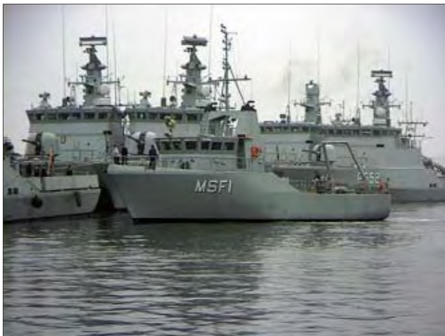
Division 33 omfatter tre STANDARD FLEX- enheder og 10 minerydningsdroner.

Endelig er Søværnets Materielkommando ved at lægge sidste hånd på deres omfattende arbejde i AGMAT (arbejdsgruppe materiel). Arbejdet med at identificere MCM-relaterede reservedele og efterfølgende overføre disse til Frederikshavn skal nu afsluttes. De sidste retningslinier vedrørende vedligeholdelse, servicering og re-