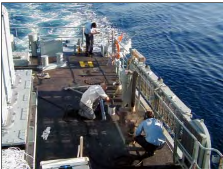
Dæksarbejde i varmen i december.

Selvfølgelig foretager man også skibsinterne øvelser, og naturligvis involverer man andre af styrkens skibe, når det er muligt. Bordingholdet træner, der holdes skydeøvelser og dykkerne går i dybden. Helikoptere har snurret over vore hoveder mange gange, og vi har ofte tanket til søs. Vagtcheferne har kastet skibet rund i forskellige formationssejladser. Vi har sandelig også bidraget nyt til formationssejladser, idet vi udfordrede til sejladser med „drage” på vej hjemad, en såkaldt KITEEX [øvelse med