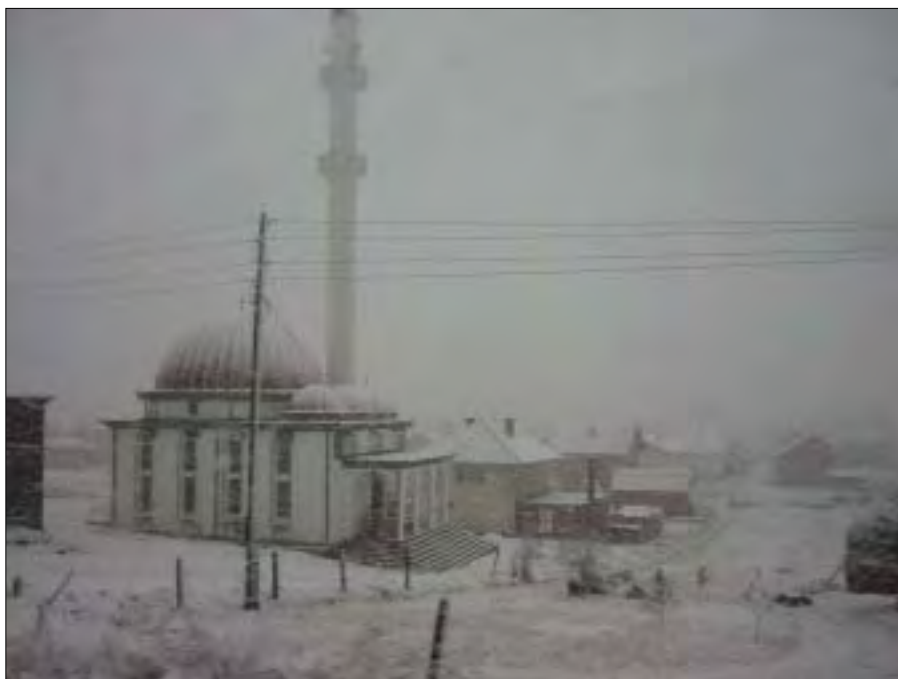
Området ved Camp Dannevirke lignede et postkort.

Det kan godt synes en smule underligt, at søværnet hjælper til i internationale missioner på land, når søværnet selv udsendes til internationale missioner (korvetten til Middelhavet) og heller ikke har let ved at få læger til at indgå i tjenesten på grund af lægemangel i Forsvaret. Prioritering af fordelin-