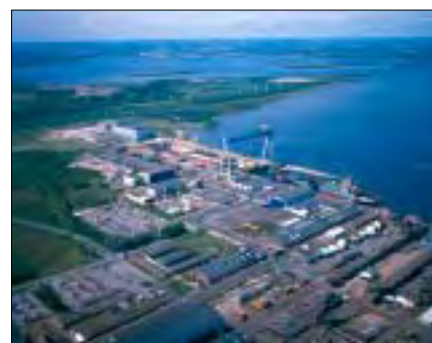
Virksomhedsbesøg på Lindøværftet. Læs herom side 9