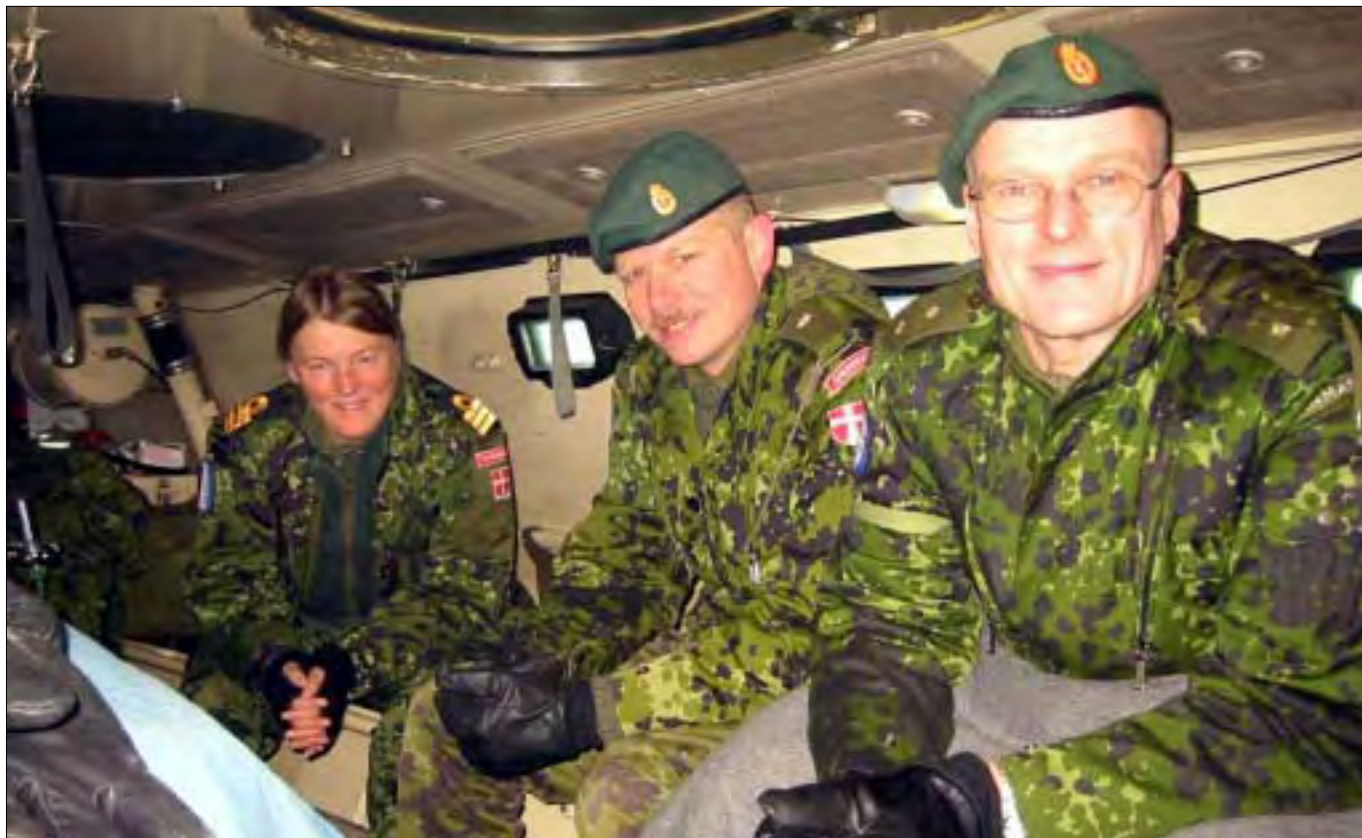
Kørsel i SISU, pansret mandskabsvogn til transport af syge og sårede.

Næste udsendelse ved jeg ikke, hvor går hen, men der vil helt sikkert komme et tilbud, som jeg ikke kan eller vil sige nej til. Når man først har affundet sig med afsavn fra familie og venner, giver det mange personlige erfaringer og oplevelser at være udsendt. Dog håber jeg, at det næste gang kan blive om bord på et af flådens skibe.