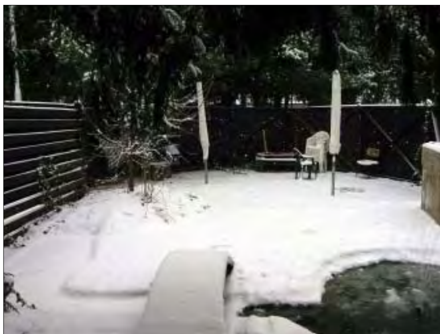
Haven bag infirmeriet.

Den estiske læge og jeg fik en fantastisk oplevelse, da vi blev inviteret med af den amerikanske chef fra felthospitalet på Eagle Base ud til et bosnisk børnehjem for at dele julegaver ud. I kolonne drog vi med tre busser fyldt med