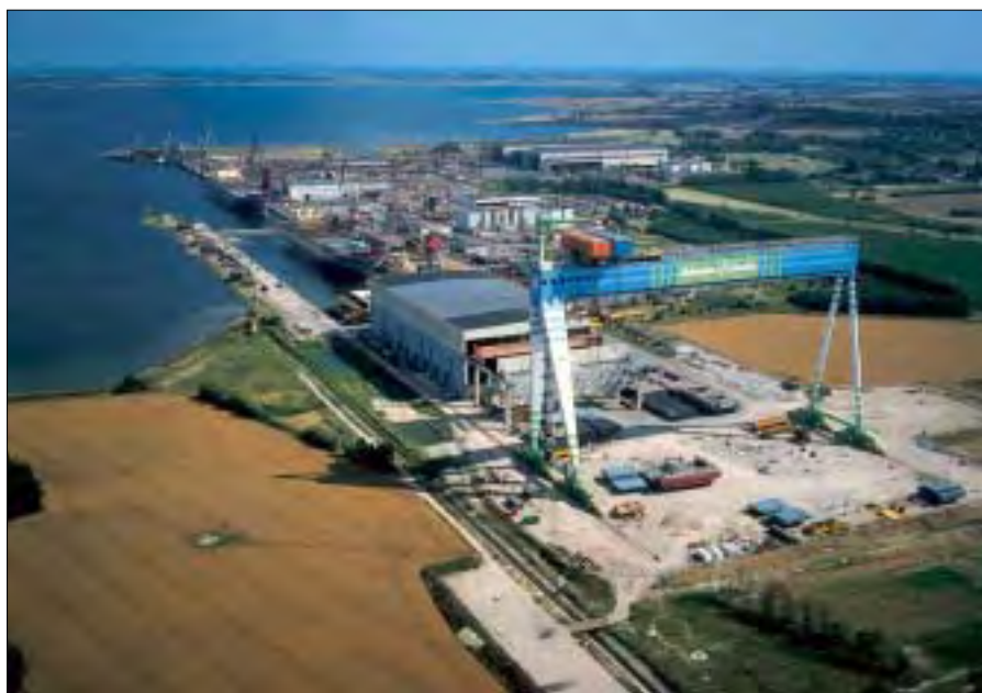
Odense Staalskibsværft A/S.

soner om bord gik turen derefter gennem det fynske landskab på veje, der til tider bragte os i tvivl, om vi var faret vild, men chaufføren ville såmænd bare give os en oplevelse i det smukke vejr. På slaget 09.30 holdt vi foran værftets hovedport.