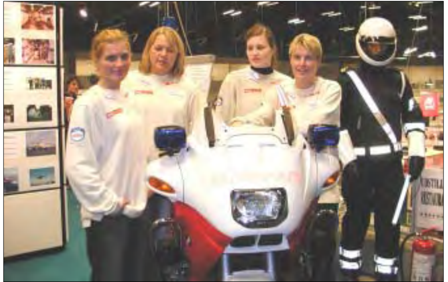
Repræsentanter fra håndboldpigerne i Slagelse omkring den spændende og flotte motorcykel.

Af kommandørkaptajn L. Gulaksen, Chef for Teknisk Afdeling