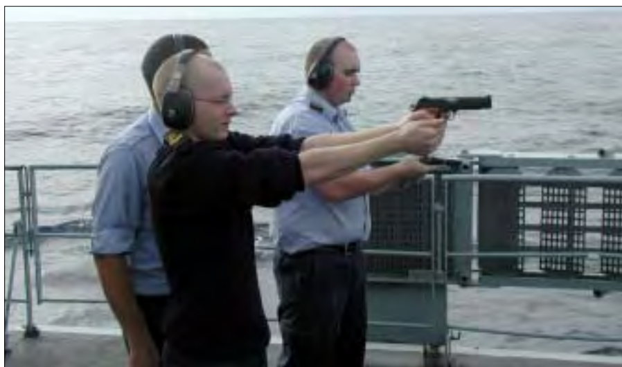
Skydeøvelse, „messekrigerne” skyder til måls.

Et godt havneophold gør mennesker friske til at tage opgaven op med fornyet kraft og energi. Mange af os havde aldrig tidligere været de steder, som vi så i løbet af disse elleve uger. Bortset fra Rota og Tunis, kom vi også til Souda Bay på Kreta og til Aksaz i nærheden af Marmaris i Tyrkiet. Det er en enestående mulighed, man får, når man gæster andre lande. Man får lejlighed til at iagttage andre menneskers måde at leve på. Naturligvis konstaterer man ofte store forskelle. Vi lever vores liv vidt forskelligt og ofte med anderledes idealer. Det man tager sig nært i det ene land, har man et afslappet forhold til i et andet. Den måde, man handler på i Tunis og i Marmaris, skal man nok ikke hjemføre til det høje nord. Endnu engang må man konstatere, at vi som danske elsker orden og effektivitet, men med den form for retlinethed forekommer livet at være for kort og spændende for andre, der elsker improvisationens kunst i højere grad. Det er tanke-