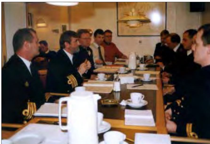
Under Chefen for 3. Eskadre er nedsat tre arbejdsgrupper.

Siden foråret 2000, hvor den endelige beslutning om at minerydningsfartøjerne med tilhørende droner skulle skifte basehavn fra Korsør til Frederikshavn, har Division 33 arbejdet med den praktiske udførelse af opgaven. Arbejdet har primært foregået i de af Chefen for 3. Eskadre nedsatte arbejdsgrupper, AGVAGT (arbejdsgruppe vagt) som behandler den kommende vagtordning, AGMING (arbejdsgruppe minegarden) som skal forestå tilvejebringelsen af træningsfaciliteter og endelig AGBOSÆT (arbejdsgruppe bosæt-