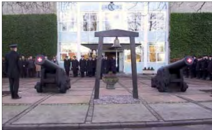
Kanonraparterne er nu opsat foran Søværnets Officersskole.

Det var noget af en opgave at gå i gang med idet Søværnets Operative Kommando havde „glemt” at sende tegningerne med på, hvordan disse raparter skulle se ud. De skulle jo helst passe til de kanoner, som lå inde ved officersskolen, det var jo hele ideen med opgaven, men pyt med det. Vi tog en tur ind på skolen og så hvilke kanontyper, disse mon kunne være. Det viste sig faktisk at være af samme kanontype, som var om