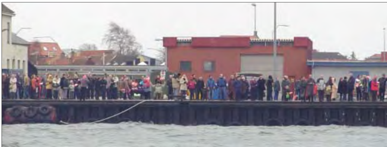
Mange ventede med længsel på kajen ved ankomsten til flådestationen.

samtale både som repræsentanter for vores kultur, men sandelig også som iagttagere til den fremmede verden, der udfordrer vores leve-måde.