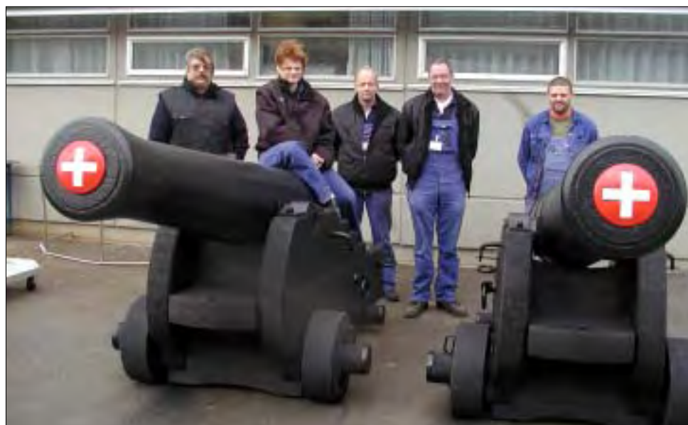
Personellet fra Tømrerværkstedet ved det færdige resultat.