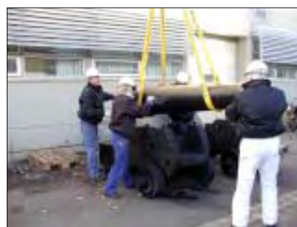
Mange var involverede i den lange produktionslinje, men ved fælles hjælp var opgaven overkommelig.