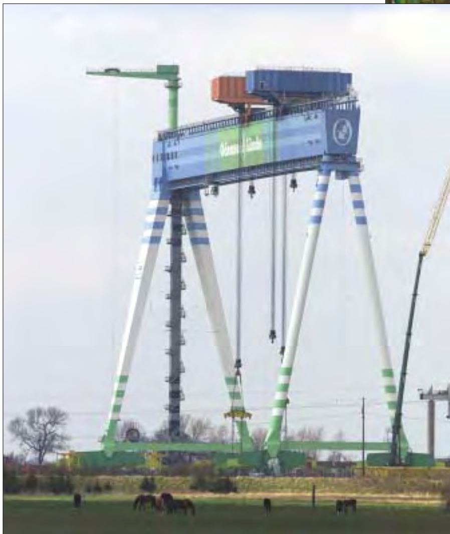
Portalkranen, som betjener dokken, kan løfte op til 1000 tons og har en løftehøjde på 76,5 m.

Derefter i svejsehallerne, hvor vi så hele skibssektioner blive svejst af programmerede svejse-