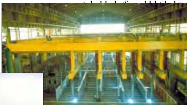
Robotanlæg på Lindøværftet.

Derefter var rundturen slut og tillige en interessant dag på Lindøværftet. Efter afgang kørte vi til Ullerslev kro, hvor vi fik serveret da-