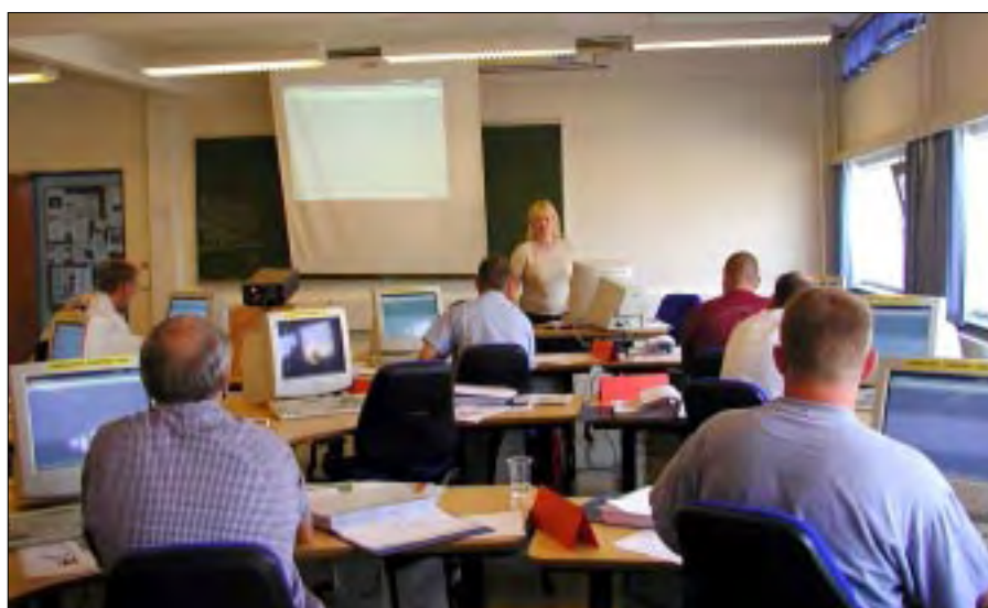
Ud over at forhandle kontrakter underviser jeg også i SAP R3.

de ikke får en forklaring, som de forstår. For mig er det vigtigt, at en person, som jeg har undervist, altid kan henvende sig til mig uden at være bange for at blive afvist. Hvis jeg kan hjælpe, gør jeg det gerne. Nu er jeg blevet superbruger i myndighedsbeholdningsregnskab og er begyndt at undervise slutbrugere sammen med fem andre undervisere.