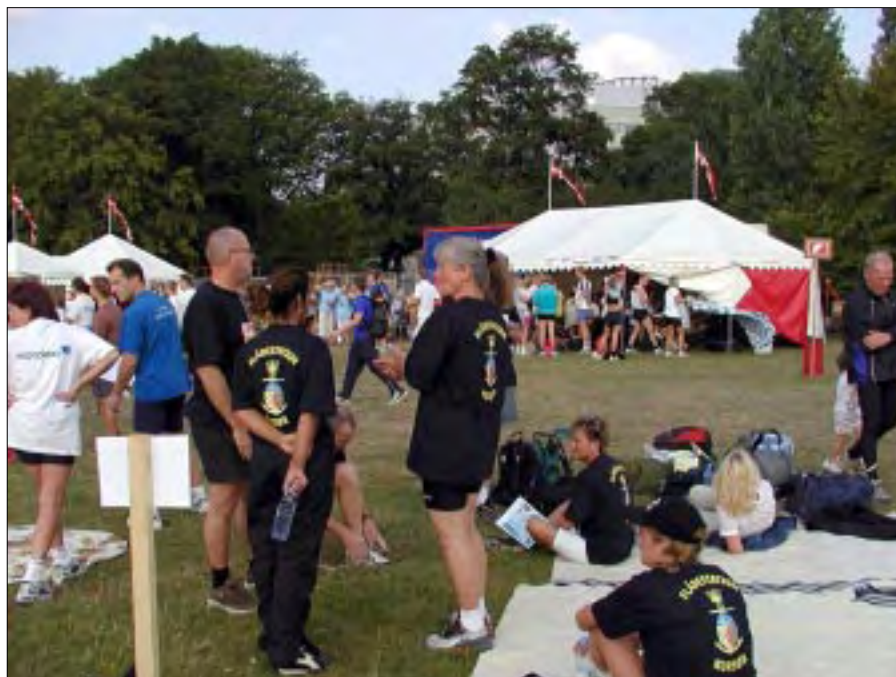
I alt deltog 15 medarbejdere fra flådestationen.

Man kunne tydeligt se, hvem der var vant til at løbe, og hvem der ikke