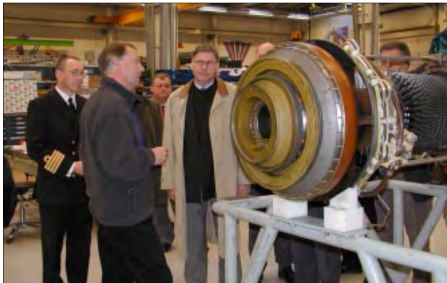
Orientering om gasturbinen.