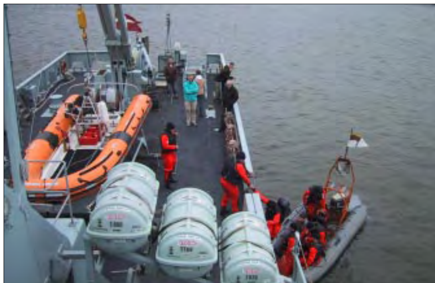
Litauerne havde aldrig prøvet at borde et andet skib.

ZEMAITIS havde i mellemtiden fået gang i deres gummibåd, og de veludrustede boardinggaster skulle nu først kæmpe sig ned i gummibåden fra ZEMAITIS og efter at have sejlet turen rundt om kajen kæmpe sig op på GRIBBENS agterdæk. På GRIBBENS bro blev deres boardingofficer præsenteret for en overdådig mængde skibspapirer (nogle mere relevante end andre) og skulle nu søge at få et overblik, mens hans søgehold gen-