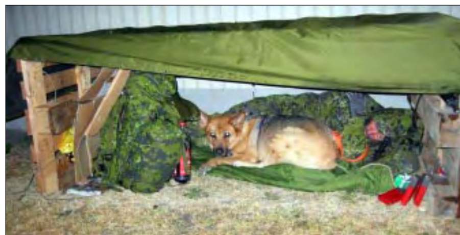
En hundefører og hund får sig et velfortjent hvil.

Flotille 250 stod for forsyningstjenesten. De havde travlt, til tider meget travlt og fik også lært en del, såvel med almindelig forsyning, men også kørsel med to tilskadekomne, som efter et kort skadestuebesøg kunne transporteres hjem til sikker havn. Den ene tilskadekomne var fjende, hvilket overraskede bevogtningsholdet. Var han skadet eller var det blot øvelse? Forsyningen stod desværre for skader på to køretøjer, som skete, da et køretøj bakkede op i et andet køretøj.