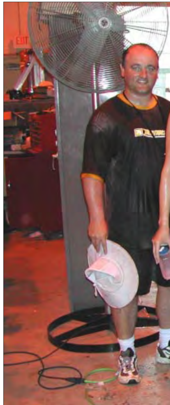
Meget våde blev vi også i et tropisk regnvejr. Det

Forsøgene er et godt eksempel på samarbejde i et internationalt miljø og viser igen, at Flådestation Korsør kan stille et kompetent hold, der kan samarbejde med andre NATO-lande i et internationalt miljø. Som et enkelt eksempel på dette blev der i samarbejde med lokale teknikere i US Navy modificeret på noget af vores positioneringsgøj, der bestod af DGPS modtagere og radiomodems, der transmitterede strygegøjets position til målestationen i land.