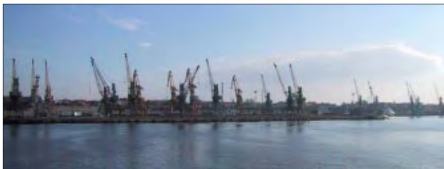
De utallige godskraner gav indtryk af en hektisk havneby under stadig udvikling.

Demokratiet varede indtil 1926, da præsident Anastas Smetona opløste parlamentet og indførte diktatur. I 1940 udråbtes det nyvalgte parlament Litauen som en sovjetrepublik, og to måneder senere trådte landet ind i unionen, hvor det uløseligt måtte blive de næste 50 år. Fra at have været en „mønsterrepublik“ overraskede Litauens parlament i 1990 ved at erklære landet uafhængigt. Centralstyret i Moskva svarede igen med en økonomisk blokade. Efter voldsomme uroligheder, som kostede flere mennesker livet, genvandt Litauen omsider sin uafhængighed, da det gammelkommunistiske kup i Moskva slog fejl i august 1991. I 1992 fik den selvstændige republik en ny forfatning og en folkevalgt regering. I februar 1993 valgte litauerne den tidligere leder af landets kommunistparti, Algirdas Brazauskas, som præsident.” Næstkommanderende kastede et kort blik på che-