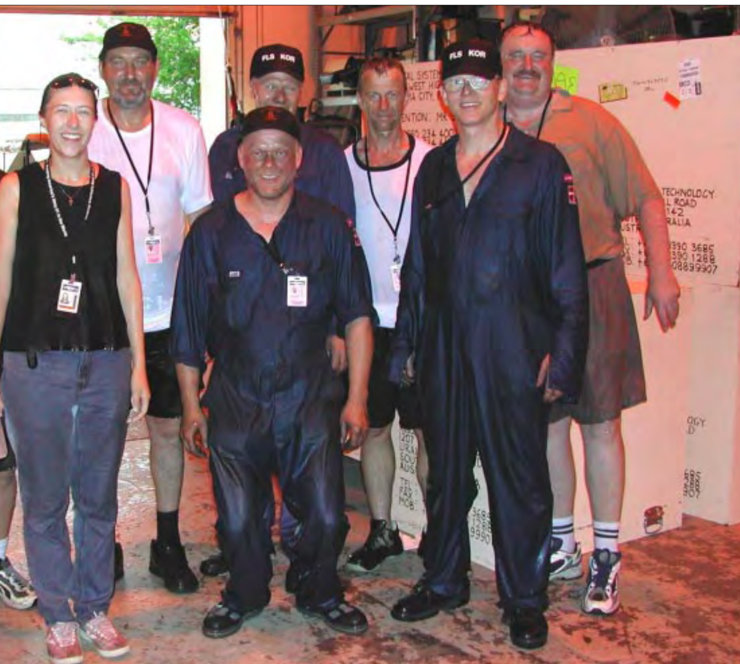
var dog behageligt, idet regnen var varm.