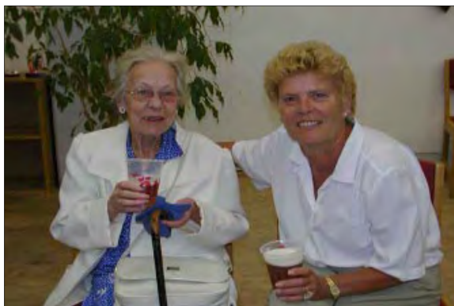
Tidligere og nuværende ansatte fik en god snak.

Trods diverse ændringer i mandskab og organisation søger Søværnets Publikationsforvaltning stadig at leve op til Søværnets NATO- og Kommandokassearkivs gamle motto, HJÆLP OG VEJLED, og yde den bedst mulige hjælp og service til søværnets enheder og tjenestesteder.