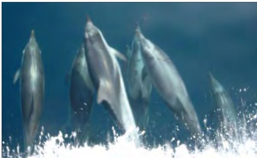
Med delfiner for boven stod vi ind i Middelhavet.

passeret Malta Channel mellem Malta og Sicilien og gået over til kurs 094° ind i det Græske Øhav. I går fik vi besøg af tre svaler, som holdt hvil på bogreolen oppe på broen og overnattede til kl. 5, hvorefter de fortsatte deres videre færd. Fredag den 27. september med kurs 064° forbi Rhodos ankom vi til Aksaz i Tyrkiet kl. 8.