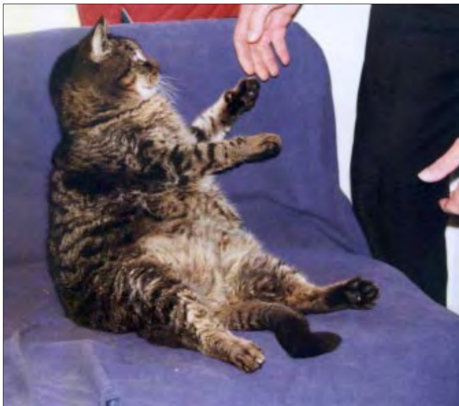
Hugo vil gerne forstyrres, når nogen vil klø ham på maven.

navnet Felix. Den blev installeret i en ombygget batterikasse, der blev stillet på trappen op til 1. sal i mand-skabsboligen. Herfra havde den et fint overblik over gangen. Selvom katten også „slangede” på køjen, var det ikke ufarligt for musene at færdes i området. I løbet af kort tid var musene stort set udryddet, således at opgaven ændrede sig til blot at fange eller fordrive de daglige omstrejfere. Felix passede pligtopfyldende sit „antimusejob” i flere år, indtil han kom ud for en arbejdsulykke og måtte aflives.