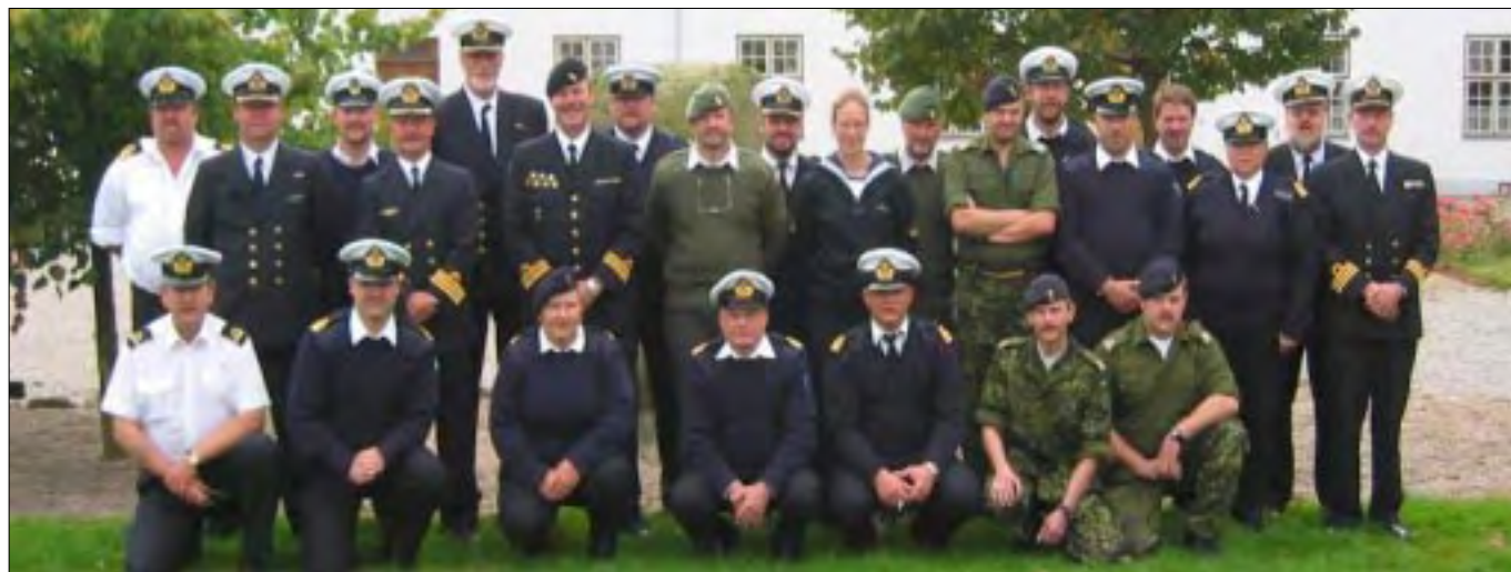
Deltagerne i det historiske seminar.

Bevogtning og nærforsvar fik i sandhed en ny fødsel denne weekend, man kunne næste sige: „Born Over Night”.