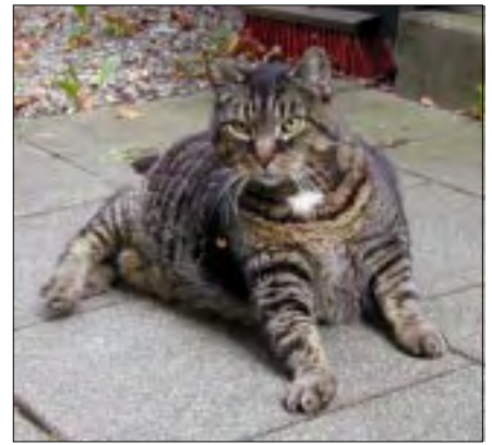
Kan alle se mit „killerinstinkt”.