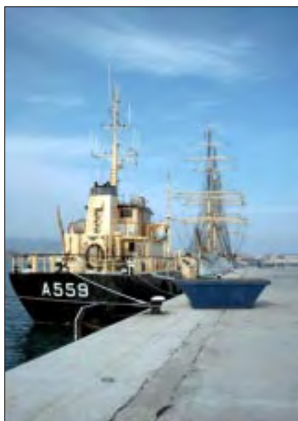
SLEIPNER og DANMARK delte kajplads i Palma.

Mandag den 30. september bliver der varslet „damp” og havne-manøvre kl. 11. Vi mangler en del proviant, hvilket kokken, næstkommanderende og Mester skal have handlet, så med afgang fra