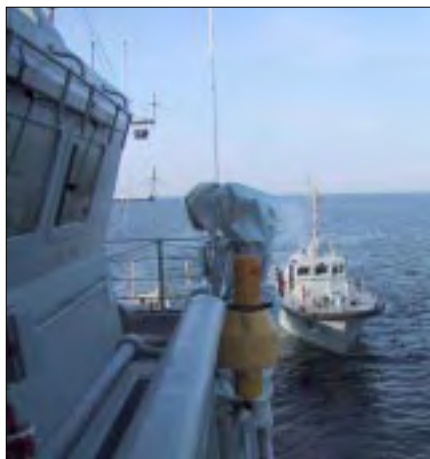
Lodsen blev taget om bord.

fen og fortsatte „Litauen, der dækker et areal på 65.200 km 2 , er den sydligste af de tre baltiske lande. Litauen grænser mod vest til Østersøen med en kystlinie på 99 km, og mod nord er der 610 km grænse til Letland. Mod øst og syd grænser det til Hviderusland i alt 724 km, mod sydvest grænser det til Polen som strækker sig over 110 km og med 303 km til den russiske føderation Kaliningradregion (Østprøjsen). Det meste af Litauen er svagt bølgende sletland på under 100 meters højde. Kun mod øst, også kaldet den baltiske højderyg, når bakkedalen Juozapinė op til en højde af 294 meter. Landets største flod er den 934 km lange Nemunas, der sammen med sine bifloder danner afløb for størstedelen af Litauen. Nemunas kommer fra den sydlige egn af Minsk i Hviderusland. Den løber forbi Vilnius og munder ud i strandsøen Kur'siú Marios (Kurlands Hav).” Næst-