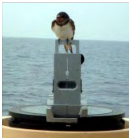
Tre svaler fik et hvil om bord.

Da vi har været i havn i 35 minutter, blev vi smidt ud af den lokale flådebasekommandant. Det viste sig, at de diplomatiske papirer ikke