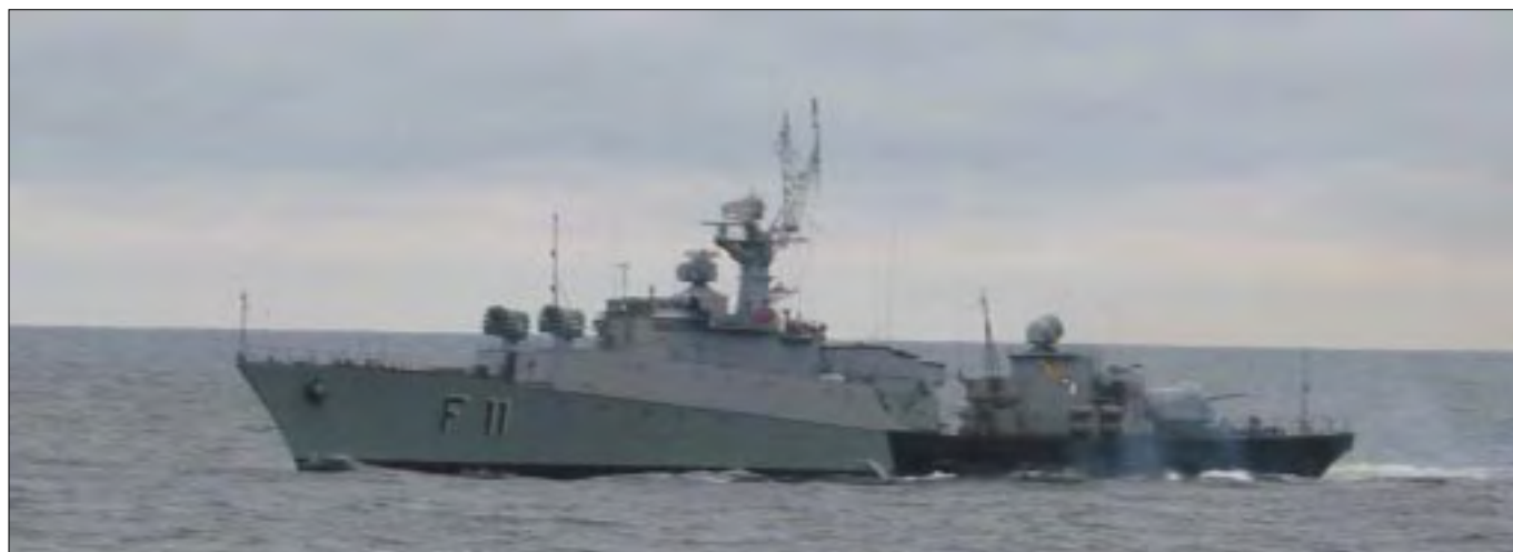
Til mødet om bord i ZEMAITIS bød chefen på litauisk brandy.

kraftig ung mand, der gav udtryk af at være tynget af arbejdsopga- ver. Chefen for ZEMAITIS stod med skrævende ben, og det var, som om hans massive væsen strakte sig hen over den rummelige messe for at hilse hans gæsters stilfærdige indtræden. Mændene stod et øje- blik tavse over for hinanden, så trådte han sine gæster i møde med udstrakt hånd og udbrød, „det glæ- der mig at se Dem – Velkommen om bord.” Chefen for ZEMAITIS gik med værdige skridt hen til det lille bord og skænkede nogle glas næsten til randen med Brandis (li- tauisk brandy). „Jeg mener, at vi