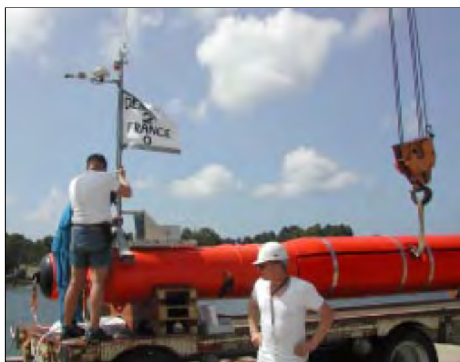
Vi markerede Danmarks sejr over Frankrig med et flag sidst på slæbet.

Sejladsen fra basen til forsøgsområdet tog ca. en time. I forsøgsområdet ventede ministrygeren USS