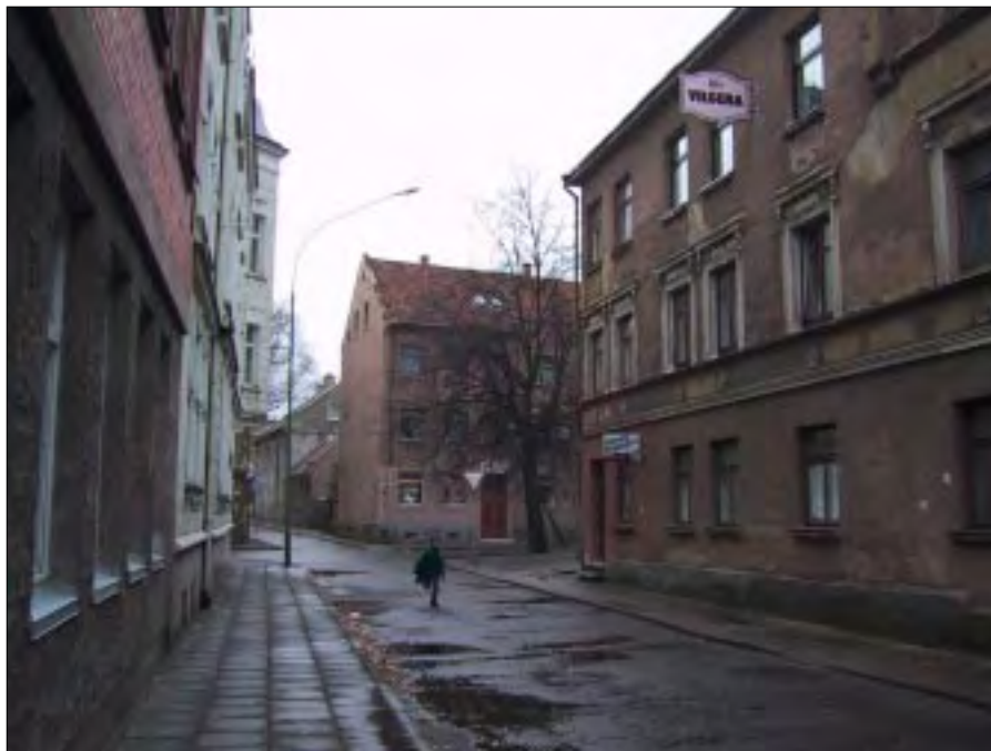
Den litauiske nation blev officielt grundlagt i det 13. århundrede.

En ringetone lød i det fjerne, og kort efter ankom den litauiske or- donnans, der skulle eskortere chef, næstkommanderende og teknik- officeren fra GRIBBEN igennem ZEMAITIS´ s gange op til officers- messen, hvor mødet skulle foregå. ZEMAITIS var en af de to GRI- SHA-III fregatter, Litauen købte af russerne efter „Murens” fald. Dens ejendommelige konstruktion gør, at man altid enten går op ad bakke eller modsat ned ad bakke, når man