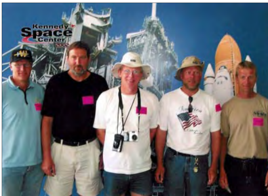
Holdet på besøg i Kennedy Space Center.

Vi var blevet en kæmpe oplevelse rigere.