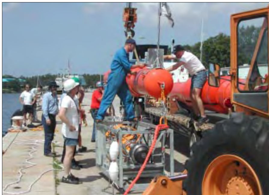
På Mine Dyads monteredes en speciel elektronisk lyd giver, som kunne indstilles til forskellig støj, et skib udsender.

Efter forskellige flyskift og skybrud ankom vi til Panama City Florida, USA kl. 3 onsdag morgen. Dette var noget af en start på vores rejse, så vi var en del trætte. Det var dejligt at komme på hotel Days Inn for at se dyner.