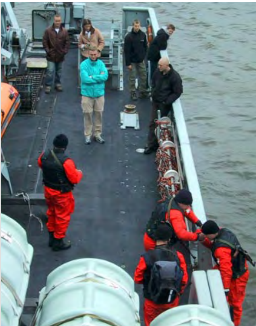
Assistanceøvelsen kunne virke næsten nonchalant i en landkrabbes øjne.

GRIBBEN havde med sin nuværende besætning været i tjeneste så længe, at almindelig sømandskab og betjening af skibets forskellige systemer normalt foregik med en rutine og dygtighed, at udfordringerne ved de opkommende kajøvelser måtte anses som værende minimale.