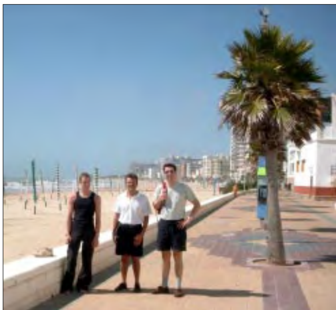
Under anløb af Rota måtte vi ud at proviantere.

Med en godt træt besætning forlader SLEIPNER Rota i et meget flot vejr, og kl. 24 passerer vi Gibraltar og fortsætter vores tur nu i Middelhavet.