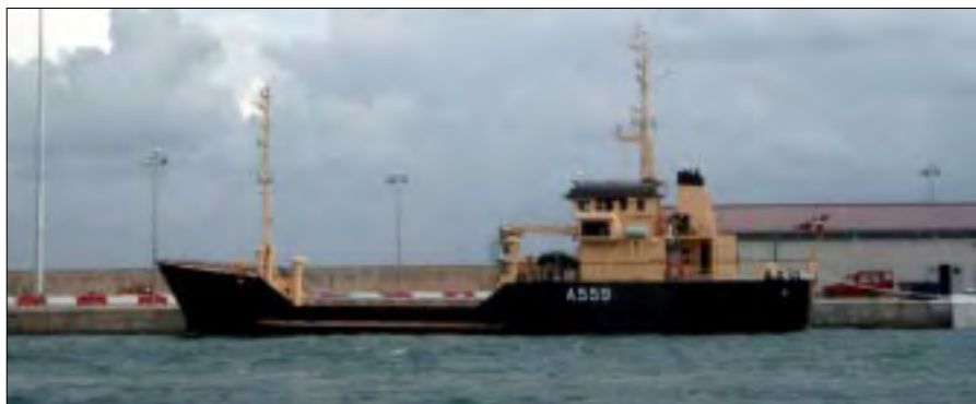
SLEIPNER I Palma havn.

Torsdag den 12. september på vej til vores adoptionsby, Nykøbing Sjælland, får vi at vide, at vi skal til Tyrkiet, så torsdag og fredag bliver hektiske, da vi nu skal have alt på plads inden afgang.