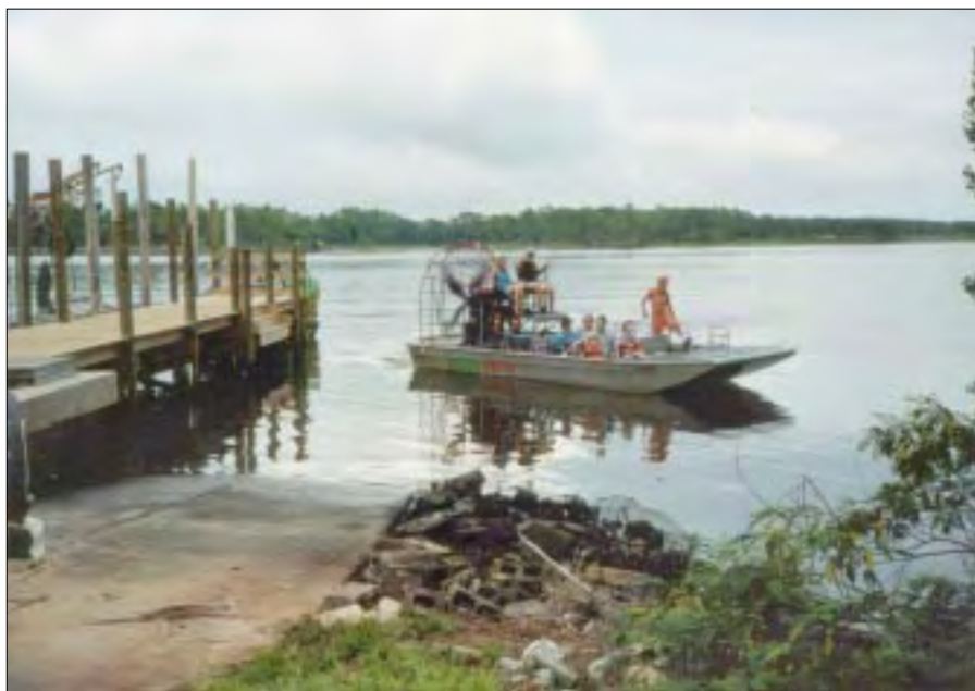
Det var en stor oplevelse for os at sejle med en airbåd.

Øvelsen gik efter planen og sluttede lørdag morgen den 15. juni. Der blev derefter holdt et samlet møde, hvor vi udvekslede erfaringer.