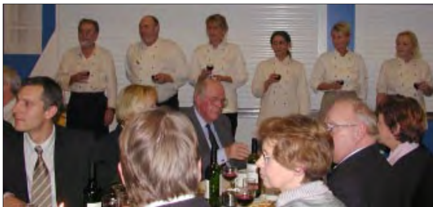
Kokke og „kokkepiger” fik megen ros for deres gode indsats.

Derudover nævnte kommandøren, at vi på flådestationen har haft et