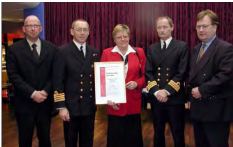
Repræsentanter fra flådestationen med Beskæftigelsesministeren (th).