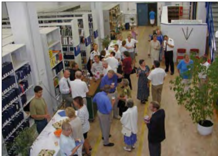
Det kunne tyde på, at det for mange har været et godt tjenestested, når man rejser både fra Jylland og København for et gensyns skyld.

Af overassistent Lise Alring, Søværnets Publikationsforvaltning