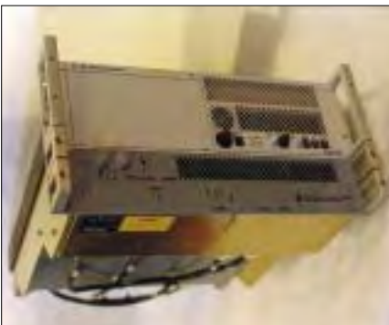
Et af radio-modulerne, komplet monteret.

HAVKATTENS besætning tog prøvelserne med ro, og har siden fået opdateret sit radorum i tide til DANEX.