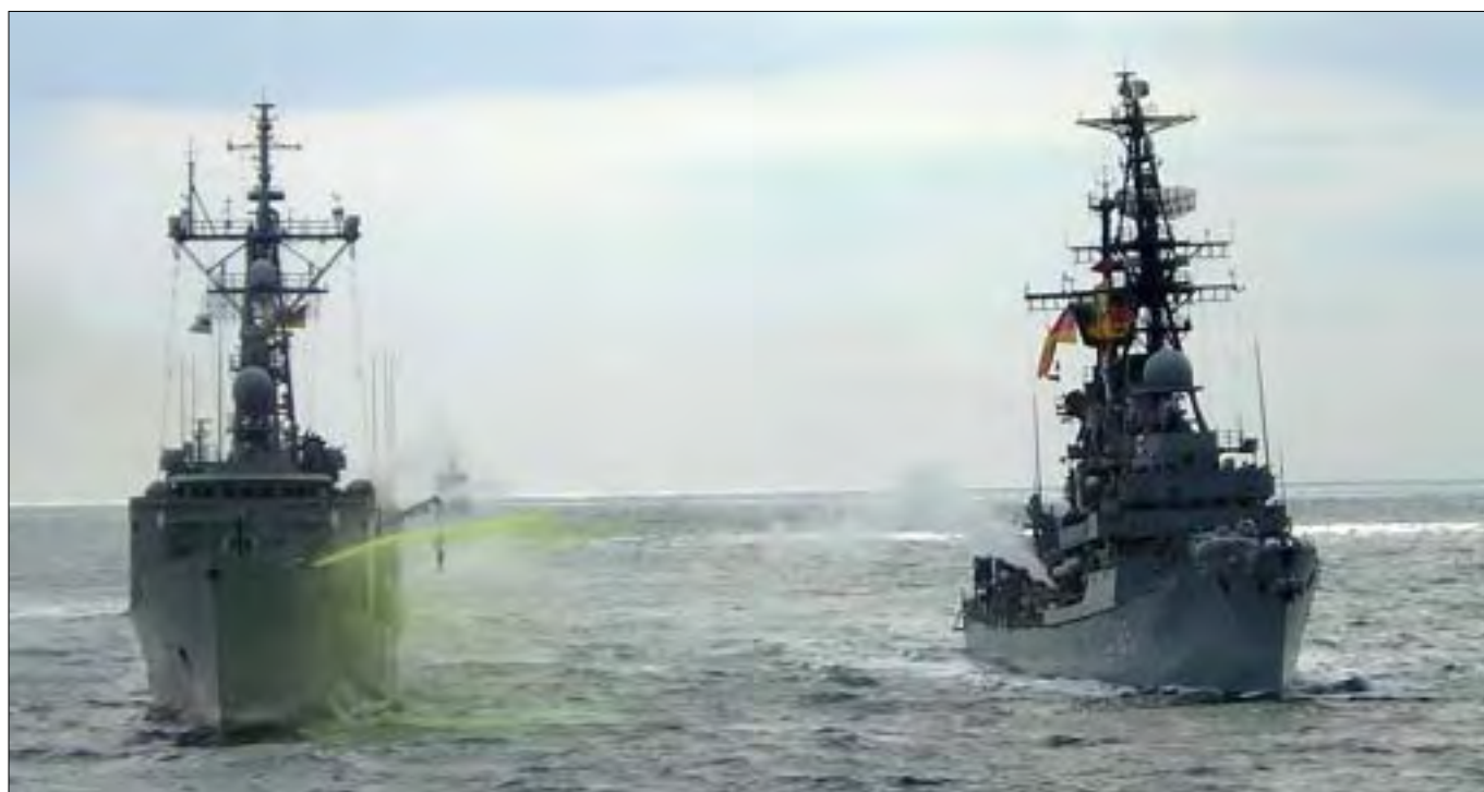
SPS NAVARRA siger farvel ved FGS LÜTJENS' sail past.