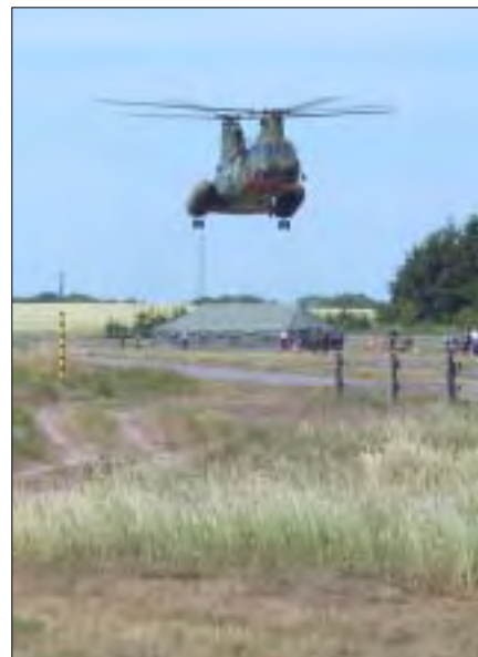
Evakuering ved Bornholm.

I løbet af årets sejladsprogram har vi alle i staben høstet mange erfaringer, selvom det kun blev til tre øvelser i år. Vi har alle fået et maksimalt udbytte, og ser frem til at komme videre under næste års sejlprogram, og fortsætte hvor vi slap i år.