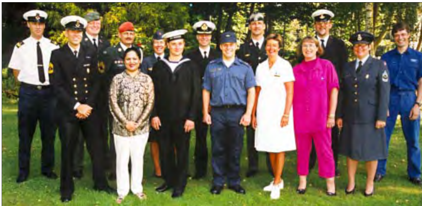
Alle kan udvikle sine kompetencer.

Når FOKUS er afprøvet og tilrettet, påbegyndes uddannelse af alle i Forsvaret i brugen af det. FOKUS er IT-baseret, og det er målet, at det ruste medarbejdere og Forsvaret til bedre at løse såvel nutidens som fremtidens opgaver, samtidig med at det også letter den enkelte chef/leder i det daglige arbejde.