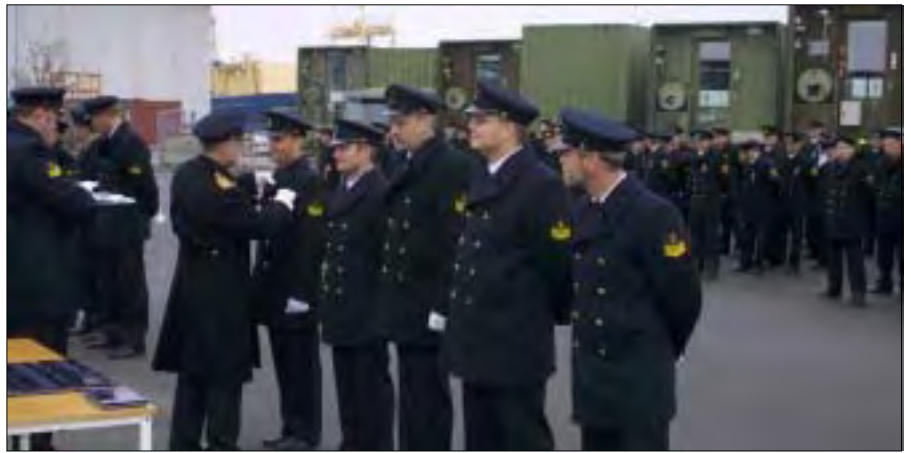
Medaljer for deltagelse i operation ACTIVE ENDEAVOUR og operation IRAQI FREEDOM.

Søværnets bidrag til denne operation har været korvetterne NIELS JUEL og OLFERT FISCHER, undervandsbåden SÆLEN samt patruljefartøjerne VIBEN og RAVNEN og MLOG, som vi bød velkommen hjem her i Korsør den 7. oktober. Afslutningen af deres op-