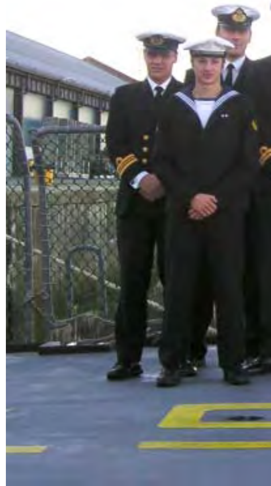
Staben på THETIS' helikopterdæk efter NORTHERN LIGHT

THETIS deltog igen som kommandoplatform for STS. I en kortere periode måtte dele af STSs stab skifte kommandoenhed og gå over i PETER TORDENSKIOLD, da THETIS fik tekniske problemer på radiostationen.