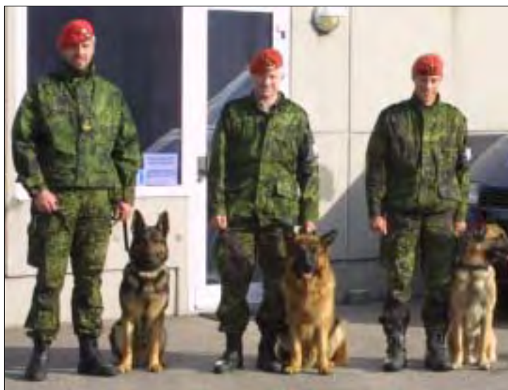
De nye "schæfer" præsenteres for fotografen.

Det er allerede blevet til deltagelse i to øvelser, hvor hundene har været med til at "indfange krigsfanger". Øvelser, som er helt eller delvis sponsoreret af hæren. Da hæren ikke selv har tjenestehunde, er de vældig glade for vores assistance.