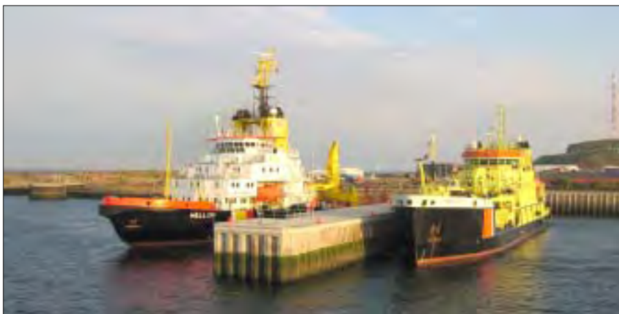
Miljøskibe på Helgoland, det tyske MELLUM (t.v.) og det hollandske ARCA.

luften for at kunne indtage den rette placering i forhold til et oliespild.