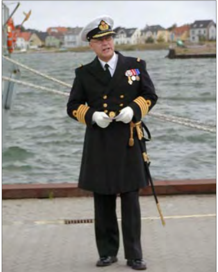
Efter Forsvarsforliget vil den nye 2. Eskadre have skibe liggende i både Korsør og Frederikshavn.

– Af respekt for det personel, der flyttede med deres familier, da man tidligere rømmede Holmen, og da man siden flyttede MCM-enhederne (kommando- og støtte-skibe til minerydning) fra Korsør til Frederikshavn, har man med forliget valgt ikke at flytte dem tilbage til Korsør, skønt der kunne være en vis logik i at have alle skibe af samme type liggende samme sted. Derfor vil der som en konsekvens af Forsvarsforliget stort set ikke blive tale om forflytninger i 2. Eskadre, idet de skibe, der fremover vil indgå i eskadren fra henholdsvis Korsør og Frederikshavn, vil blive liggende i de byer, hvor de ligger i dag. Og det personel, der er om bord på ski-