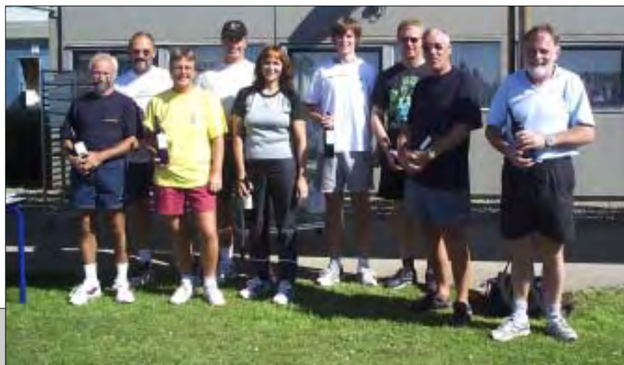
Sejren gik til hold 8.

Alt i alt var det en god dag, som blev velsignet med en høj klar efterårssol. Det er der også bestilt til næste år, hvor udvalget i Sund Flåde vil diske op med nye spændende lege/aktiviteter, så når indbydelsen dukker op, så tøv ikke!