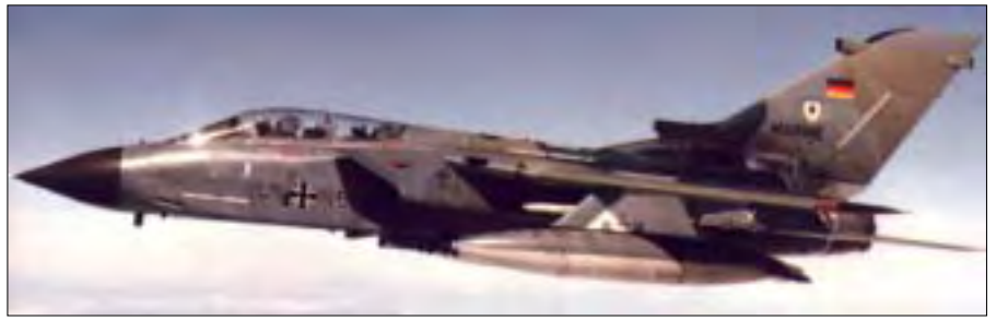
De tyske Tornado fly deltog i antiluftkrigsøvelsen.