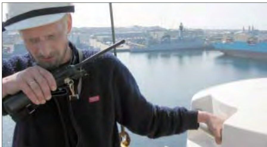
De sidste justeringer før afgang.

Den 16. april 2004 blev selve sensoren monteret med hjælp fra personalet om bord på GUNNAR SEIDENFADEN og Havnetjenesten (kranførerne).