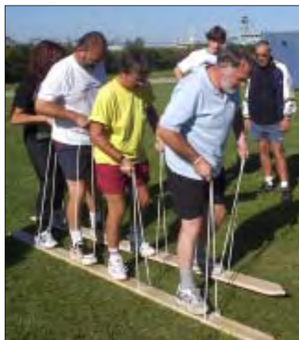
Tjuhej, hvor det går!

Dagen startede med samling kl. 9, hvor man blev delt ind i hold på tværs af faggrupper. Efter en kort instruktion blev halvdelen sendt på opgaveløb, og den anden halvdel gik i gang med turneringer i volleyball og rundbold.