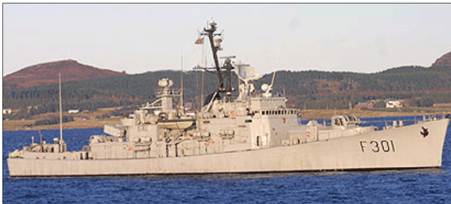
Den gode norske fregat BERGEN.

det ved 23-tiden pludselig tåget. Det var, som om vi sejlede igennem kokkens gule ærter. En så ringe sigtbarhed giver naturligvis en spændt stemning om bord, og med den gik de af os, som kunne, til køjs.