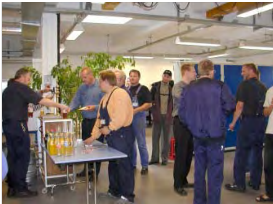
Et velfungerende fadølsanlæg var klargjort til at betjene de mange medarbejdere.

Resultatet, som vi ser i dag, kan i høj grad tilskrives et højt engagement fra medarbejdernes side, hvis