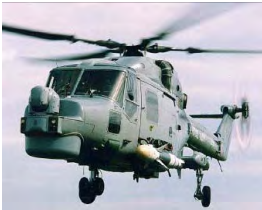
LYNX helikoptere fra ROYAL NAVY kom flyvende ind over skibet.