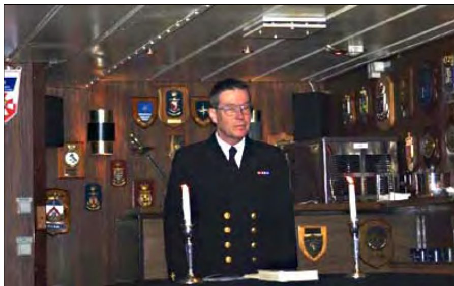
Da øvelsen var slut, holdt jeg en velbesøgt gudstjeneste i officersmessen.

Så er der nu kun i skrivende stund tilbage at få gjort grundigt rent i skibet. Efter travle øvelsesdage trænger skibet til en ordentlig omgang med sæbe og vand. Alle har brugt sig selv utrolig meget nu i tre uger, så trætheden begynder