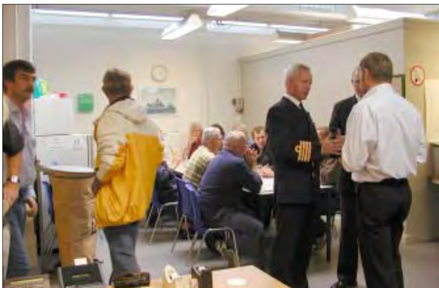
Og snakken gik i de nye lokaler.

Vi må håbe, at forsvaret nu, som i fremtiden, vil drage nytte af disse nye faciliteter på Depot Egø.