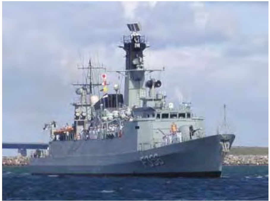
Korvetten PETER TORDENSKJOLD ankommer fra Middelhavet 20. maj 2004.

– Med hensyn til stabene kan der måske blive tale om en mindre omrokning, men på den anden side ved jeg endnu ikke hvor meget, for vi er jo ikke kommet så langt i implementeringen af den nye eskadre. Ligesom vi endnu ikke ved, hvor hurtigt strukturen skal implementeres – for ét er at sige, at den nye eskadre skal eksistere fra for eksempel 1. juli 2005, men det er jo ikke ensbetydende