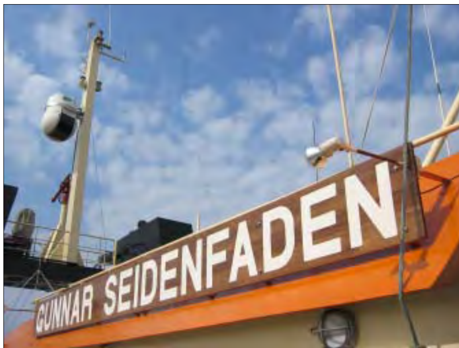
OSIS sensor placeret på GUNNAR SEIDENFADEN.

I samarbejde med Søværnets Operative Kommando og miljøskibet GUNNAR SEIDENFADEN blev der i april måned 2004 gennemført to togter i dansk farvand, under