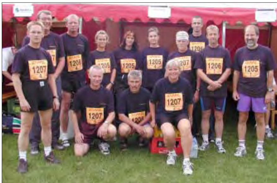
DHL stafetten blev afviklet i København mandag den 6. september.