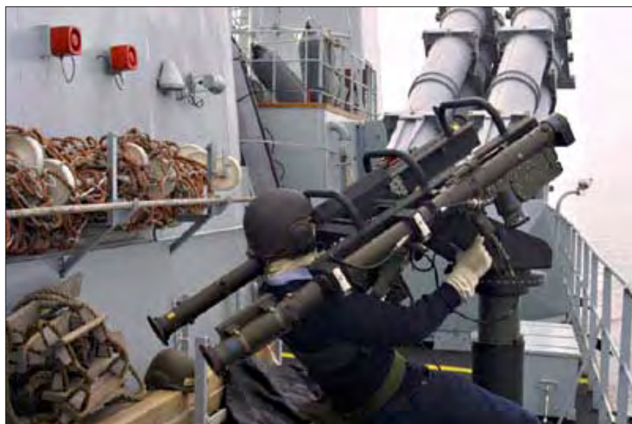
Vi blev for øvelse angrebet af to angorienske TORNADO fly, som det lykkedes os at få skudt ned – for øvelse.

Kl. 06 hylede sirenen, og der blev givet ordre til FOR ØVELSE, KLART SKIB. Vi var for øvelse sejlet ind i et minefelt. Her var der mange forholdsregler at tage. Først og fremmest skulle der etableres forstærket udvig på broen. Alle gaster skulle opholde sig over vandlinjen, hvorfor de, som har lukaf under vandlinjen, måtte medbringe madrasser og andet vigtigt grej op fra deres lukafer. Det vagt-