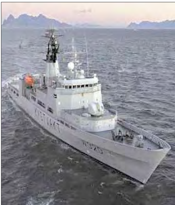
Det norske kystvagtskib ANDENES' søsterskib NORDKAPP W320.