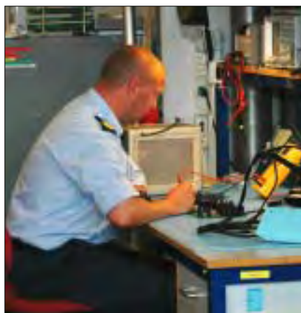
Der arbejdes ved bord 5.

KUS Drogden, Hestehoved, Stevns, Søndernor, Gedser, Helnæs, Møn,