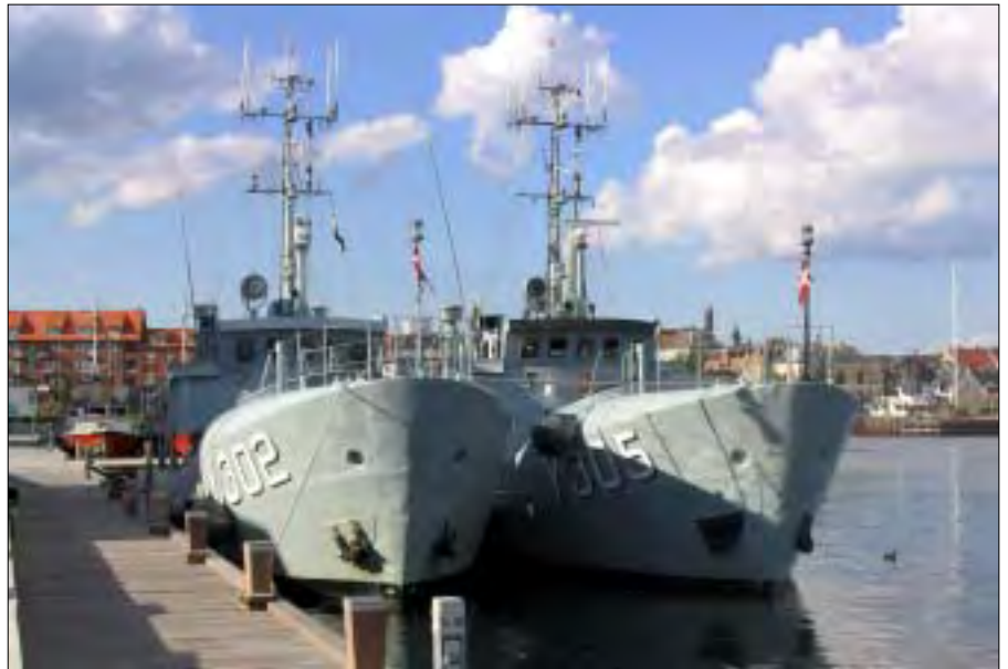
ROMSØ og VEJRØ i Nyborg den 22. juni 2004. SKA 15 og SKA 16 i baggrunden.

Til forskel fra Skoleskibsdivision 3, som i løbet af en sæson har samtlige årgangens kadetaspiranter om bord, såvel teknikere (kommende marineingeniører) som operative (kommende skibsførere), ser vi i Skoleskibsdivision 4 kun de operative. Undervisningen er derfor i høj grad målrettet mod gerningen som