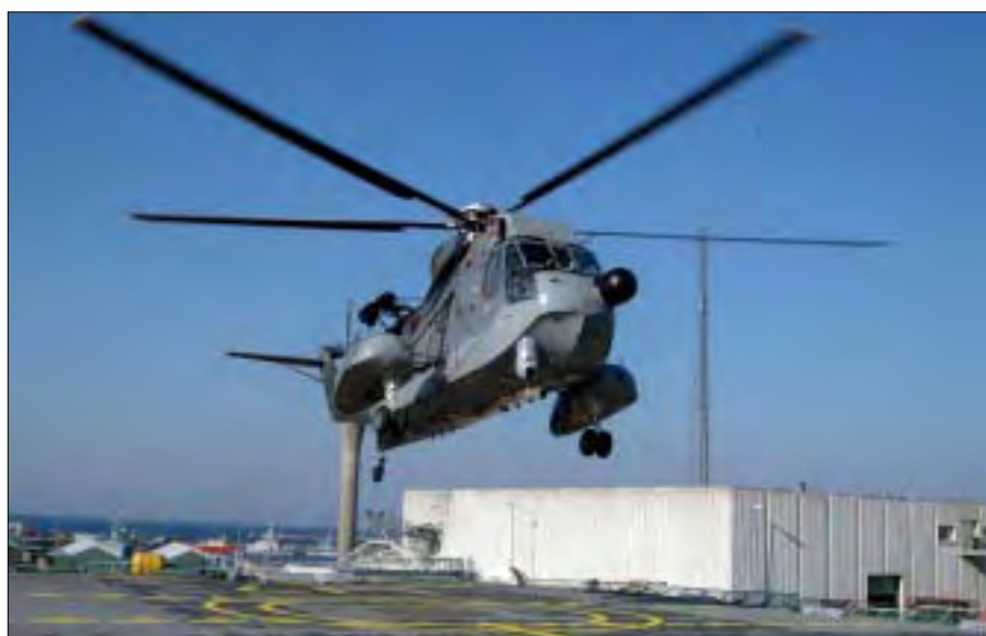
En Sikorsky S-61 "hænger" over ESBERN SNARE .

Patruljeskibene bliver bygget over det samme skrog som de fleksible støtteskibe, men kan løse andre opgaver. Den endelige bevilling til indkøb af skibene bliver formentlig vedtaget i efteråret 2006.