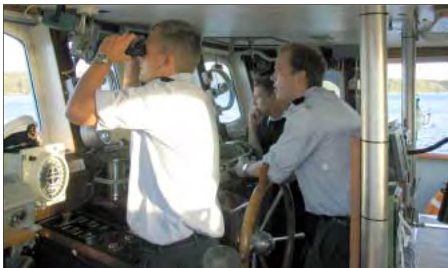
Kadetaspirant i rollen som vagtchef i Svendborg sund.

For at bidrage til at eleverne får opbygget et relevant farvandskendskab, tilstræbes det som udgangspunkt, at enhver elev efter opholdet i Skoleskibsdivision 4 har sejlet i rollen som vagtchefselev i Storebælt, Lillebælt, Limfjorden øst for Aalborg, Ørentvisten, farvandet omkring København samt Svendborg sund. Udover træningen i de nævnte farvandsafsnit prioriteres det undervejs at anløbe en række større danske havne, som eleverne i løbet af deres kommende virke som vagtchefer i søværnets skibe med stor sandsynlighed vil komme til at gense, for eksempel