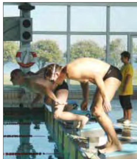
DMI Landssvømmestævne Læs mere på side 13

Stof fra dette blad kan frit anvendes. Der skal blot kildehenvises.