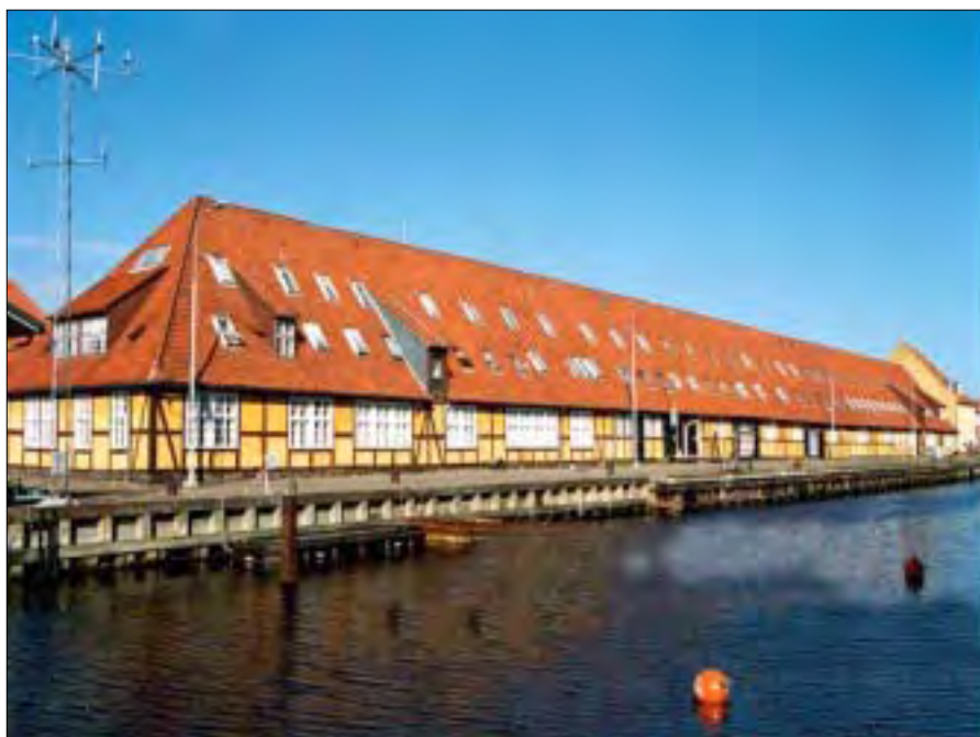
Forsvarets Personeltjeneste etableredes som den første af de nye funktionelle tjenester den 1. april 2005 med hovedsæde på Marinestation København i Søværnets Taktik- & Våbenskoles tidligere lokaliteter.

PF4 ”sørger for” de ca. 9.000 civile i forsvaret, og for at gøre det bedst muligt er afdelingen delt op i nogle elementer, der specialiserer sig i hver deres personalegruppe. Overenskomsterne for f.eks. materiel-assistenter, overassistenter og ingeniører er forskellige, og det samme er uddannelsesbehovene – derfor denne opdeling i elementer.