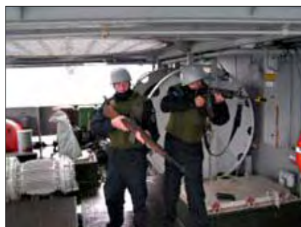
Der blev passet godt på skibene.

Søværnets nyeste skib ESBERN SNARE lå også på flådestationen i forbindelse med skibets installationsprogram. Skibet deltog derfor også i øvelsen og bidrog med eget forsvar samt assistance til resten af øvelsen. Klokken 19 kunne skibene igen stikke til søs for at fortsætte de opgaver, som de yderligere var pålagt at udføre i øvelsen.