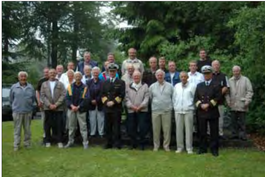
I år blev skovturen, som efterhånden er blevet en tradition, afholdt fredag den 17. juni.

I år blev skovturen, som efterhånden er blevet en tradition, afholdt fredag den 17. juni. Jeg tror, det er 7. eller 8. år, vi afholder denne. Jeg sendte brev med invitation til 45 medarbejdere, som er pensioneret fra Egø og Bøstrup. Heraf sagde 30 ja tak.