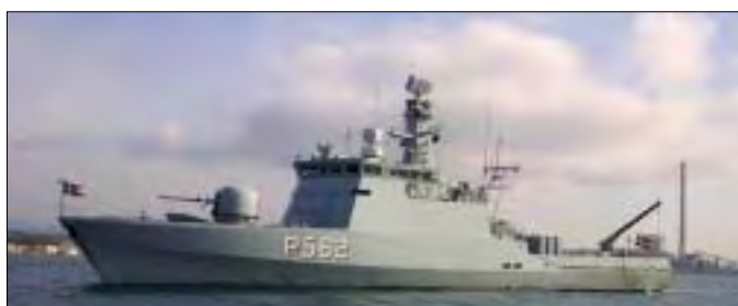
Situationen følges nøje på radarskærmen, mens patuljefartøjet VIBEN nærmer sig Storebælts- broen.