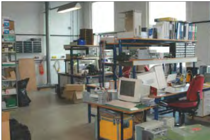
Nu bor vi i det tidl. undervandsvåbenværksted på Noret.

Radardrykningsholdet opstod i 1985, da NATO finansierede en række nye radarer af typen Cardion til opstilling rundt langs vores kyster. Radarerne skulle levere informationer, "radarspor/data", til det nye prestigefyldte FOD-CCIS system for overvågning af de danske farvande. I forbindelse med installationen af ny radar på Stevns blev senderbunkeren lavet så stor, at der her var plads til teknikerne. I takt med at de forskellige radarer begyndte levering af data, blev de tjenestesteder, der tidligere stod for farvandsovervågning, lukket. Marinstation Gedser, Marinstation