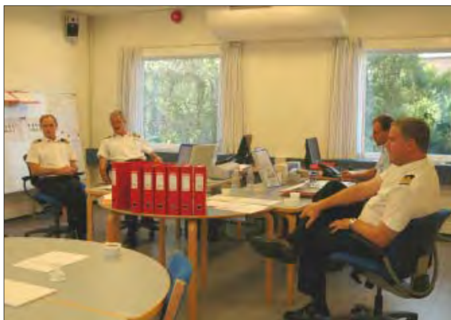
Fra den 9. september og frem til øvelsens slutning den 23. september var der døgnbemanding ved FLS.