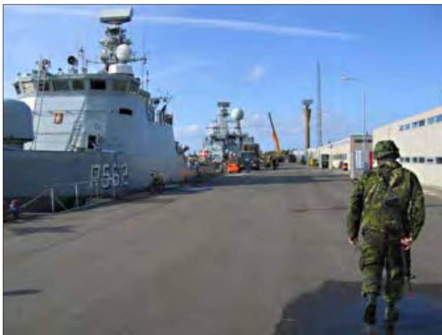
VIBEN ved kaj under DANEX 05.

Ekkoet, der forsvandt bag Sprogø, er klart identificeret som en mistænkt