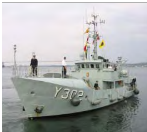
ROMSØ under manøvrerulle. Afgang Middelfart.

Besætningerne i ROMSØ og VEJRØ ser frem til endnu en sæson i uddannelsens tegn. I løbet af foråret 2006 forventes det, at en af kutterne skiftes ud med en MK I, således at sæsonen 2006 gennemføres med to forskellige enheder. Året efter følger MK II, hvormed kutternes æra i Skoledelingens tjeneste definitivt forventes at være slut!