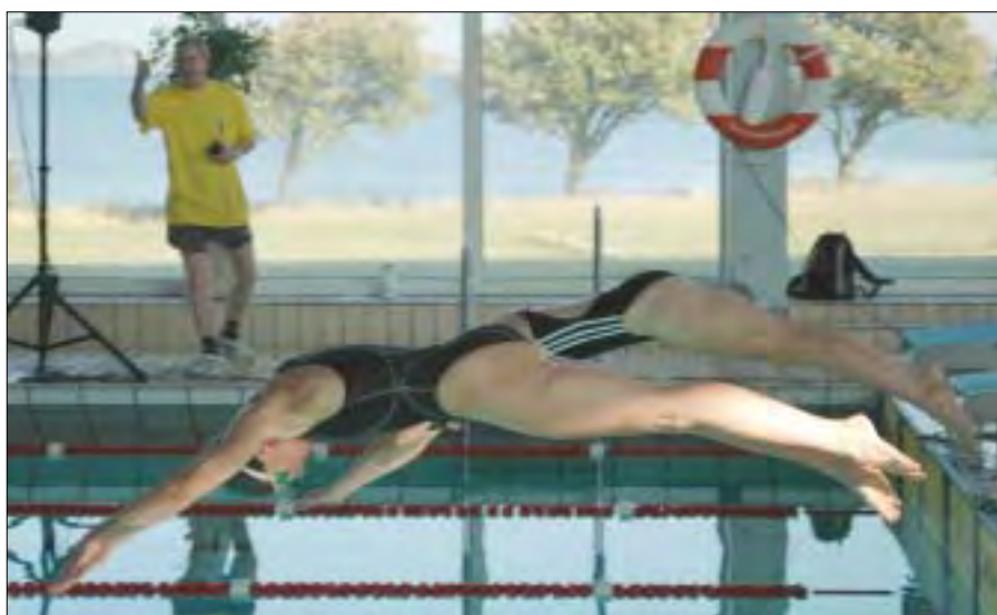
Starten er gået for damernes 50 m brystsvømning

Der var deltagelse fra 9 foreninger, og Søværnets Idrætsforening Korsør deltog med 2 medlemmer fra