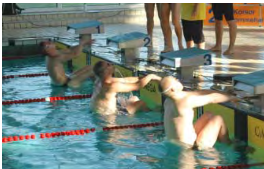
Svømmerne er sendt af sted til 100 m rygsvømning.

Til afslutning og som en lille personlig kommentar vil jeg godt takke alle de hjælpere, som deltog og gjorde stævnet til en god succes. Dette var det sidste stævne, jeg i idrætsforeningens regi har arrangeret. Jeg går på pension ved udgangen af november måned og vil godt her takke alle, som har hjulpet mig med idrætsforeningen, både da jeg var formand, og når jeg var stævneleder. Tak for en dejlig tid. Jeg håber, at der vil være nogen, som stadig vil hjælpe til, når idrætsforeningen beder om hjælp. Held og lykke fremover.