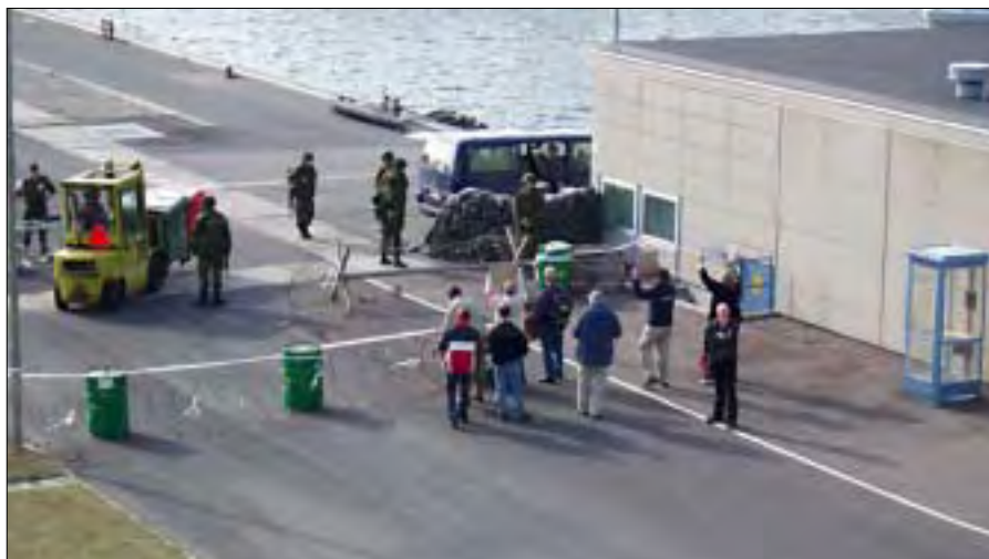
Demonstranter på flådestationen.

I indsejlingen mødte enhederne den første "udfordring", som var en lille båd med demonstranter. Demon-