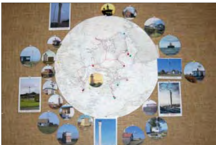
Hovedopgaven er service og vedligeholdelse af alle kystradarstationer.

Vores tjenestested blev flyttet til Korsør 1. januar 2005. Vi betragtede nu os selv som en udstationeret enhed, da vi selv skulle sørge for stort set alt, og da vores tjenestested nu befandt sig i Korsør, mente vi, at vi var berettiget til time- og dagpenge. Men nej, vi var jo på vores "faktiske tjenestested", hvor der nu hverken var kantine, postgang, messe, kon-