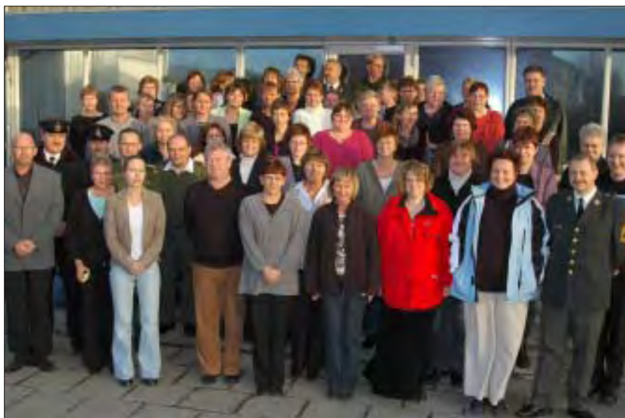
PF4 "sørger for" de ca. 9.000 civile i forsvaret.

processer, der udspringer af forsvarsforliget. For nogle medarbejdere på Flådestation Korsør er fremtiden usikker, og her har udstikkerne en stor opgave med at forsøge at besætte ledige stillinger rundt omkring ved hjælp af den genplaceringsliste, hvor PF4 registrerer alle, der ikke umiddelbart vil kunne tilbydes beskæftigelse i forsvarets nye struktur ved implementeringen af forsvarsforliget for 2005 – 2009. Det er vigtigt at kende alle medarbejders kvalifikationer og ønsker, og udstikkerne vil efterhånden tale med alle på genplaceringslisten – bl.a. om det meget væsentlige spørgsmål, hvor langt man er villig til at flytte efter et job?