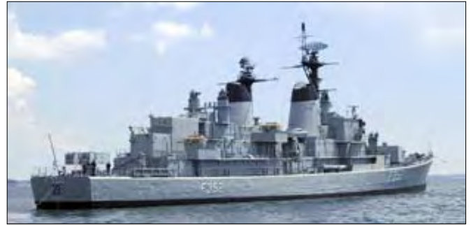
I Århus bugt den 5. juli

I perioden 6. juni - 5. juli var PEDER SKRAM på værft i Århus for at få en gang frisk maling.