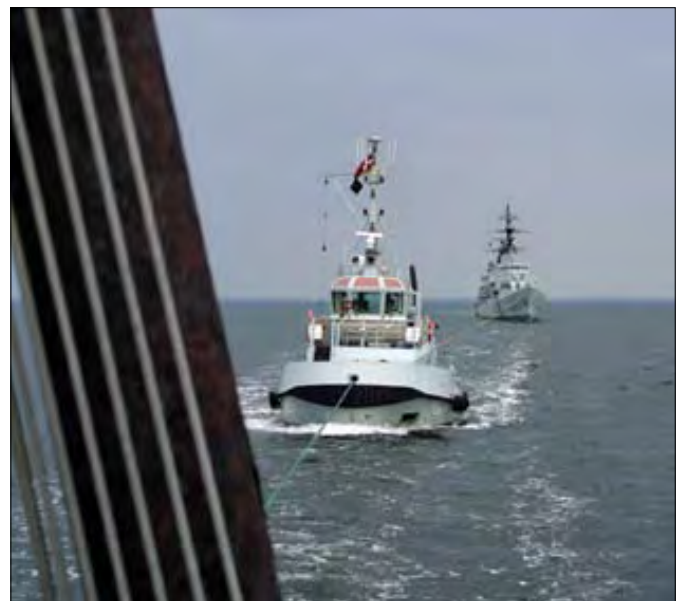
ARVAK og ALSIN slæber på PEDER SKRAM.

I januar 1988 strøg fregatten PEDER SKRAM kommando for sidste gang, og en epoke i søværnet var hermed slut.