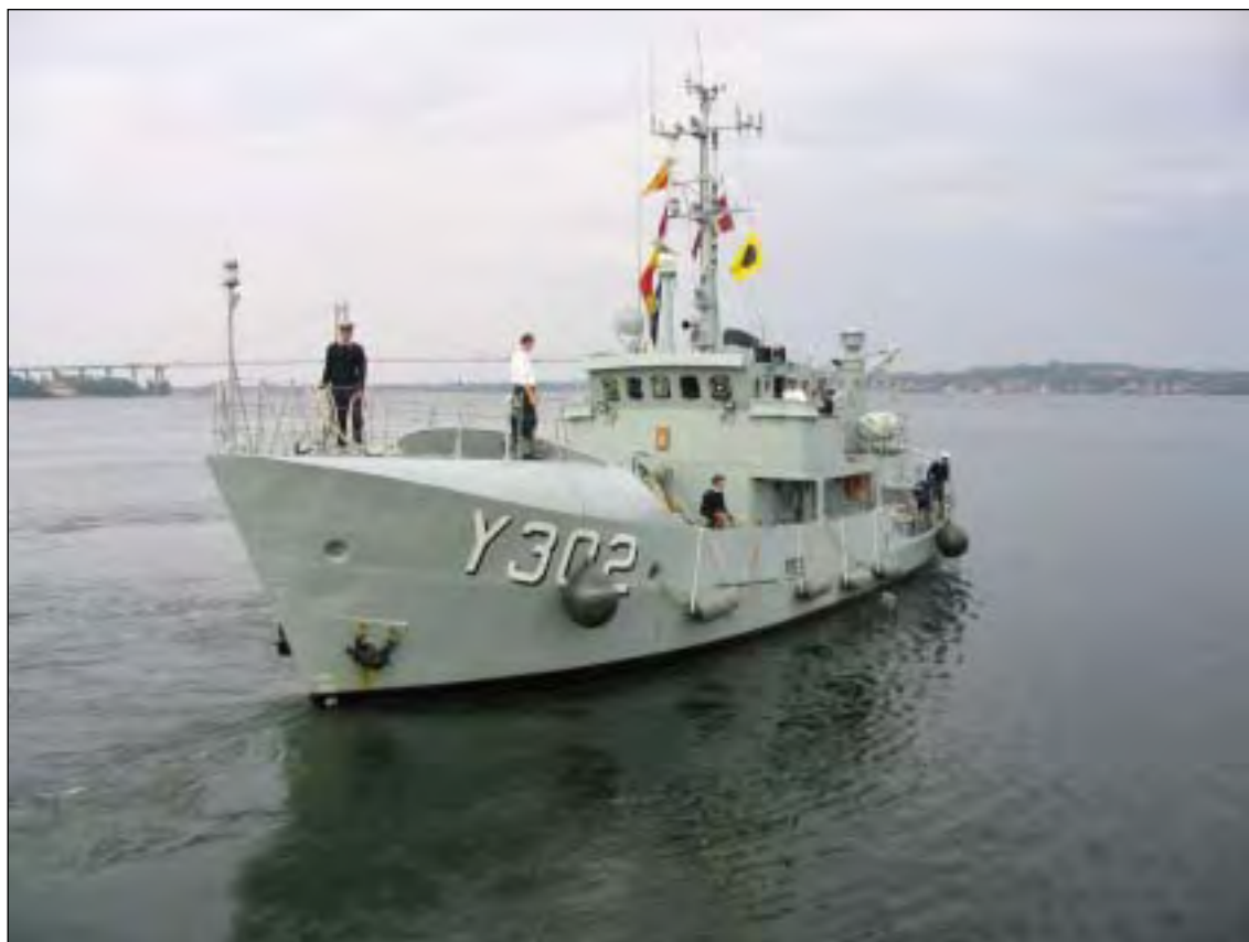
ROMSØ under manøvrerulle.