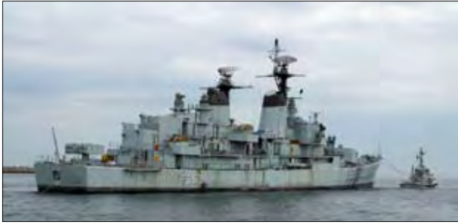
København den 6. juni: Slæbebåden ARVAK har fat i stævnen.

I perioden 6. juni - 5. juli var PEDER SKRAM på værft i Århus for at få en gang frisk maling.