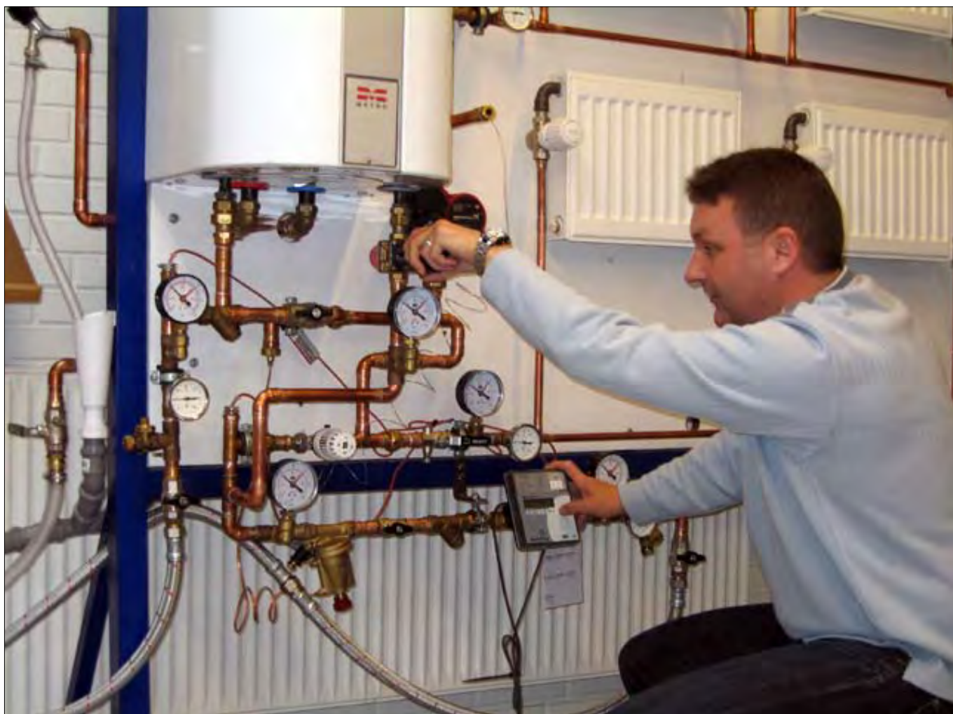
En af de varmetavler, der var lidt nemmere, men som vi ikke kom op i til eksamen.

Nu må vi så se, hvad fremtiden bringer os her i denne tid, hvor der bliver snakket så meget om udlicitering i Lokalt Støtteelement Korsør. Jeg håber dog, at Forsvarets Bygnings- og Etablissementstjeneste/Lokalt Støttecenter Vestsjælland/Lokalt Støtteelement Korsør kan afgive et bedre bud på vores arbejde end et evt. privat firma kan!