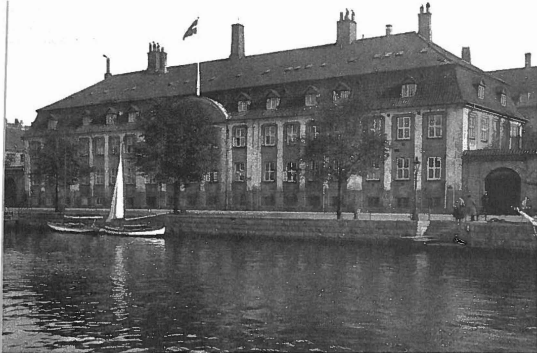
Søkvæsthuset, hvor Marinens Bibliotek har til huse sammen med flere andre sømilitære institutioner.