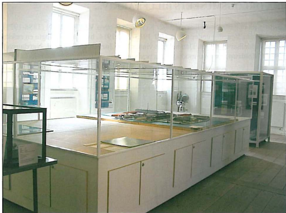
Dioramaet "Holmen 68" i sin nye permanente montre.