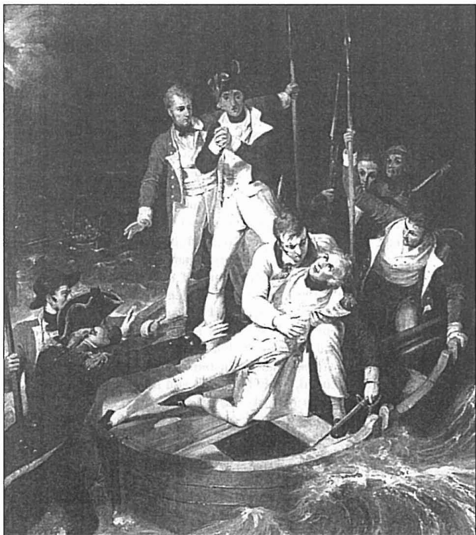
Nelson såret på Tenerife den 24. juli 1797. Richard Westall (1765-1836). National Maritime Museum, London.