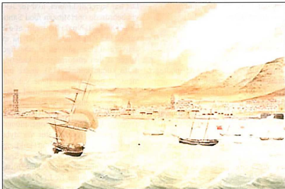
Santa Cruz, Tenerife. Akvarel af J.J. Williams, 1830. National Maritime Museum, London.

"...You are hereby required and directed to take the Ships named in the margin (11) under your command, their Captains being instructed to obey your orders, and to proceed with the utmost expedition off the Island of Teneriffe, and there make your dispositions for taking possession of the Town of Santa Cruz by a sudden and vigorous Assault (min udh.)....."