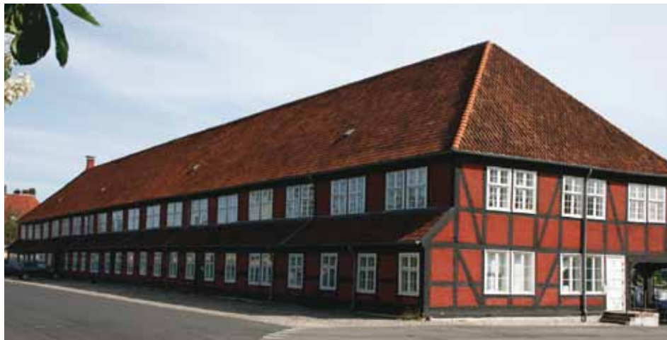
Spanteloftbygningen 2010 (Frank Horn 2008).

Her ses bygningen sandsynligvis i 1950erne. Til venstre på husets langside kan skimtes "Stoppebommen" og i højre side af billedet ses "Kontorhuset".