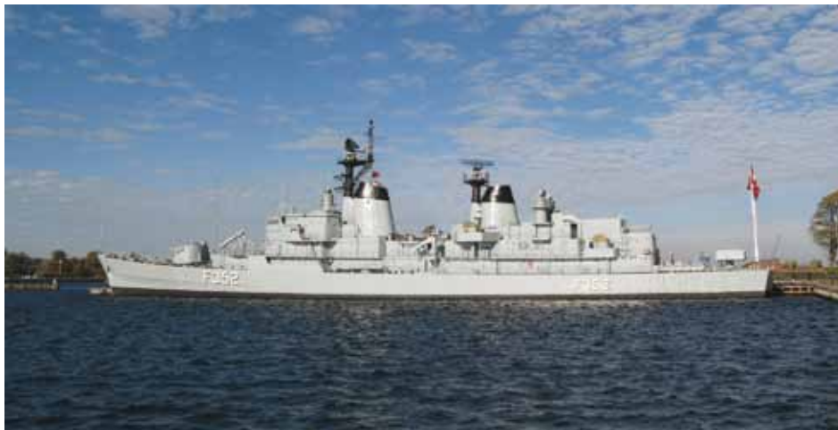
Fregatten PEDER SKRAM læns "Elefanten".

Kajstykket Elefanten er bygget op omkring lineskibet ELEFANTEN, som blev sænket i 1728 for at danne basis for en opfyldning af området. Længs Elefanten er fregatten PEDER SKRAM forøjet.