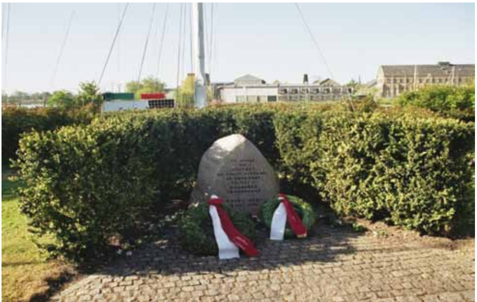
Mindesten for faldne i perioden 9. april 1940 – 5. maj 1945 (Frank Horn 2008)

gen fra Holmen placeret lige inden for Værftsbrovagtten, men er som så mange andre historiske effekter og mindesmærker reddet for eftertiden.