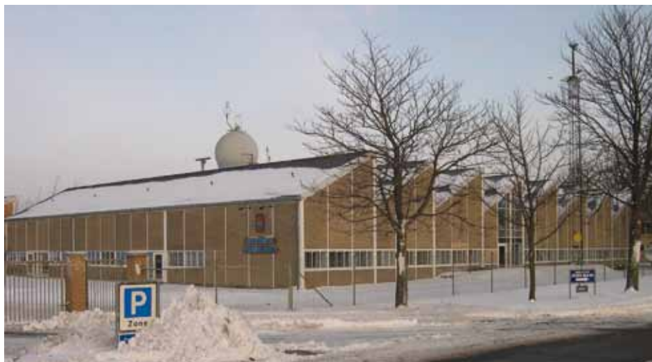
Den "savtakkede"

Da Torpedobådseskadren flyttede til Flådestation Korsør i 1992 blev bygningerne taget i brug af Søværnets Teknikskole, siden 2006 af Søværnets Specialskole og bygningerne benyttes i dag af bl.a. Søværnets Teknikkursus.