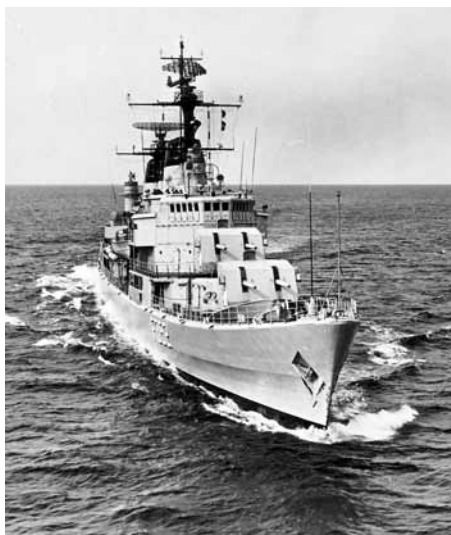
PEDER SKRAM før omarmeringen 1976-79.

Fregatterne strøg kommando den 4. januar 1988 og siden hen blev fregatten PEDER SKRAM oplagt læns Elefanten som museumsskib.