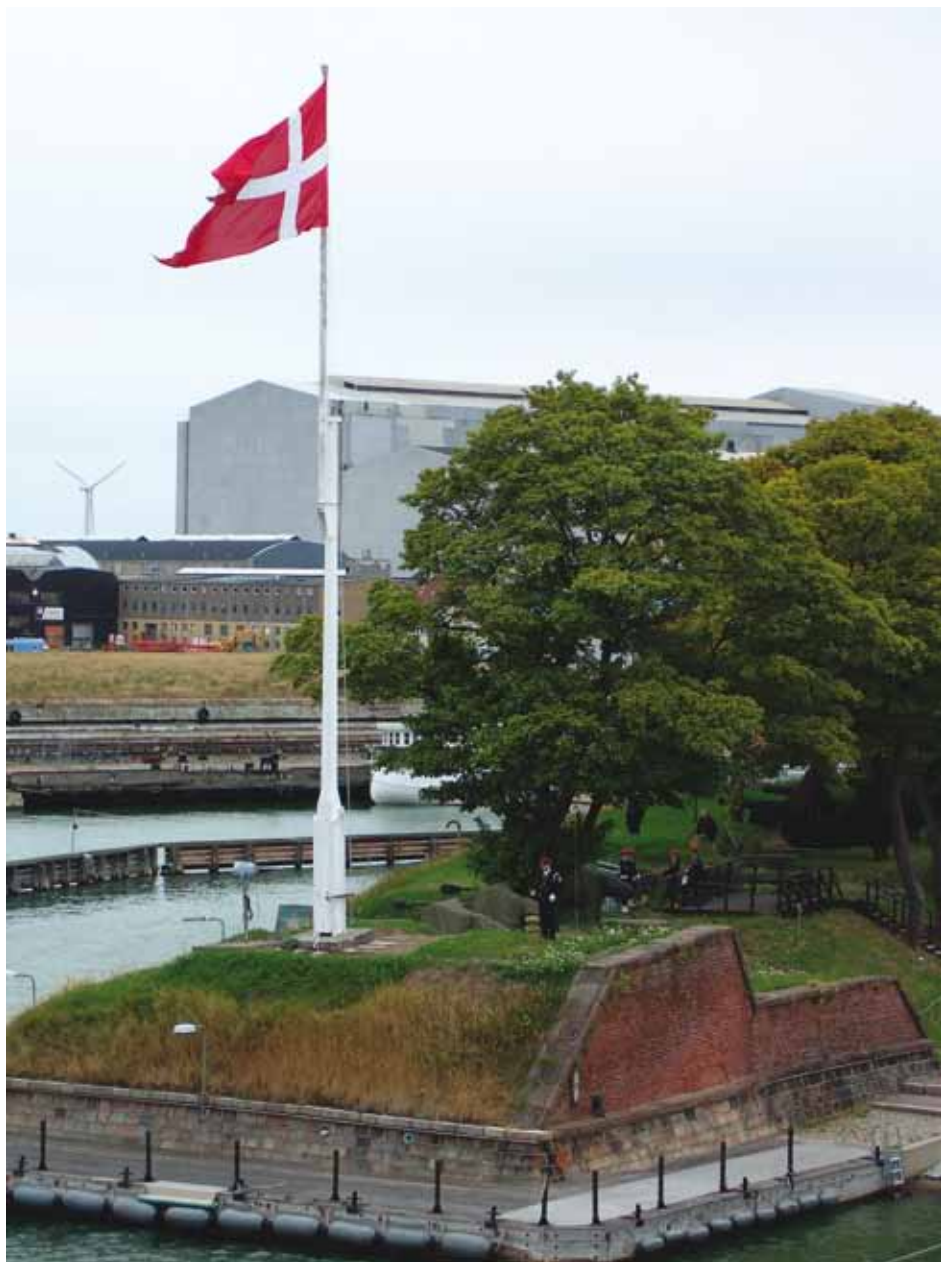
Salubatteriet Sixtus og Rigets Flag 2004.