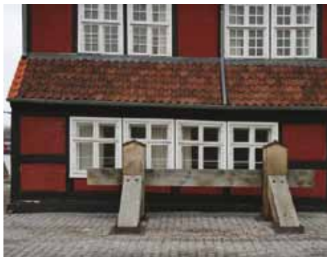
Stoppebom (Frank Horn 2008)

Stoppebommen, som står ved Spanteloftbygningens nordvestre hjørne, er et minde om skibsbyggeriet på Nyholm. Den hørte til bedding nr. 1 og var fastgøringspunkt for de trosser, som skulle bremse afløbsfarten på skibe under søsætning. Den blev benyttet sidste gang ved søsætningen af ubåden DRYADEN herfra den 3. juni 1926. På den store græsplæne, "Marsmarken", lå i sin tid i alt tre byggebeddinger. I dag er der indrettet idrætsanlæg og pladsen anvendes også som helikopterlandingsplads.