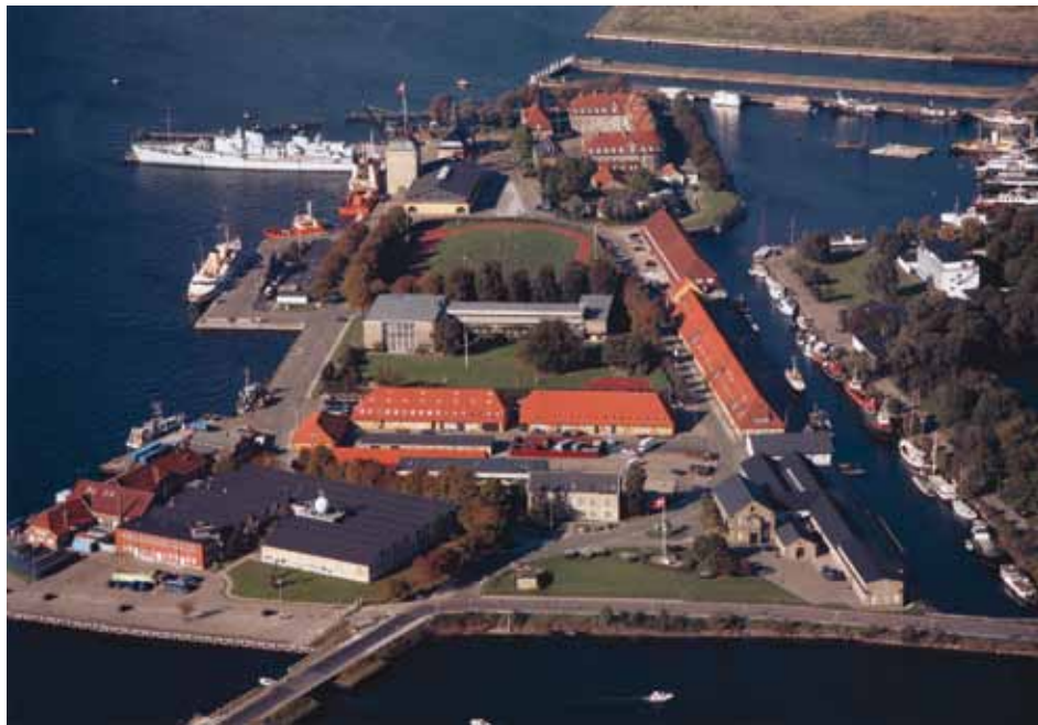
Nyholm 2006 (Bodil Hallstrøm Aasted)