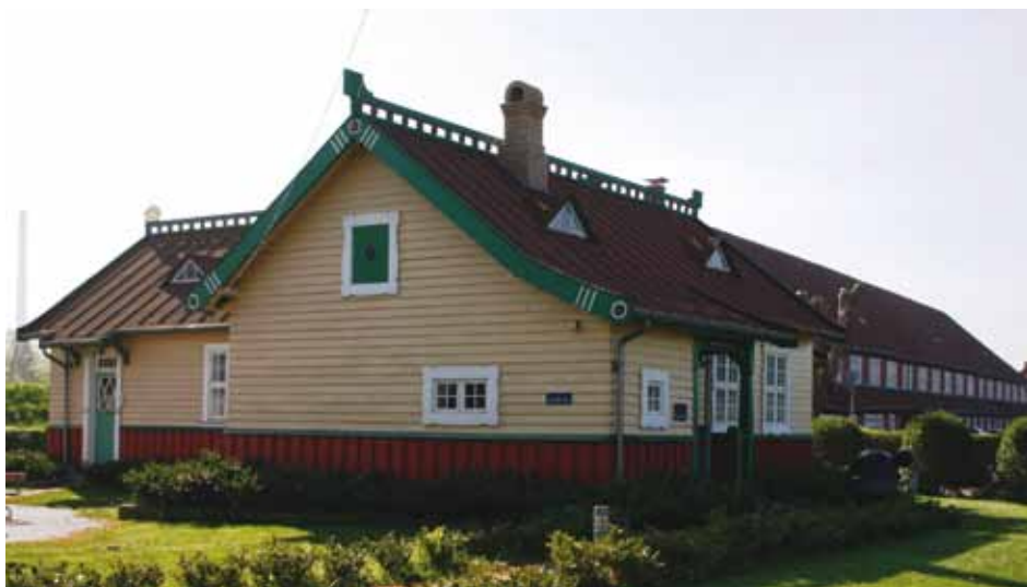
”Radiostationen” huser nu et radiomuseum (Frank Horn 2008)

Den gule træbygning med udskæringer og fantasifuld bemaling var Danmarks og sandsynligvis verdens første flåderadiostation. Bygningen, der i en årrække anvendtes som ”idrætshytte” ved idrætsanlægget på Frederiksholm, skulle egentlig være nedrevet i forbindelse med den store udflytning fra Holmen, men ved venlig donation fra en privatperson blev bygningen bevaret for eftertiden, og fremstår nu i sin fulde glans på Nyholm. Bygningen huser nu ”radiomuseet OXA”.