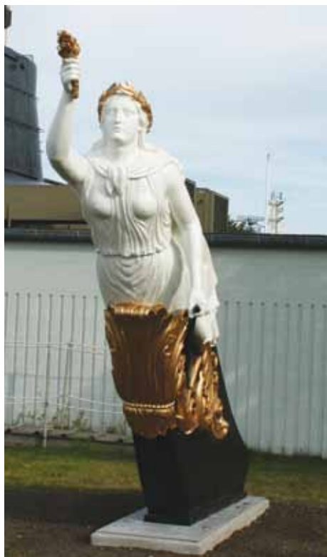
Galionsfiguren fra skruefregatten SJÆLLAND er placeret ved nordgavlen af Søværnets Officersskole på hjørnet af Bradbænken og Henrik Spans Vej. Figuren symboliserer Sjællands frugtbare agerbrug i form af en stærk og sund udseende kvinde med forgyldt kornneg i højre hånd og en plov i venstre. På hovedet bærer hun flettede kornaks. (Frank Horn 2009)

Galionsfigurerne ved Søværnets Officersskole stammer fra skruefregatten SJÆLLAND (1860-1885) og skruekorvetten DAGMAR (1861-1901). Ankeret ved skolens hovedindgang er fra panserfregatten PEDER SKRAM (1866-1885).