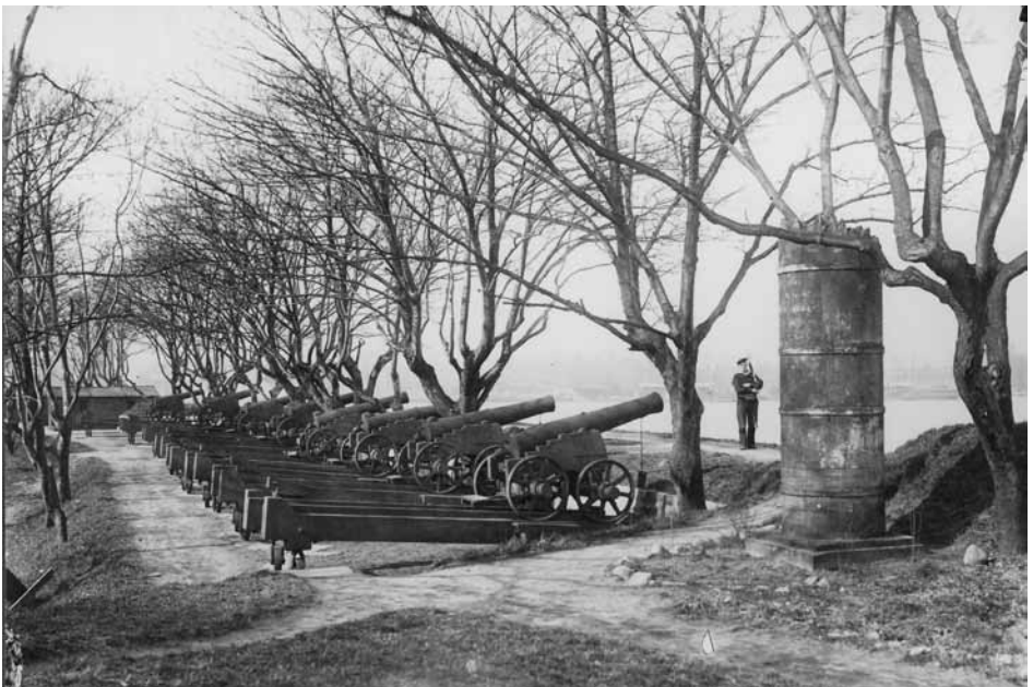
Batteriet Sixtus med mindestøtten for kaptajn Schrödersee.

Afkræfted – paa lange Sygeleye – opflammet – ved et Blik af – Danmarks Frederik – med Fyrstens Bifaldsraab – indviet – foer J.C. Schrödersee – fra dette Sted – bekjent med Krigers Død – den skjønneste – for eget Fædreland – i Møde – den 2den april 1801