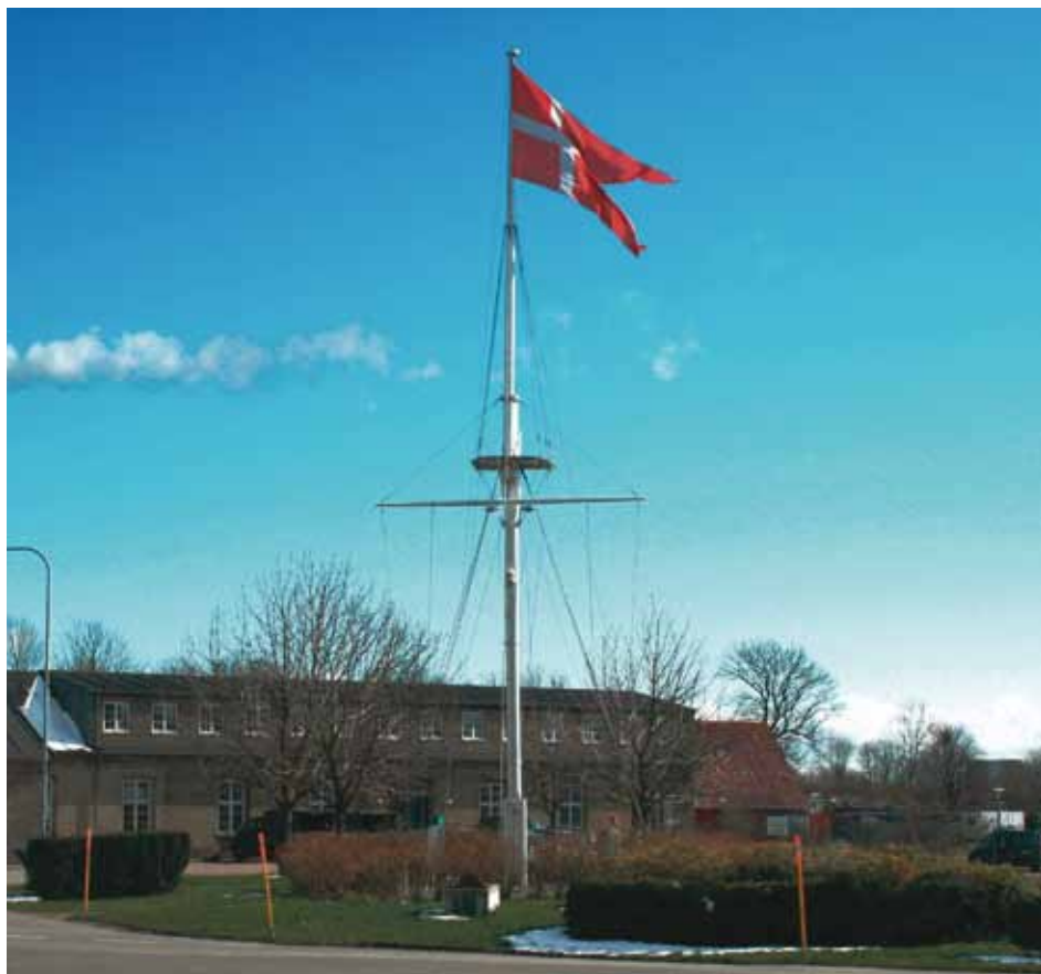
Flagmasten på Henrik Gerners Plads.

nedrevet i 1965 og i en årrække var der anlagt en parkeringsplads på stedet. Efter "Holmens udflytning" og omlægning af vejanlægget er der opført en flagmast samt placeret galionsfiguren fra lineskibet DANNEBROG (1853-1875) på Henrik Gerners Plads.