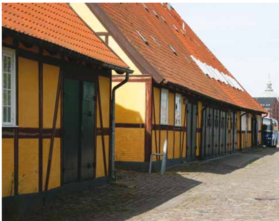
Gamle Vestre Takkeladshus. Her ses delingen af huset, hvorigennem der førtes en sporvej

I april 2005 etablerede Forsvarets Personeltjeneste sig på Nyholm, bl.a. i Gamle Østre Takkeladshus. Forsvarets Personeltjeneste flyttede ud af bygningen i 2009, hvorefter den har stået ubrugt.