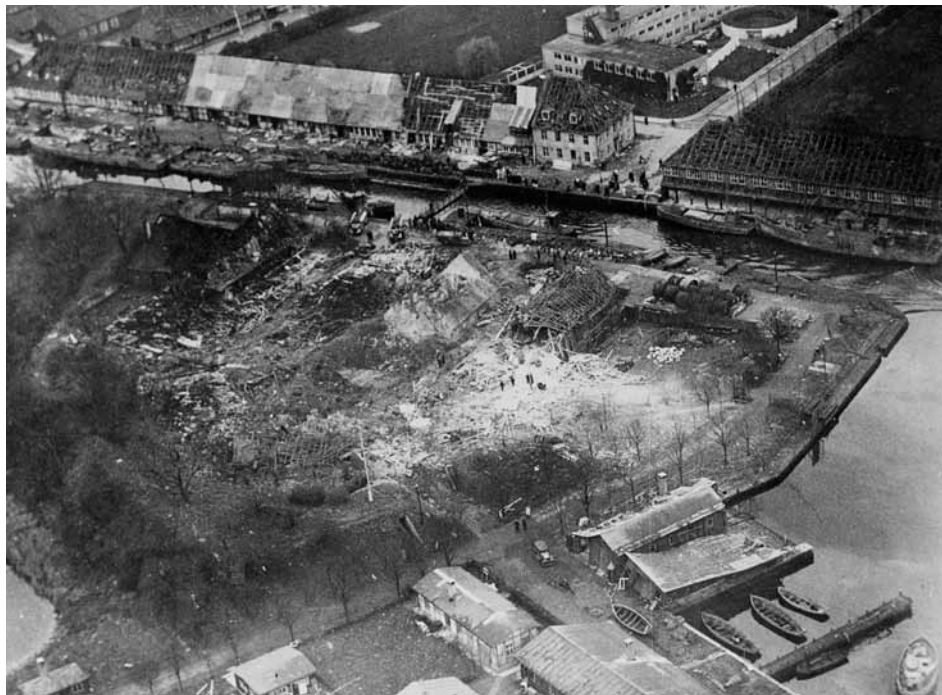
Quintus efter ulykken den 23. november 1951. Midt i billedet øverst ses tydelige skader på Gamle Østre Takkelladshus på Nyholm.

Det var her 11 miner eksploderede i et armeringsværksted den 23. november 1951 og udløste Holmen Katastrofen, hvor 16 personer mistede livet, heraf var de 14 brandfolk og 2 fra Søværnet, medens 78 personer blev såret.