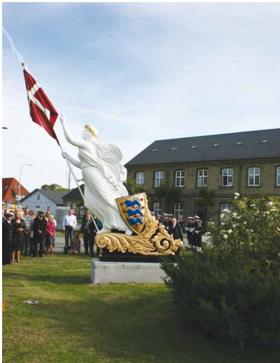
Galionsfiguren fra linieskibet DANNEBROG. I baggrunden ses Sømineværkstedet