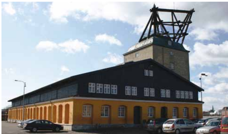
Planbygningen har dannet ramme omkring TV-serien “Ørnen” (Frank Horn 2008)

I 1913 mistede Planbygningen sit oprindelige tag, da den skulle tjene som kulgård. Senere har bygningen været benyttet som eksercerhus og indendørs skydebane indtil bygningen, som følge af ”Holmens udflytning” og afståelse af faciliteterne på Frederiksholm, blev indrettet som Holmens nye idrætshal.