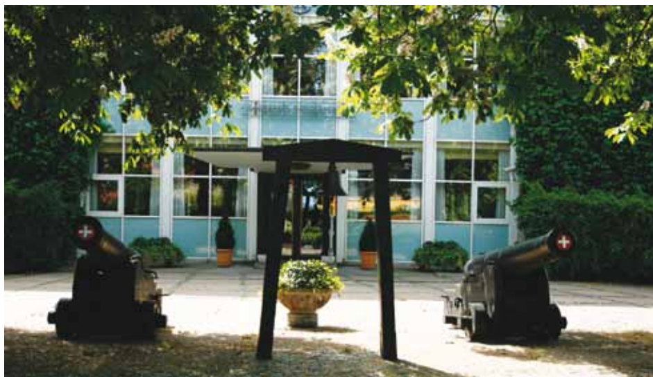
Hovedindgang med klokkestabel og to kanoner i rappertor (Frank Horn 2008).

Som en repræsentant for den nyere arkitektur rejser Søværnets Officersskole sig syd for ”Marsmarken”, som en moderne bygning i sten og glas fra 1938.