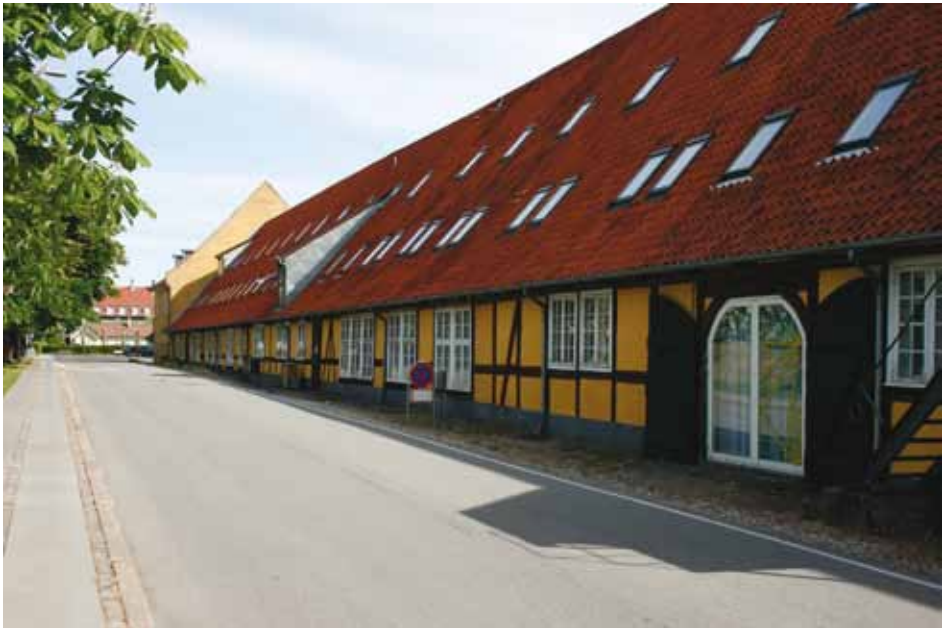
Gamle Østre Takkeladshus

Bygningerne har nogenlunde bevaret den oprindelige ydre form. Dog blev der i 1858 ført en sporvej gennem Gamle Vestre Takkeladshus, der desuden blev lidt afkortet i den østlige ende.