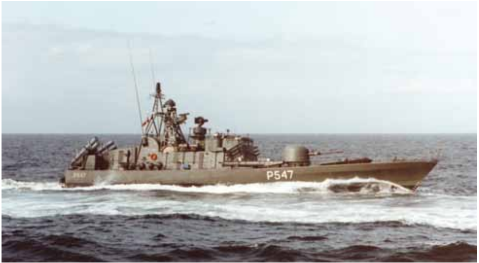
Torpedobåden SEHESTED under gang.

Nedenfor mastekranen, er torpedobåden SEHESTED normalt fortøjet. Torpedobåden overgik i 2001 til Statens Forsvarshistoriske Museum.