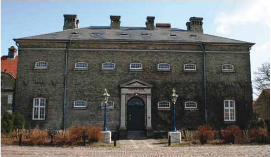
Holmens Arrest (Frank Horn 2008)

ring og tjente sit formål som arrest frem til 1973. Efter ”Holmens udflytning” har arresten været benyttet som museumsmagasin. Arresthuset er under indretning til ”Ubådsmuseum”.