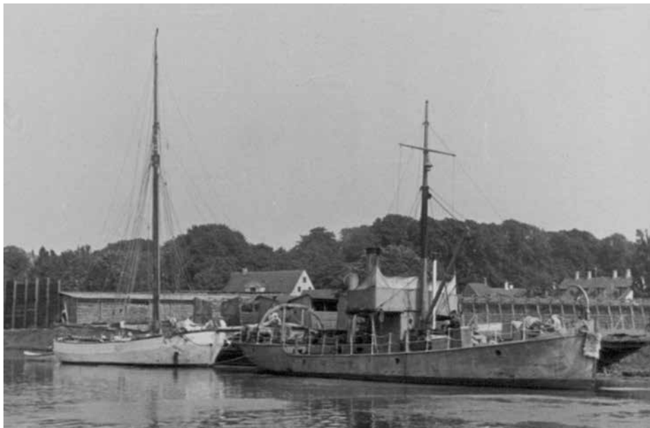
Øvelseskutteren SVANEN og DAMPBAAD A som tjente som øvelsesfartøjer for kadetterne. (FBIB)

skibet manøvrerede med paravaner, før der ankredes i Båring Vig. I løbet af dagen blev A-kadetterne undervist i teoretisk artilleri, B-kadetterne havde værkstedsuddannelse og C-kadetterne og aspiranterne navigation. I løbet af eftermiddagen mønstredes besætningen efter forskellige ruller. Der blev udlagt varpanker, hvorefter der gennemførtes to aftenskydninger.