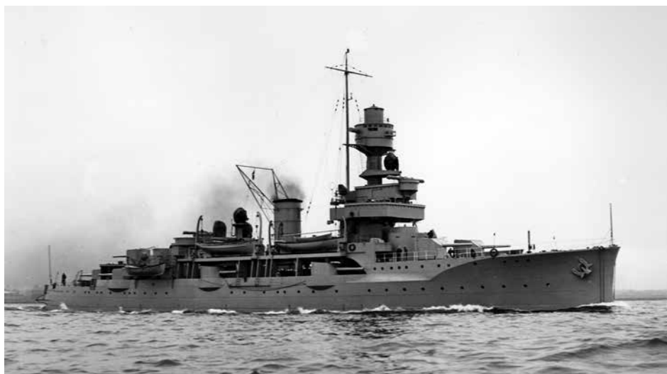
NIELS IUEL som artilleriskib efter ombygningen 1935-36.

Efter togtet til Middelhavet og kommandostrygningen den 3. september blev orlogsskibet NIELS IUEL oplagt på Holmen. Her lå det indtil 1935, hvor skibet gennemgik en mid-life-update (MLU) ved Orlogsværftet. Et moderne ildledelsesanlæg blev installeret og da NIELS IUEL hejste kommando i 1936 var det nu som artilleriskib.