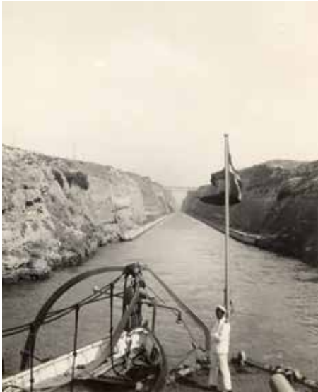
NIELS IUEL står ud af Korinther-kanalen.

dag, at ”der var bebyggelse hele vejen fra Piræus til Athen og at de pludselig så Akropolis, den ældgamle bydel med det kendte tempel ligge oppe over det hele”. Man besøgte nogle gamle ruiner og det store pragtfulde stadion.