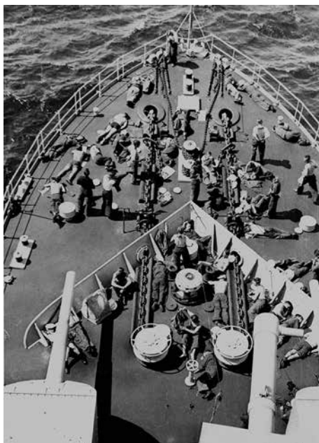
Der slanges på fordækket under middagshvil.

Så nås Gibraltar Strædet, et af verdens mest trafikerede farvande. Hver modgående damper, der passerer os kipper med flaget. Og agten fra har vi en hel lille flåde styrende strædet ind. Strædet er kun halvt så bredt som Storebælt og ser smallere ud, fordi der er højt land på begge sider. Overalt på fremskudte klippelejer er der bygget gamle forsvartårne og tunge fæstningsanlæg. Europa og Afrika har ikke set venligt til hinanden tværs over det snævre sund. Sydsiden er den frodigste. På disse bredder bliver det for meget af det gode, når fjeldskråningerne vender mod syd. Så svides de af sommersolen. Derfor trives alting bedst på Afrikasiden, der vender mod nord, og talrige småbyer og huse fordelt op ad skråningerne og ned i dalene taler tydeligt herom. Dette kalder de gamle ”Herkulesstøtterne”. Intet under, for når skyerne ligger tungt ned over bjergene på begge sider, kan det godt se ud som om