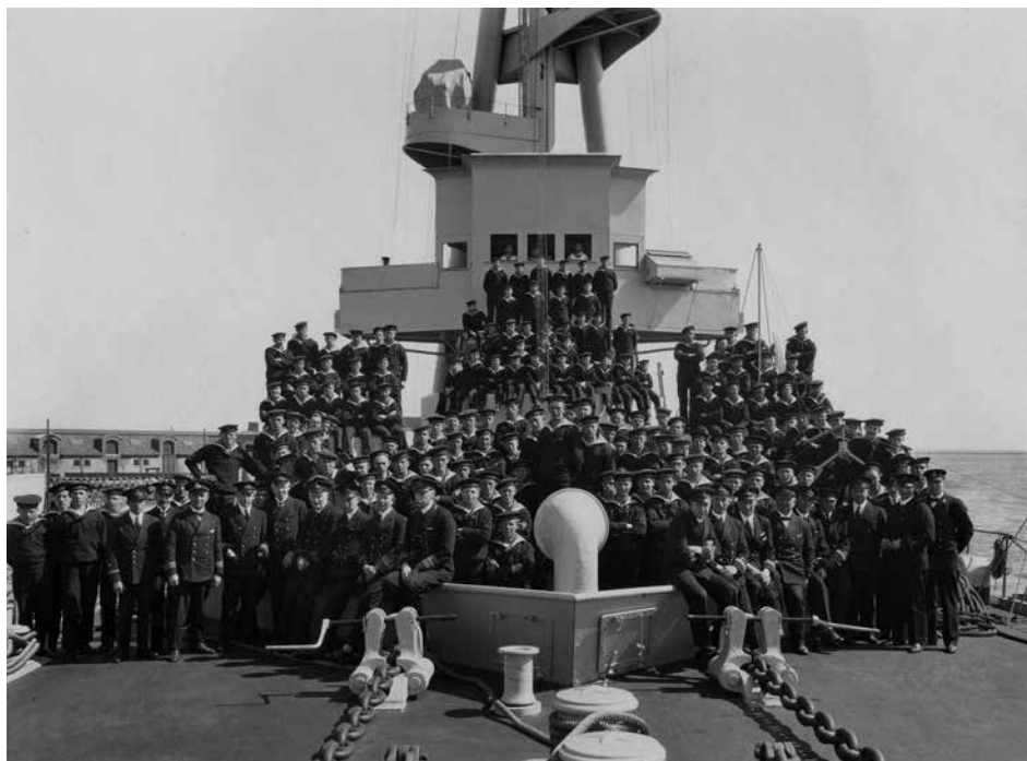
NIELS IUELS besætning talte 329 mand.

steriet til Flådestationen, at der i indeværende udrustningsår skulle medgives illuminationsmateriel til kongeskibet DANNEBROG og orlogsskibet NIELS IUEL. Orlogsskibet fik stor glæde og brug af det udleverede illuminationsmateriel under de mange anløb af såvel danske som udenlandske havne under sommertogtet. 5