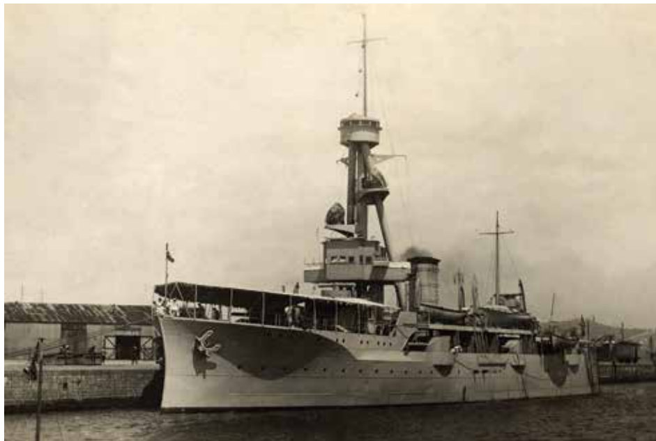
Togtet til Middelhavet var ikke NIELS IUELS første togt til udlandet. Her er skibet fotograferet i Montevideo, Uruguay, i januar 1924. Bemærk solsejlet, der dækker hele fordækket.

afskrev fra skibsjournalen. Dette er sidenhen indleveret fra Kadetskolen til Rigsarkivet. Endvidere er anvendt NIELS IUELS maskinjournal samt diverse skrivelser fra Marineministeriet, Flådestationen og Kadetskolen. Endelig har uddrag af chefen for orlogsskibets besøgsrapporter, som Marineministeriet sendte til H.M. Kongen, bidraget med væsentligt ”baggrundsmateriale”. Der blev i alt sendt seks rapporter; efter besøget i Konstantinopel (Istanbul), Odessa, Piræus, Genua, Algier og Bordeaux. Rapporterne blev afsendt fra Genua, Bordeaux, Aaben-