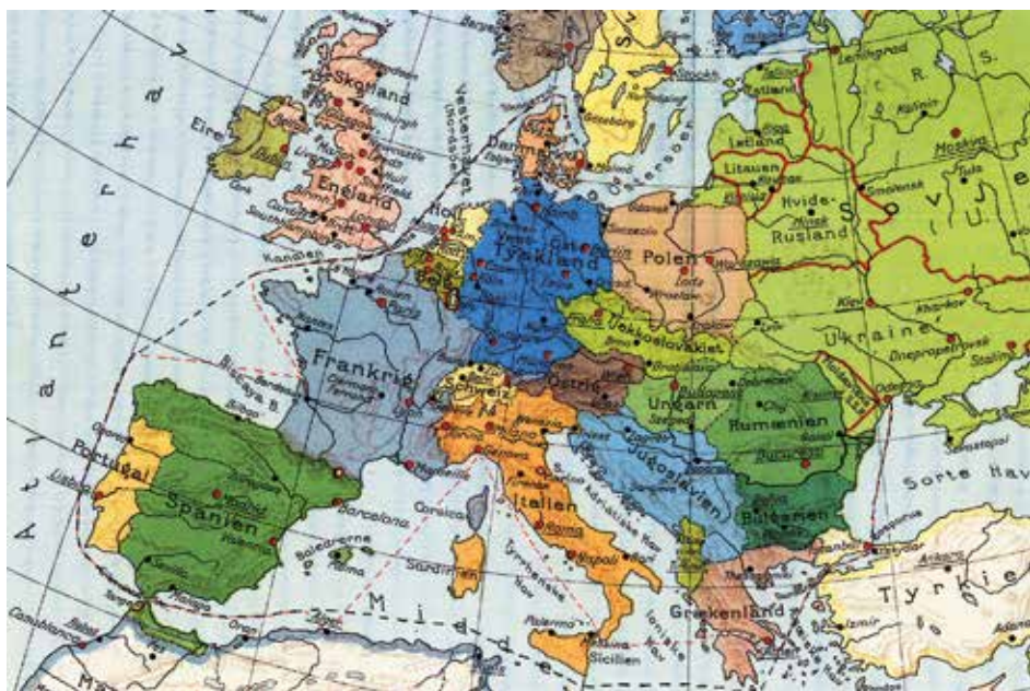
Sort streg er ruten ud, og rød streg ruten hjem. (Rute indtegnet af Søren Nørby)

fornødne anmeldelser eller fremskaffe de fornødne tilladelser hos respektive landes regeringer. 4