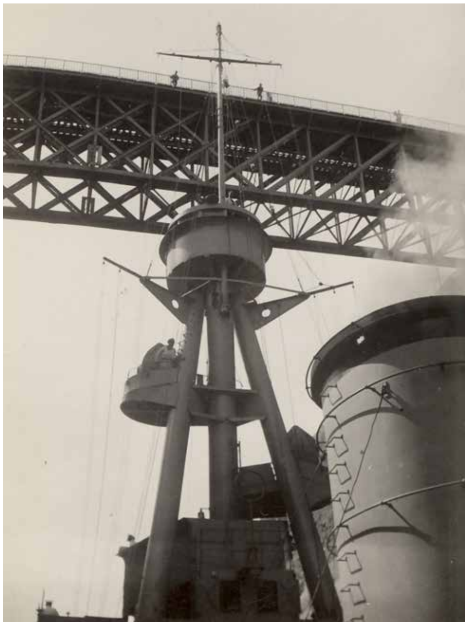
NIELS IUEL under en af broerne der forbinder de to sider af Korinther-kanalen.