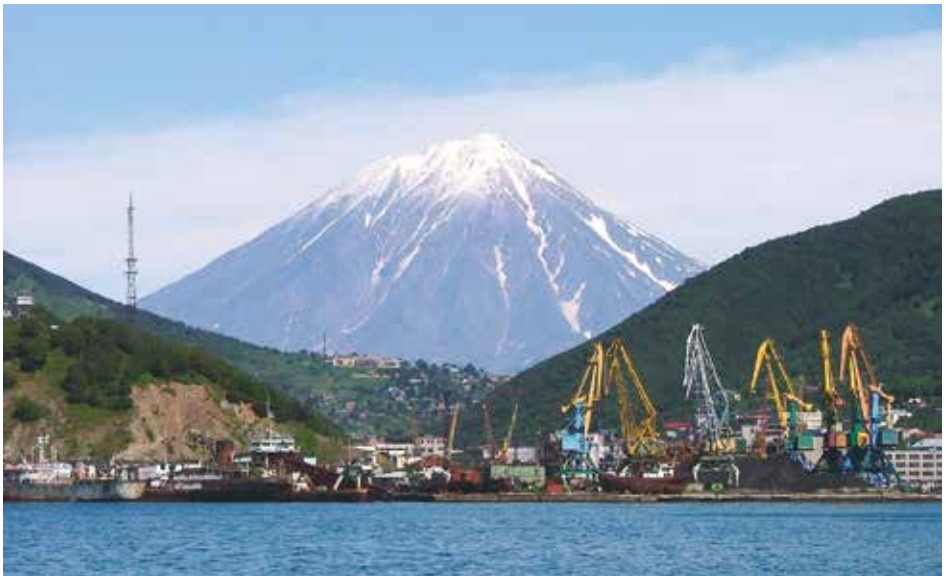
Hamnen i Petropavlovsk-Kamchatskij. Vulkanen Koriacky ses i baggrunden.

Detta randhav uppfattades från Moskväs sida som ett sovjetiskt inlandshav, det vill säga helt och hållet som sovjetiskt territorium. Internationell rätt gav dock att det juridiskt sett fanns internationellt vatten mitt i detta hav, dvs mellan det sibiriska fastlandet och Kamtjatkahalvön. Således fanns det