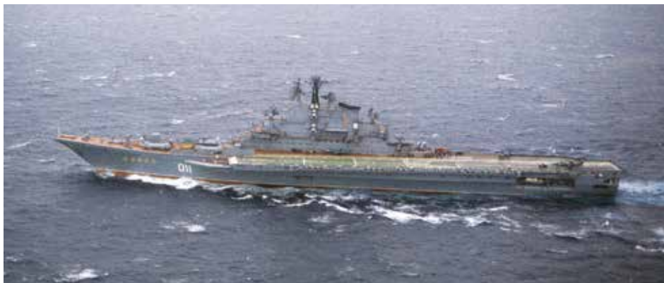
Det sovjetiske hangarskib MINSK, der var et af fire i den såkaldte KIEV-klasse. Skibene blev bygget i perioden 1970 - 1988. De havde et displacement på 37.000 ton og kunne medføre ca. 32 fly.

South Carolinas kustlinje, i september 1981 manövrerade en omfattande sovjetisk flotteskader utanför USA:s västkust och samma månad fast på andra sidan USA rörde sig fyra större sovjetiska örlogsfartyg längs med territorialvattengränsen utanför Oregon i flera dagar. Ständigt låg det också sovjetiska spiontrålare (såkallade AGI:s av NATO - Auxiliary General Intelligence ship) precis vid territorialvattengränsen utanför amerikanska örlogsbaser och lyssnade på signal- och radiotrafik. Envisa och påstridiga spiontrålare la sig mer än en gång i vägen för utlöppande amerikanska ubåtar för att kunna få bättre bilder och ur fler vinklar. Det finns även andra exempel på hur den sovjetiska flottan ägde ett mycket offensivt beteende under framförallt tidigt 80-tal, så till den grad att det det så kallade INCSEA-avtalets gäl-