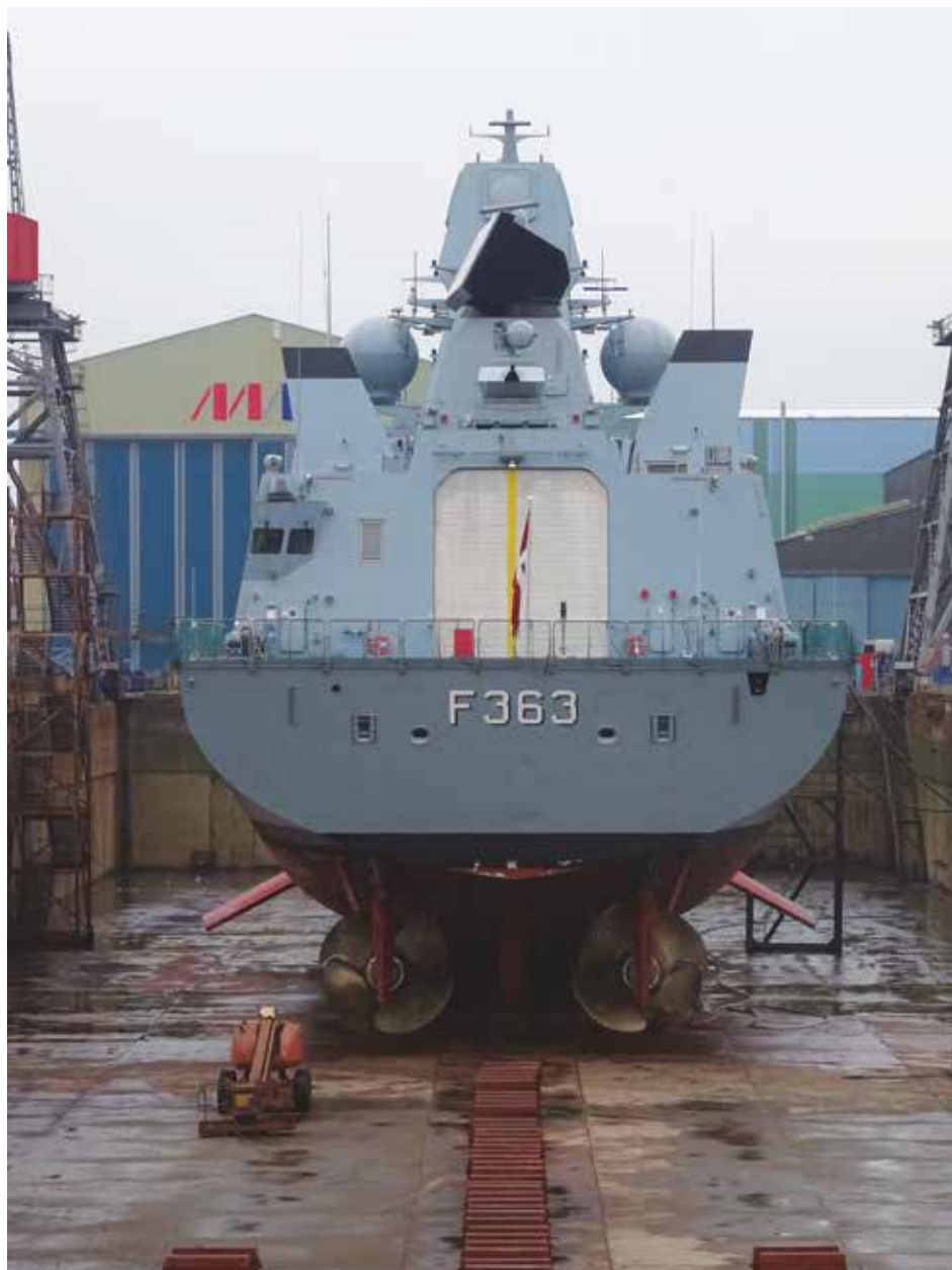
Fregatten F 363 NIELS JUEL i dok hos Fayard (ex Lindø) den 23. januar 2015. (Lars Jordt)