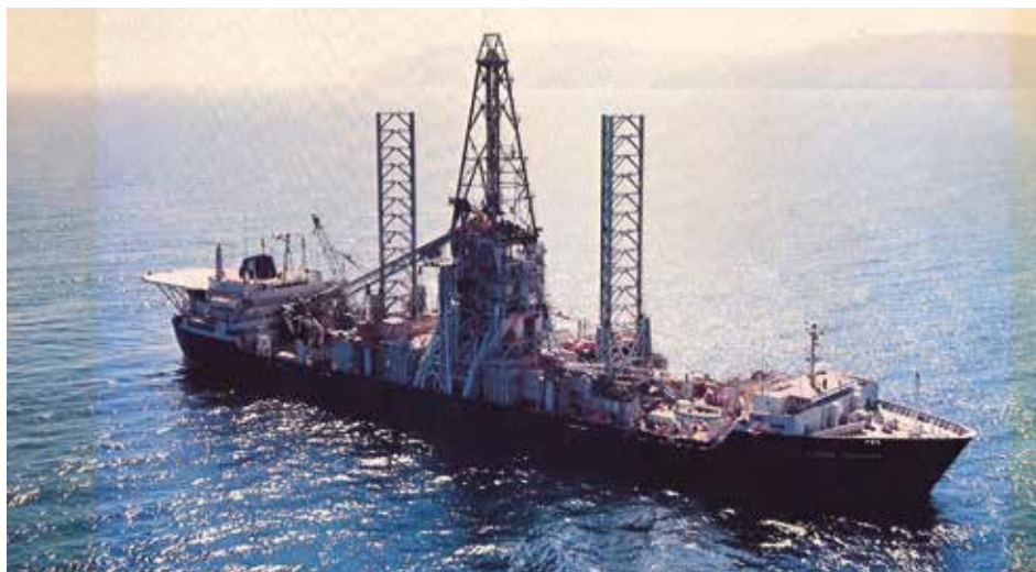
Forsknings / bjärnings-skibet Glomar Explorer.

största basområde och krävde som sådan en ständig bevakning från NATOs sida, inte minst eftersom hamnarna där var isfria året runt trots att de låg en bra bit norr om polcirkeln.