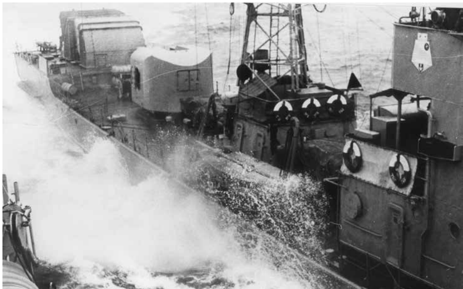
Den 18. april 1980 kl. 1410 sejlede den sovjetiske fregat af MIRKA-klassen ind foran den danske minelægger FYEN med kollission til følge. Skaderne på Fyen var heldigvis kun kosmetiske. (FBDP)