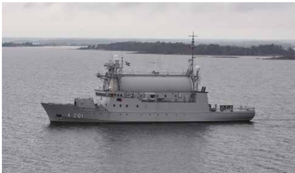
Det svenske Signalspanningsfartyget / Efterretningsfartøjet ORION.

spaningsfartyget HMS ORION rammades utanför Gotland i november 1985 av en sovjetisk minsvepare av Sonja-klass. Dagarna före incidenten hade en större NATO-övning genomförts i Östersjön, möjligen hade denna höjt irritationsnivån en del hos rysarna. Incidenten uppmärksammades även av amerikanerna, inte minst eftersom HMS ORION delvis hade byggts med hjälp av amerikanskt bistånd via underrättelsetjänsten NSA (National Security Agency). Det var inte första gången HMS ORION upplevde närkontakt med den sovjetiska flottan, året innan hade hon blivit lätt rammad av en korvett av NANUTJA-klass under uppdrag i Gdanskbukten. Ett annat gammalt känt tillfälle var när fregatten