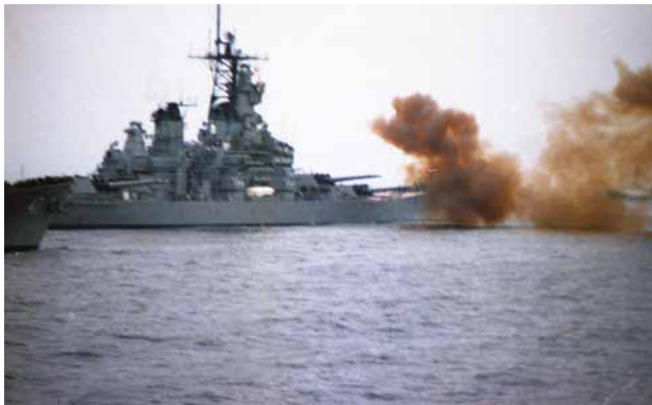
Slagskibet USS Iowa afgiver en bredside under en øvelse i Østersøen i 1985. Billedet er desværre lidt rystet, da trykbølgen fra breddsiden åbenbart har "ramt" fotografen.

Det säger sig därmed självt att det blev trångt i Östersjön och det finns flera exempel på incidenter då örlogsfartyg kom för nära varandra och kanske till och med kolliderade. Ramning var ett tag en mer eller mindre vedertagen taktik från Warszawapakts sida för att tydligt markera gentemot västliga och neutrala fartyg att man låg för nära känsliga operationer eller övningar. Bland de mer kända exemplen för svenska vidkommande torde vara när signal