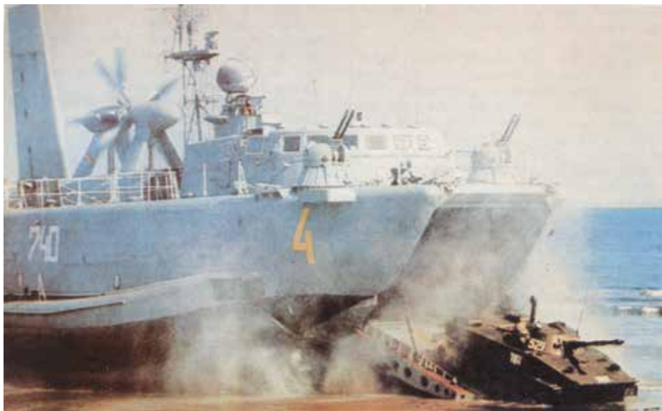
Sovjettisk luftpudebåd af AIST-klassen landsætter en kampvogn på stranden under en øvelse. Luftpudefartøjerne havde en høj hastighed om kunne fra sovjettisk kontrolleret område nå Danmark og Sverige indenfor fra 30 minutter til få timer.

uppe i Luleå skärgård bedrevs ubåtsjakt. Den ena avlöste den andra. Hela denna bild av skarpt läge som målades upp via TV-nyheterna gav en för allmänheten ganska samstämmig bild. Sverige befann sig i ett allvarligt läge, en skarp situation och den ansiktslöse fienden från öst var oss nära, på tröskeln mer eller mindre. Kort sagt var hotet på allvar. Var och en som följde situation på håll kunde också förstå att Östersjön, eller Fredens Hav som det ibland kallades av vissa, var ett hav fyllt till bredden av örlogsfartyg och ubåtar från både Öst och Väst. Runt Östersjön fanns det hela sju olika flottor som bedrev militär verksamhet.