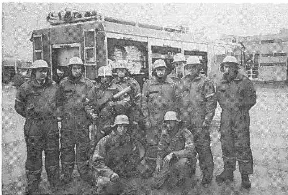
Flådestation Frederikshavns værnepligtige brandhold.

Ved ankomst til skadesstedet konstateres det, at der var brand i et par køretøjer på kajen. 40-50 sårede personer lå spredt i området på kajen samt om bord på en gastanker, der lå fortøjet ved siden af. Brandholdet blev af indsatslederen bedt om at begynde brandbekæmpelse samt at foretage eftersøgning af sårede/indespærrede i tankskibet. Røgdykkerne indsattes umiddelbart i eftersøgningsopgaven om bord i tankskibet.