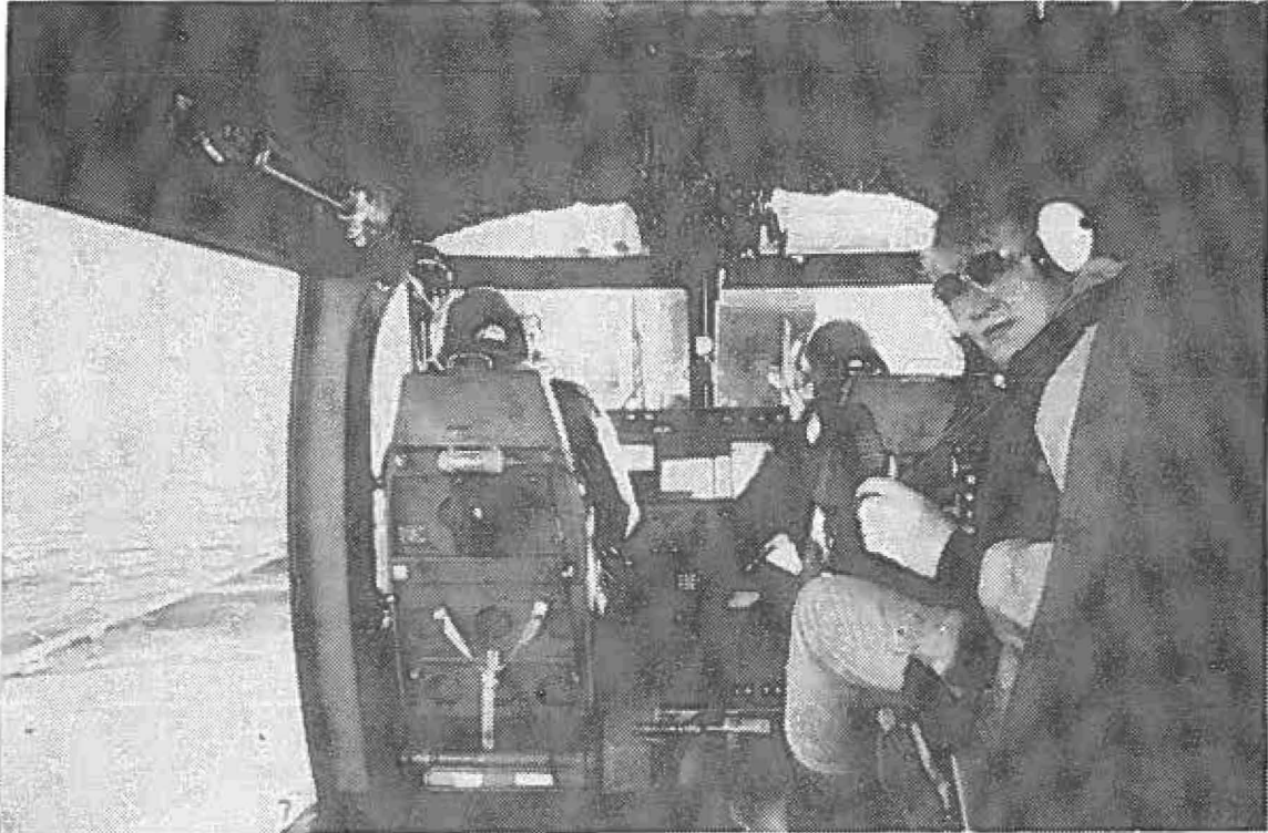
Klar til start. INGOLFs helikopter øver brug af hoist.

Inspektionsskibenes vigtige arbejdsredskab er LYNX-helikopteren. De anvendes til overvågning og opklaring samt til søredning og til transport.