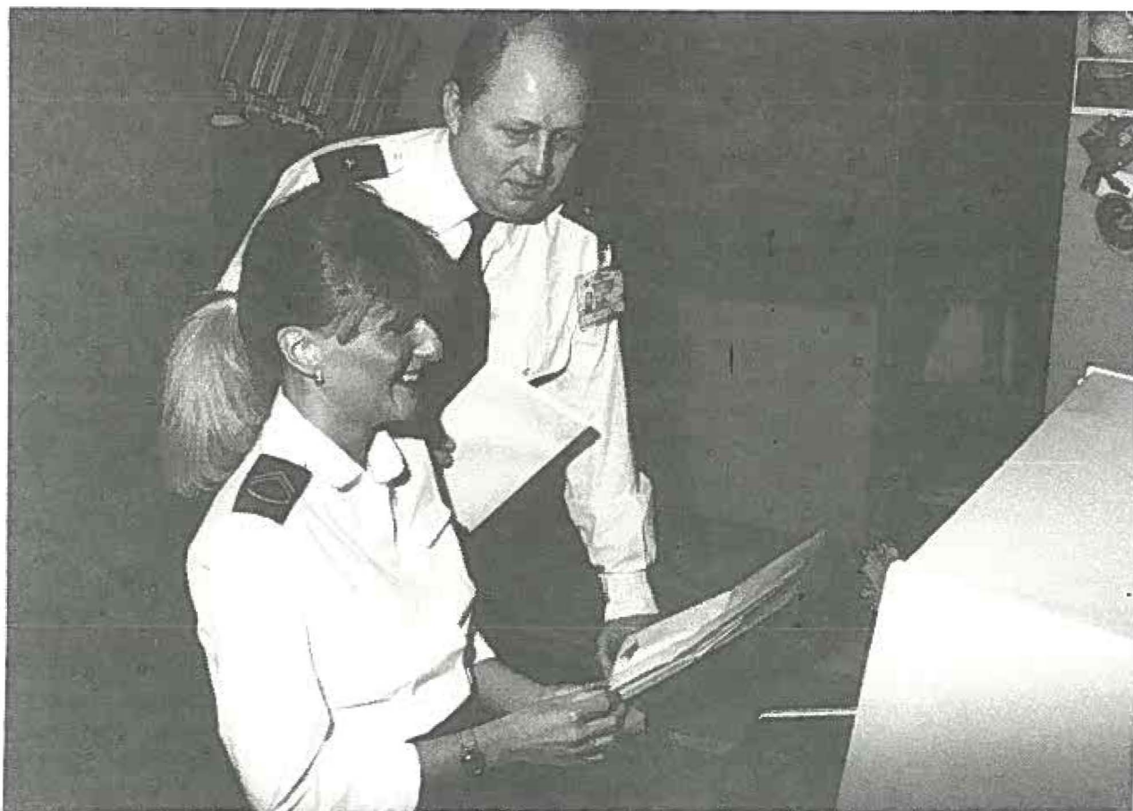
Vagtholdsleder og kvindelig mariner på mobiliseringspost i Forsvarskommandoen under øvelse WINTEX-CIMEX. (FKO FOT).