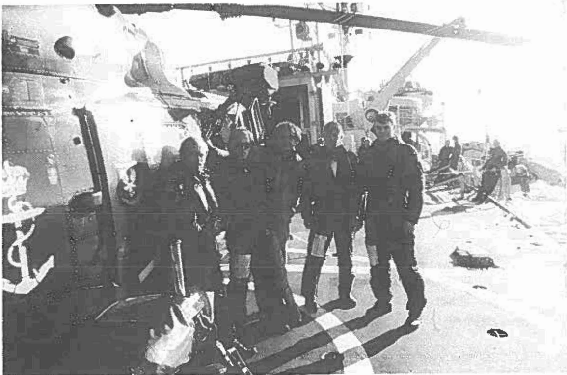
INGOLFs helikopterbesætning tager et hvil. (Carl B.FOT).