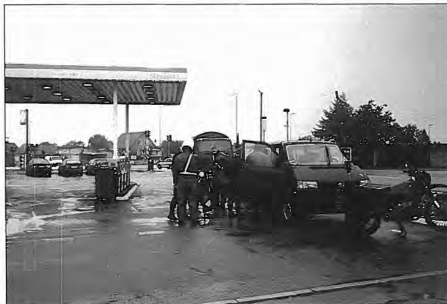
Kolonnen er standset for tankning af MC'ere