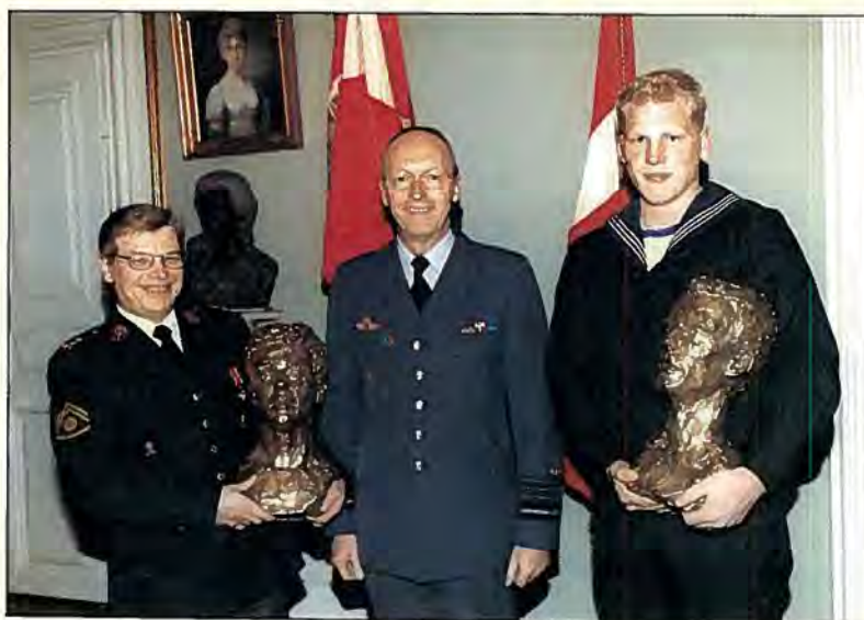
Forsvarschefen og hans to »bærere«