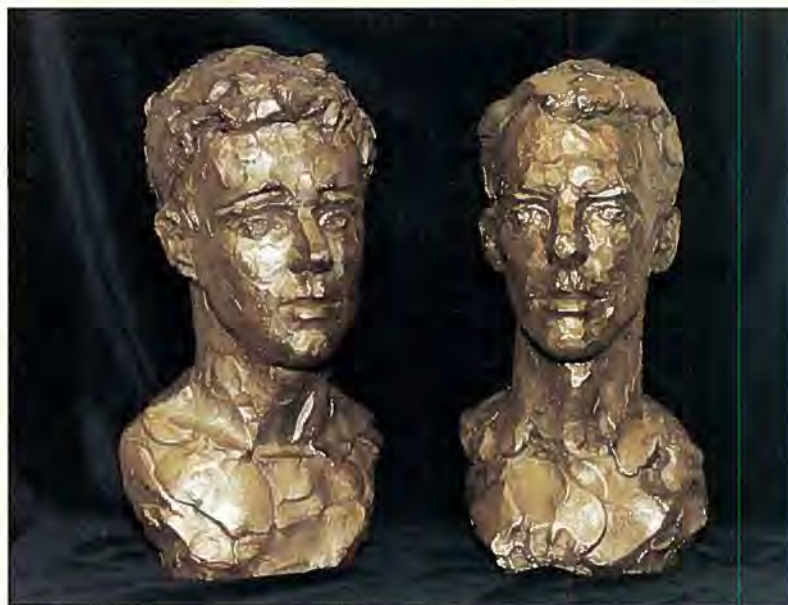
De smukke buster af de to Kongelig Højheder Kronprinsen og Prins Joachim

Forsvarschefen har tilskrevet samarbejdsudvalg og kontaktudvalg således: