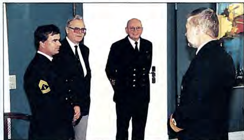
Chefen for Materielkommandoen priser initiativet