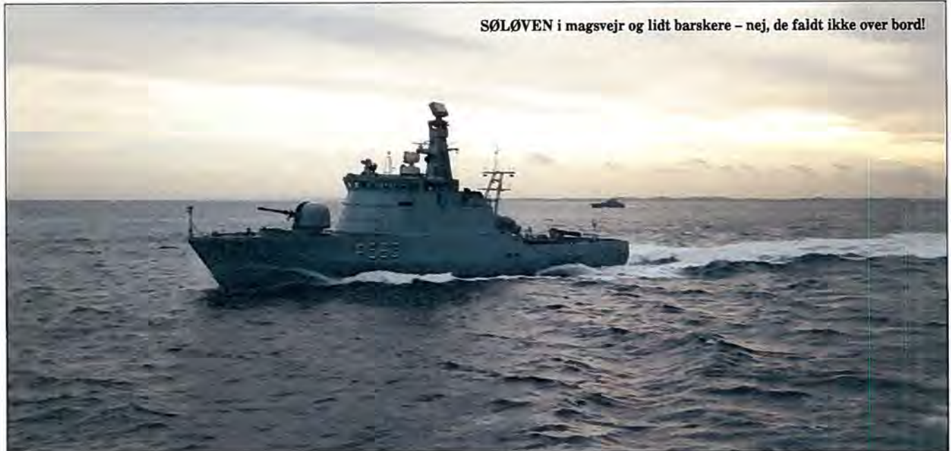
SØLØVEN i magsvejr og lidt barskere – nej, de faldt ikke over bord!

Søværnet kan betragtes som kulturelt forskellig i forhold til det omgivende samfund, fordi de kulturelle koder og deres anvendelse i det daglige liv på skibet er meget anderledes. Nedenfor vil jeg vise, hvordan søværnet er en social verden, der henviser til sig selv, når snakken går i messen. Jeg mener at man kan forklare dette ved at forstå de ændrede grænser der er imellem hvad der er privat og hvad der er offentligt ombord på skibet . Her er der tre dimensioner af forholdet imellem det private og det offentlige vi må fokusere på: