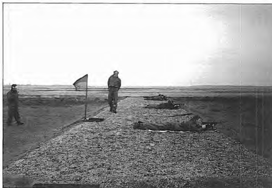
Skydning med MP M/49