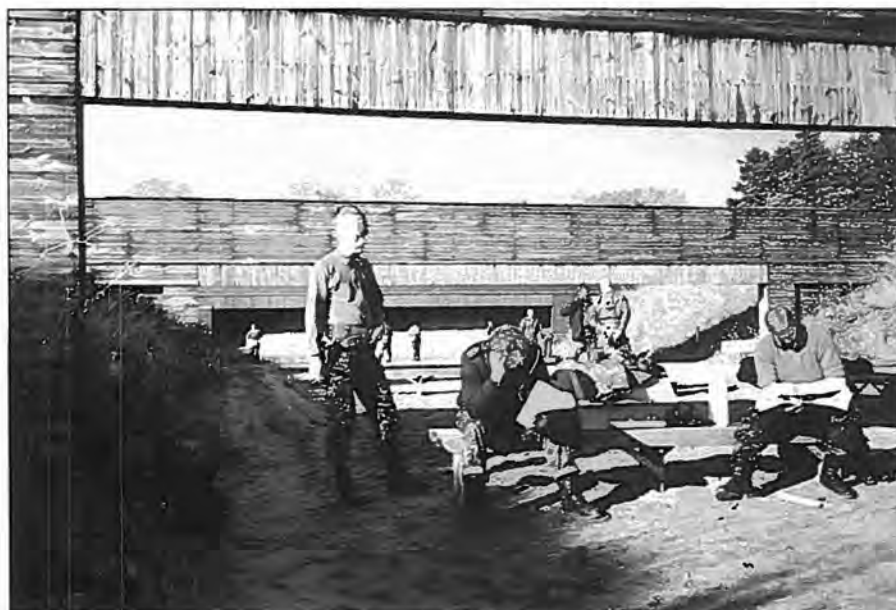
Grønholdt skydebane i Frederikshavn om fredagen, Skydning med pistol M/49

Fremme i lejren kørte vi straks til skydebanen og skød med maskinpistol helt til kl. 18. Så fik vi anvist vore kvarterer – et 12 mands lukaf. Det betød, at jeg for første gang siden værnepligtstiden skulle bo under forhold, der nødvendiggjorde gennemført samarbejde i alle døgnets timer med kollegerne.