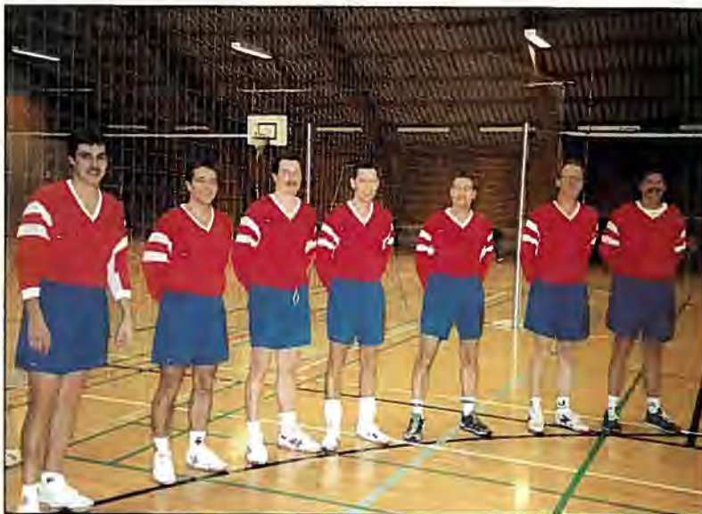
De barske old boys fra SOK

Efter mange spændende og til tider velspillede kampe, lykkedes det en gang til for Old Boys-holdet fra Søværnets operative Kommando at genvinde titlen fra sidste år. Det skal dog siges, at holdet flere gange var i krise, men de tapre »gamle« vendte altid slaget til deres fordel, og holdet blev en suveræn og fortjent vinder.