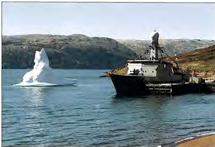
Isbjerg ved verdens største ø, THETIS flager over toppene

I denne stol sidder en kaptajn fra flyvevåbnet. Hans job er at koordinere Luftgruppe Vest flyvninger med GOLFSTREAM med kommandoens