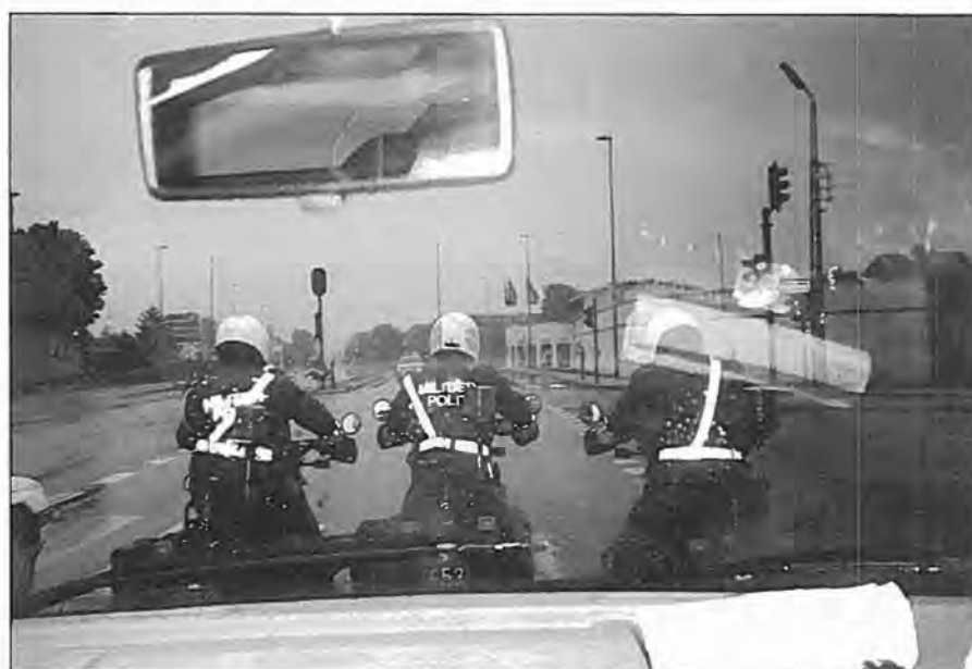
MC-eskorte til Borris

Medens den ene tog sig af den tilskadekomne person og ydede førstehjælp og fik tilkaldt assistance og ambulance, blev den aggressive per-