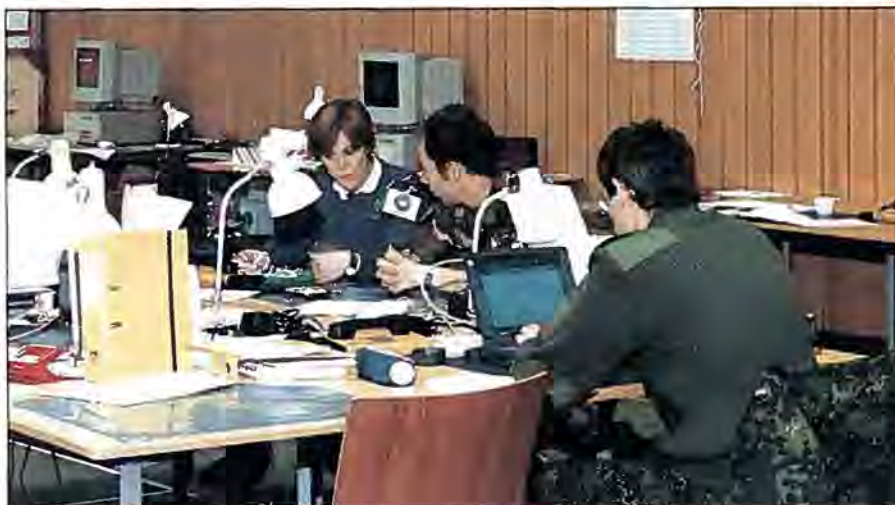
Et lille udsnit af det store pressecenter, hvor 10 nationer arbejdede effektivt sammen i knapt 3 uger

svaret skulle have betalt for 45 minutters reklamesendetid i de æterbårne medier.