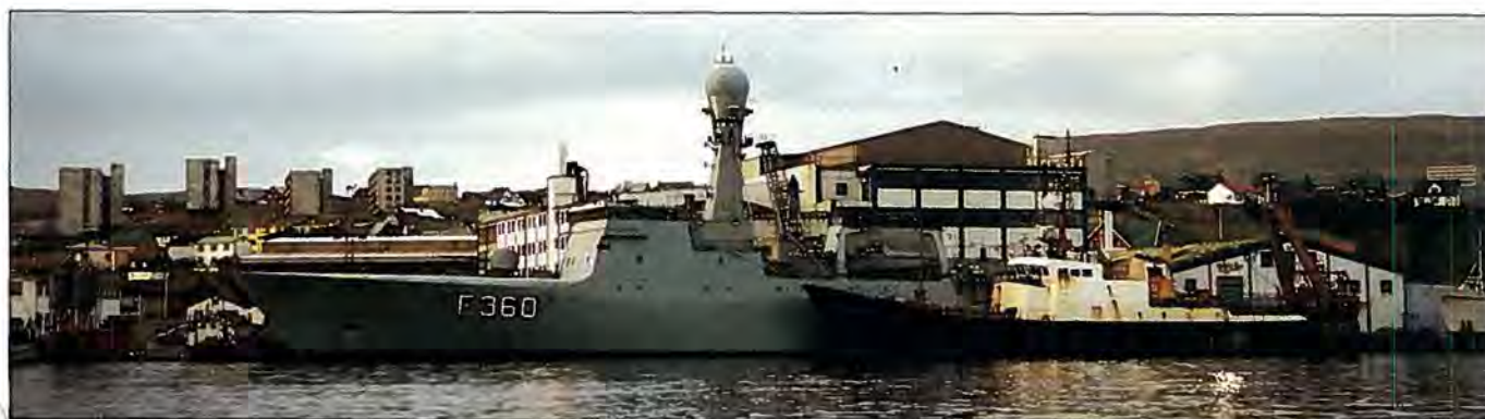
HVIDBJØRNEN med synderen på siden