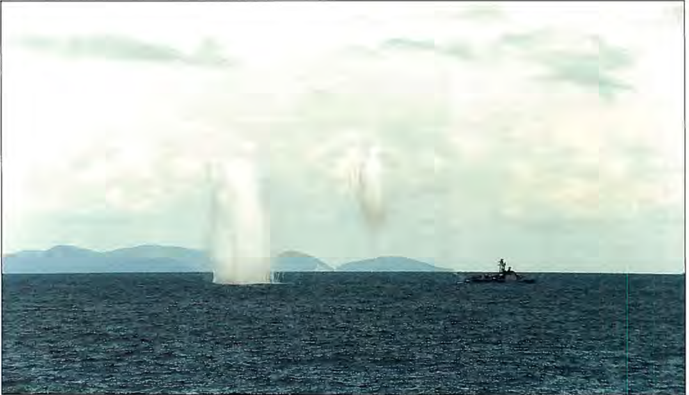
De imponerende danske »lokkeskyer« under tropisk himmel

Den kongelige Malaysiske Flåde stillede en missilbåd og en korvet til rådighed for Naval Team Denmark for demonstration af SEA GNAT systemet.