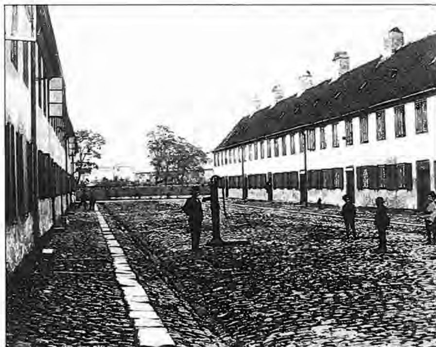
Svanevej 1901 med den fælles vandpost på gaden

København var dengang omgivet af små volde, der lå hvor Vester Voldgade, Nørre Voldgade og Gothers-