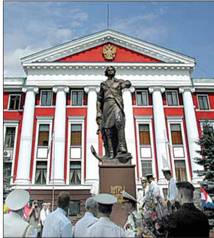
Statuen af Peter den Store, netop afsløret

Admiralen var om bord i THETIS vært ved en reception, der var mere end velbesøgt. Over 230 mennesker mødte frem og nød til fulde den i særklasse bedste reception, man kunne forestille sig. Ud over den