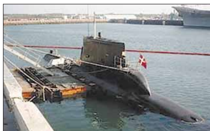
SÆLEN på flådebasen ROTA (Spanien)

Dette skyldes flere faktorer: For det første sejler en ubåd med de samme rutiner uanset om der står krig eller øvelse på