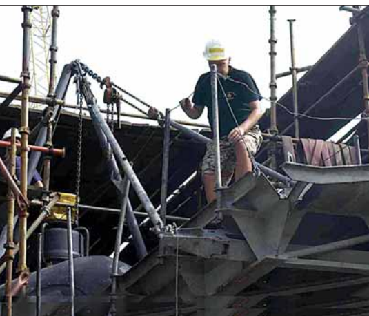
SÆLEN i dok, Bahrain

På trods af at det var værftets første inddokning af en ubåd og at der kun var en 150m lang dok til rådighed forløb det hele ganske smertefrit. Værftet arbejdede utroligt seriøst, hvilket understreges af, at de havde en dykker nede og kigge på, om vi