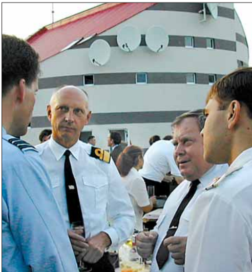
Chef SOK til reception i samtale med forfatteren og Chefen for den russiske Østersøflåde

THETIS ankom til Baltijsk fredag d. 25. juli, hvor værtsskibet PYLKY ventede på reden for at ledsage THETIS i havn. Efter