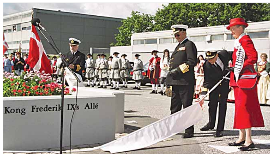
HM Dronningen afslører de nye vejnavne på flådestationen

I alt en spændende dag for alle på Flådestation Frederikshavn. De mange oplevel-