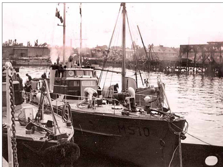
De to reddede ministrygere, MS 3 og MS 5

De danske skibe blev sejlet hjem til København. Eneste undtagelse var de fire torpedobåde af DRAGEN- og GLENTEN-klassen, der efter tysk pres var blevet udleveret til den tyske flåde i februar 1941. 1 Fire af bådene blev genfundet i Flensborg. Torpedobådene var dog desværre