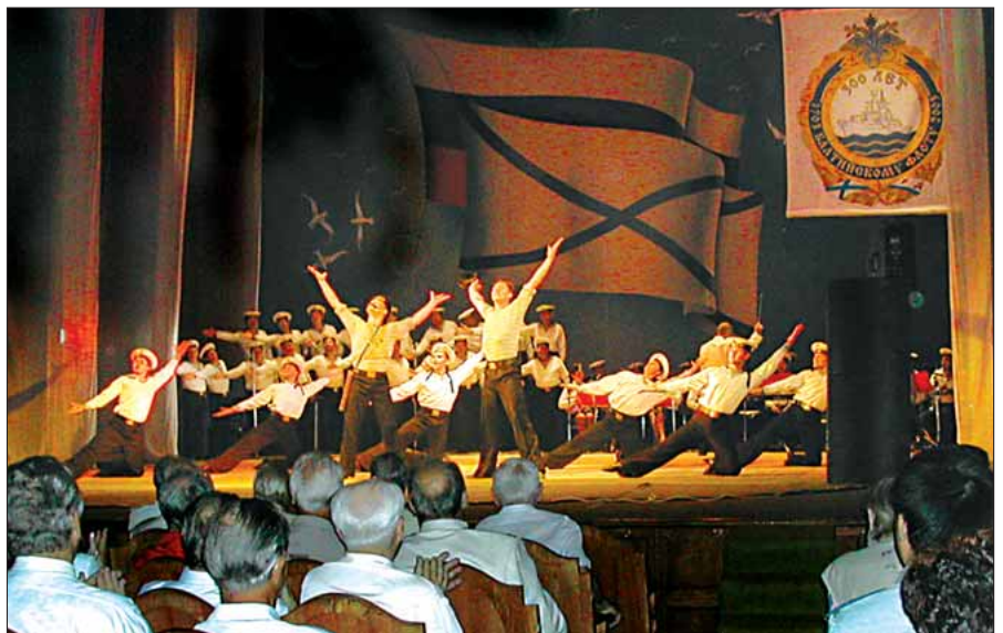
Optræden af den russiske flådes mandskor, der gæstede Århus for to år siden