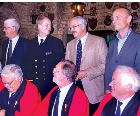
Nye medlemmer til optagelse

I forbindelse med Rebild-festen sørger Christian d. IV's Laug, blandt mange andre ting, for, at prominente gæster, som deltager i arrangementet under festlighederne, kan opleve lidt særegen dansk humoristisk kultur – uden bandeord.