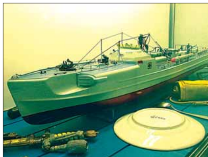
Model af Tysk S-båd

Alt fra fregatten JYLLAND, slagskibene HOOD og BISMARCK frem til Mols Liniens hurtigfærger ses som store modeller på museet. Koffardiskibe fra handelsflåder i ind- og udland er også rigt repræsenteret. Der er en model af TITANIC – hvor man kan se et af ankrene, som vejede 15 tons og som skulle fragtes af 20 he-