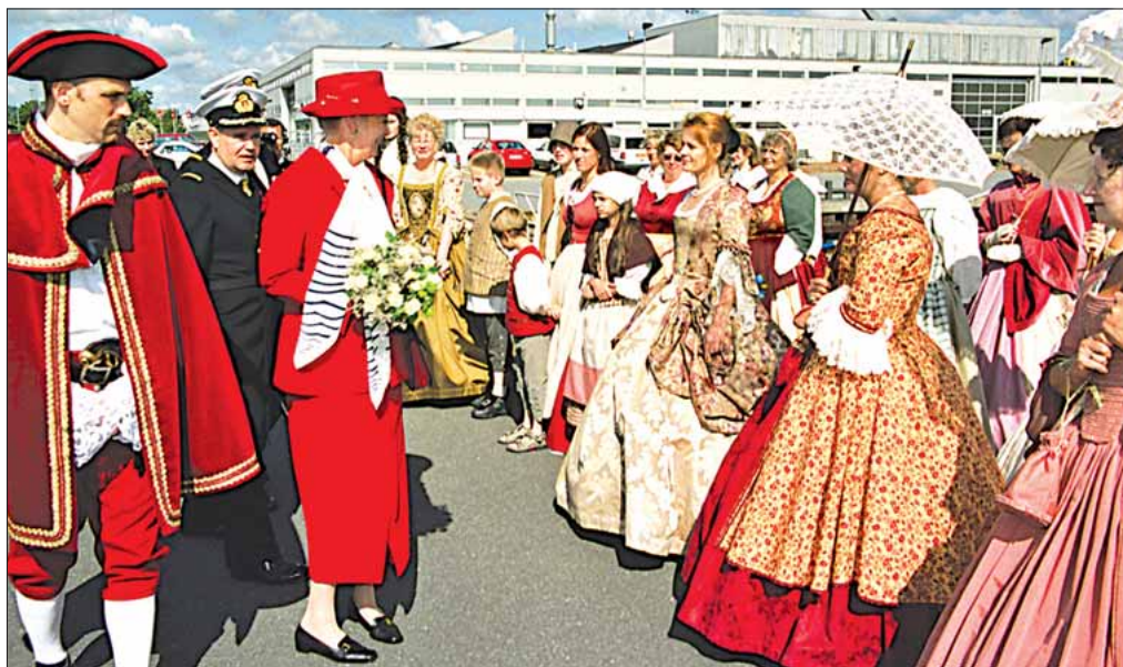
HM Dronningen hilser af hine tiders damer

Det knapt så moderne Bangsbo Fort fik også fint besøg og to af de frivillige rundvisere fortalte om stedets historie i perioden 1940 - 1945 dengang da den tyske besættelsesmagt benyttede området. Som et meget højtlydende indslag i besøget åbnede Niels Juels kanoner ild for første gang siden 1962 – med brag, som var en Dronning værdig. Kanonerne stammer