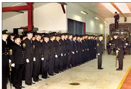
Mønstring i Torpedobådsafdelingen på Holmen

Fra disse køretøjer klarede man bespising og indkvartering af bådenes besætninger, samt at levere olie og vand og en del andre ting.