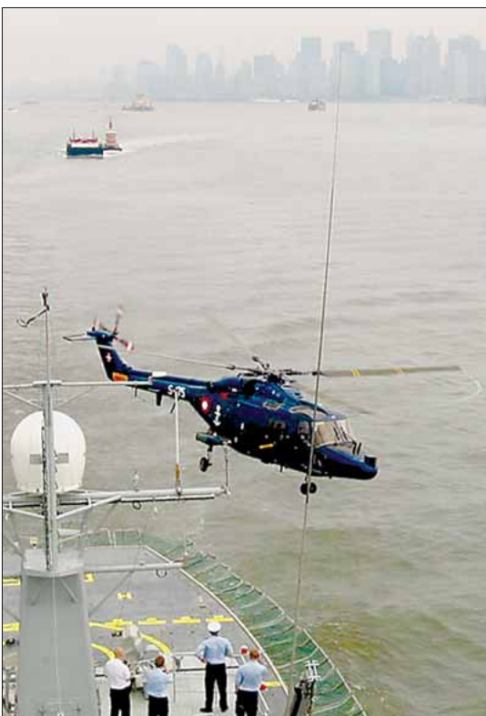
Lynx med »Ground Zero« i baggrunden

andet lige måtte betegnes som prototyper og forsøgsudgaver. Flyene var endda bygget af skibstømrere!