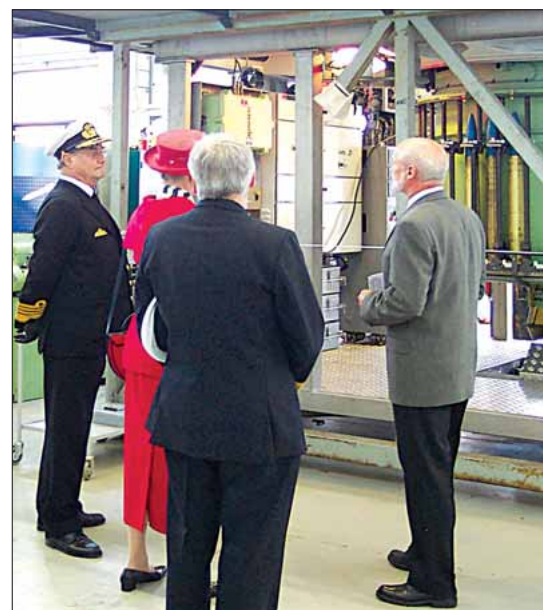
Regentparret besigtiger OTOMELARE værkstedet på FLS FRH

Tordenskiolds soldater, Fladstrand anno 1717 var opstillet som æresgarde med civile klædt i dragter fra 1700 tallet. Det var et meget flot islæt.