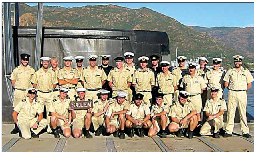
SÆLENS 3. besætning

Om morgenen 11. juni forlod besætningen for sidste gang SÆLEN i Bahrain. Folkene ombord på heavy-lifteren gik i gang med at placere vuggerne, som båden skulle løftes i, på korrekt vis. Det var særdeles vigtigt, at vuggerne blev placeret nøjagtigt, så de to kraner delte vægten af båden ligeligt mellem sig. Hvor vigtig placeringen af de to vugger var, blev understreget af, at det var lastechefen selv hjemme fra handelsfirmaets hovedkontor, der lå i vandet iført dykkerudstyr og ledede placeringen af vuggerne under undervandsbåden.