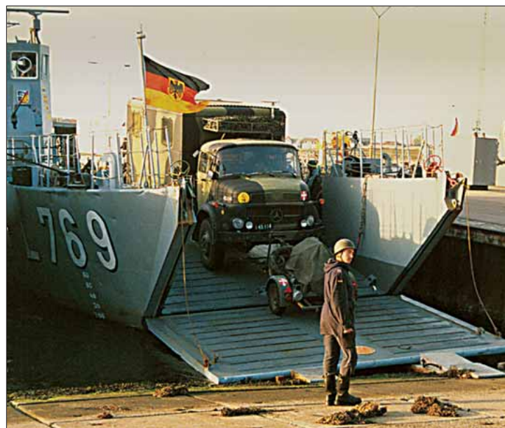
llandkørsel fra tysk landgangsfartøj

Den største opgave, som MOBA nogensinde er blevet tildelt, er muligvis at agere som Task Group kommandoplatform for