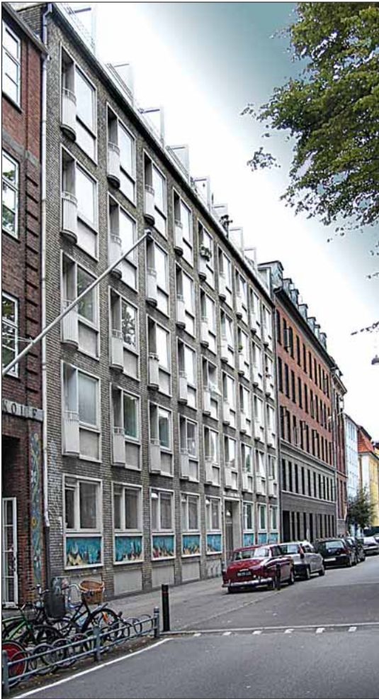
Bombøbøssen som »den« ser ud i dag