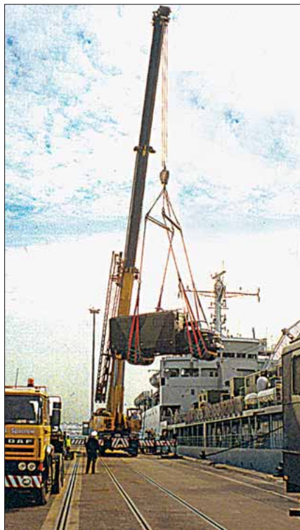
Høj Kran – MOBA på udflugt

med havde MOBA fået »nogle store muskler« med rådighed over 2 gange 8 HARPOON-missiler. Og Søværnet havde fået endnu et solidt stykke værktøj til værktøjskassen, idet man nu var i stand til – i et kystnært scenario – at engagere en fjende med et kraftigt sømålsmissil. Vel og mærke fra en mobil platform i land. MOBA missilbatterier har under adskillige taktiske øvelser været udslagsgivende, da man kunne engagere sømål fra et skjult sted i land. Og såfremt man kunne få passende målopdateringer fra for eksempel