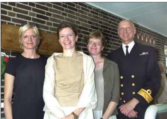
Chefen for Søværnets Operative Kommando med de tre døtre Garde

Det er en stor glæde at se, at så mange har efterkommet invitationen og er mødt op her i dag. Også tak for mange venlige tilkendegivelser med forslag til yderligere gæster – vi har efterfølgende udvidet gæstelisten, men beder i forvejen om tilgivel-