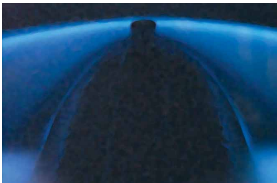
Morild i Det Indiske Ocean

blev derfor brugt til at rydde op, gøre rent og klargøre båden til en ny patrulje.