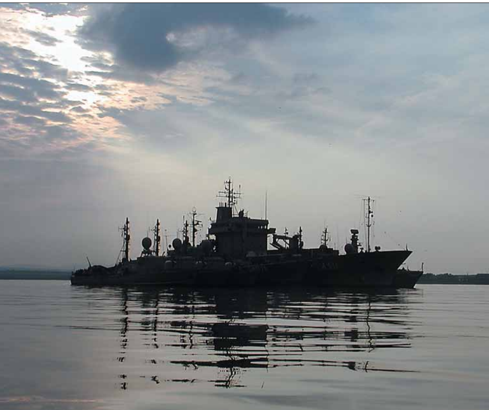
Eksempel på flådestyrke til hurtig indsats – for fjernkendere!

I de kommende numre af Søværnsorientering vil vi fokusere på forsvarsledelsens militærfaglige oplæg og blandt andet se på, hvad der efter planen skal ske i de enkelte værn, hvordan fremtidens værnepligt skal skrues sammen, hvad der ligger i tankerne om totalforsvaret og så videre.