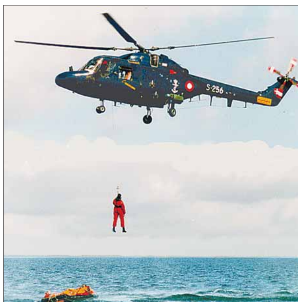
Navy Lynx udfører hoist fra gummibåd

Foreningen vil arbejde for at skabe bånd mellem fortiden og nutiden i og uden for tjenesten, hvilket bl.a. skal gøres gennem afholdelse af selskabelige og faglige arrangementer. Foreningens medlemmer skal således være personel fra Marinens Flyvevæsen, tjenstgørende i den tidligere »Alouette Flight« i Eskadrille 722 samt