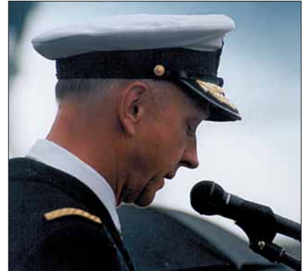
Chefen for SOK taler ved paraden