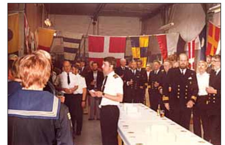
Reception i Torpedobådsafdelingen

I 1992 blev MOBA opdelt i to selvstændige afdelinger. MOBA, som stadigvæk stod for den operative støtte og MOVA (Den