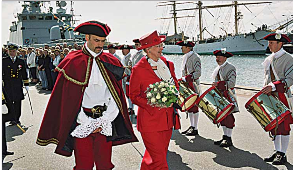
HM Dronningen modtages på kajen med »originalmusik«