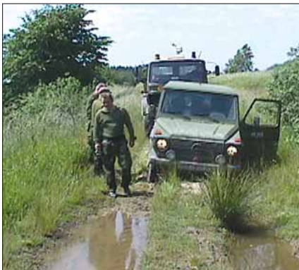
Rekognosceringen kørt fast?

Nu er det jo ikke sikkert, at Kim Larsen vor »nationalskjald« lige netop tænkte på MOBA, da han skrev en af sine mere populære sange. Men sandt er det, at der bliver lidt mere stille, når en af Søværnets ældste operative enheder – Den Mobile Base (MOBA) – med udgangen af indeværende år ophører med at eksistere. Dette sker som en konsekvens af det sid-