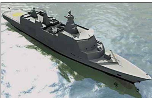
Flådens nye, store flexible støtteskib, der er under bygning på Linø Værft

Forsvarets ledelse præsenterede den 2. september sit oplæg til en ændring af det danske forsvar. Og forsvarsledelsen lægger ikke skjul på, at det militærfaglige oplæg peger på endnu større ændringer af Forsvaret end dem, Forsvaret allerede har været igennem siden afslutningen på den kolde krig. Med udspillet ønsker forsvarsledelsen at komme nye gradvise tilpasninger i forkøbet. Der sker ved at fremlægge en vision, som gør Forsvaret til et relevant og fleksibelt instrument i den sikkerhedspolitiske værktøjskasse, sådan som regeringen og forligspartierne ønsker det.