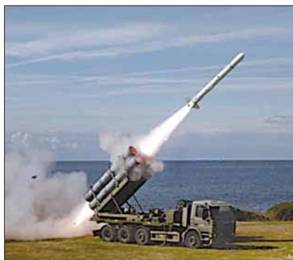
HARPOON missil skud for prøve (BTV)

Alt dette har typisk fundet sted i dansk område, men der har da været afstikkere til udlandet, f.eks. da MOBA sammen med 4 torpedobåde deltog i »Grüne Wo-