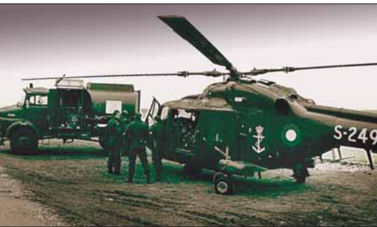
Planlægningsmøde med Lynx

I dagligdagen var en anden hyppig plads Torpedostation (og depot) Kongsøre, hvor der blev lastet torpedoer under de torpedoskydeøvelser, som blev gennemført i området omkring Hesselø.