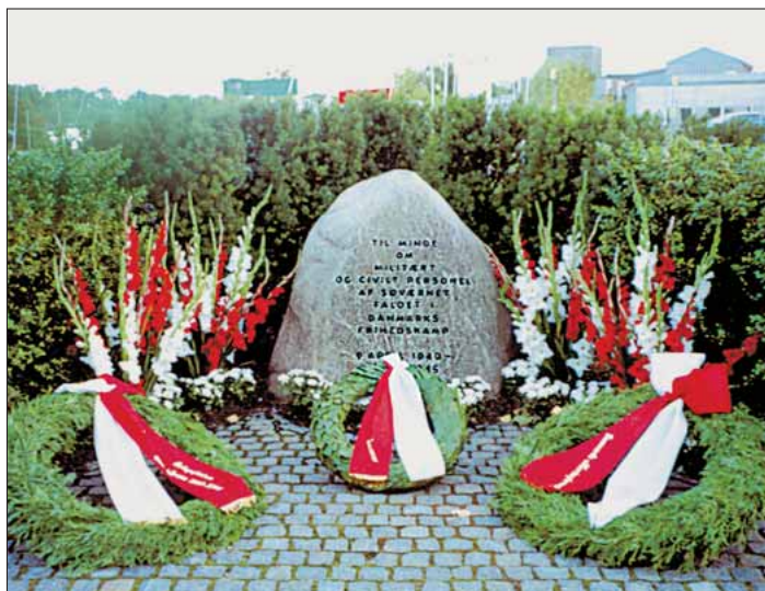
Mindestenen for Flådens faldne 1940-45 på Nyholm. Kranse fra Marineforeningen, Søværnet og Orlogsflåden i Karlskrona 1943-45

»Der er således meget at fejre i dag, hvor I jubilare mødte til tjeneste i Flåden. I år kan vi glæde os over at have fire 70-års jubilare, tre 65-års jubilare, 26 60-års jubilare og ikke mindre end 55 50-års jubilare, 31 40-års jubilare samt tre 25-års jubilare«.