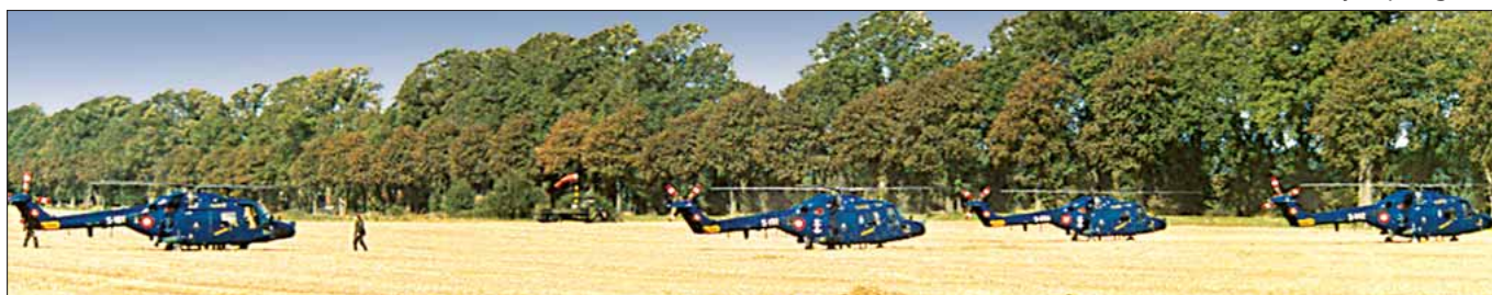
Lynx på »græs«

Vi havde i den forbindelse være ude at låne materiel og personel flere steder for at kunne opstille en CTG-plattform med de nødvendige faciliteter, først ved Gjerrild Nordstrand og siden hen på Sjællands Odde. Det var en stor udfordring, men det lykkedes – selvom der ind imellem var visse sprogvanskeligheder, da staben blandt andet bestod af personel fra Danmark, Canada, Norge, Tyskland, Holland, Belgien og Grækenland.