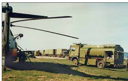
Helikopter tanker op i MOBA regi

Og under BOLD GAME-øvelserne i 1974 og 75 opererede MOBA i området mellem Kristianssand og Bergen.