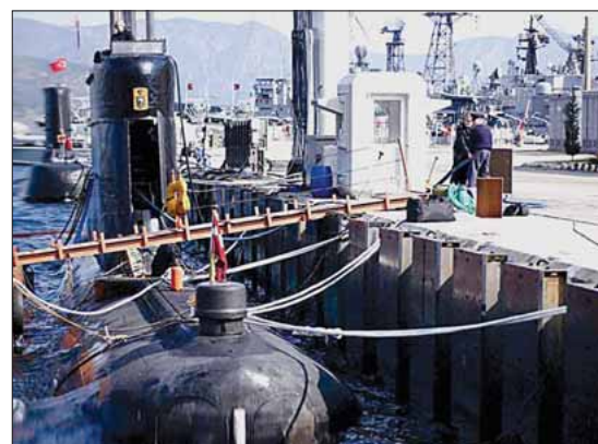
SÆLEN i Tyrkiet

Det reducerede trusselsniveau betød at vi under bestemte forudsætninger kunne bevæge os udenfor basen og hotellet igen. Det benyttede stort set alle til i større eller mindre grad at gå på opdagelse rundt omkring i Bahrain. Der var dog mange ting man skulle være opmærksom på. Ikke alene skulle man tage sine forholdsregler overfor den mulige trussel fra ikke venligtsindede lokale, men man skulle også forsøge at begå sig i et arabisk land, hvilket for de fleste var første gang. Som