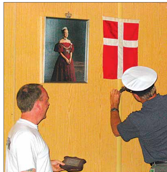
Skjoldet sættes op på skottet

Da vi for eksempel lørdag den 7. juni mødte Norge i EM-kvalifikationskampen i fodbold, havde vi inviteret alle danskere