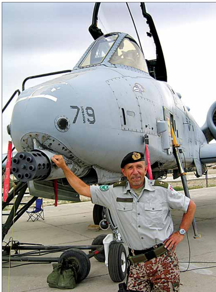
Orlogspræsten med fly

Det kan godt være, at det afghanske folk stadig lider nød, fattigdom og sult. Men alene den omstændighed at utrygheden og frygten for vilkårlige voldshandlinger, overgreb og fængslinger med umenneskelig tortur fra undertrykkernes side er historie, gør, at man, på trods af fattigdom og nød, kan være glade! Også her i Afghanistan anser nemlig mange Saddams fald som en stor lykke for alle muslimer.