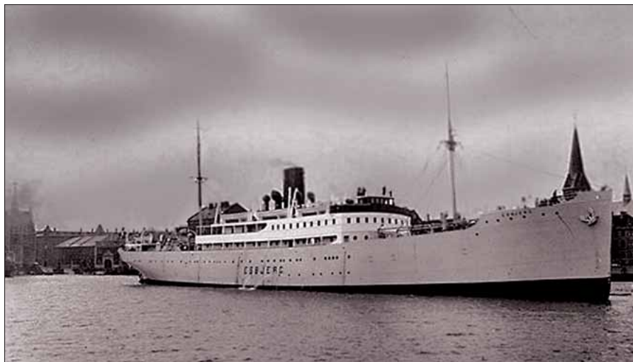
DFDS Esbjerg fotograferet før krigens udbrud.

Skibene forlod sammen med MS 3 Lübeck den 23. juli, men allerede næste aften fik MS 3 motorstop og måtte tages på slæb af Esbjerg. Skibene fortsatte dog mod København, kl. 2230 løb Esbjerg på en mine lidt syd for Stevns. Ved ekspllosionen blev slæbetrossen mellem MS 3 og Esbjerg revet over, og MS 3 begyndte straks at drive væk. Da al strømmen var forsvundet ombord på Esbjerg, søgte besætningen på MS 3 at signalere til Parkeston at Esbjerg var ved at synke. Des-