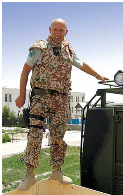
Orlogspræsten på toppen af en lastvogn

Så da vi her i den danske lejr i Kabul måtte gå i beskyttelsesrum for små tre måneder siden, og mange gange efter, fordi visse yderligtgående grupper i Afghanistan ikke ønsker vor tilstedeværelse her og derfor beskyder os med raketter, tænkte jeg på min barndoms besøg i de gamle beskyttelsesrum. Hvad jeg dengang, i drengeårene, anså for ren historie, blev pludselig meget aktuelt for mig. Det satte naturligvis en masse tanker i sving om krig og fred. Tanker om, at det bare er for nemt at række armene i vejret og sige: »Fred, fred!«