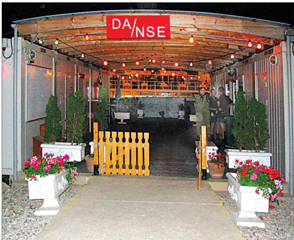
Overdækkede containere – NSE

Flaget, et orlogssøndagsflag som har sejlet på Grønland, havde vi hængt op under