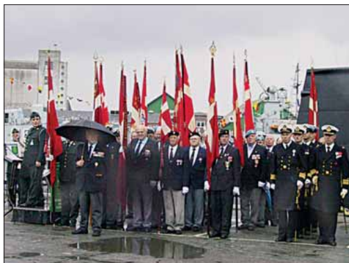
Faneborgen fra Samvirkende Soldaterforeninger i Århus

en besættelse af Holmen ikke måtte imødegås med magt, men for at Flåden ikke skulle falde i tyskernes hænder, havde Søværnskommandoen givet ordre til, at ski-