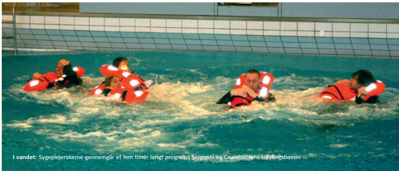
I vandet: Sygeplejerskerne gennemgår et fem timer langt program i Sergent- og Grundskolens træningsbassin

“Det er en anderledes måde at skulle arbejde på, når man udstationeres med et skib. Der er anderledes traditioner, arbejdsmåder og opgaver. Så der bliver meget at skulle lære, men jeg glæder mig også til at bidrage med noget fra den verden, jeg kommer fra i dagligdagen på hospitalet. Jeg ser frem til en god oplevelse og et godt samarbejde med alle, som på mine tidligere missioner med Forsvaret.”