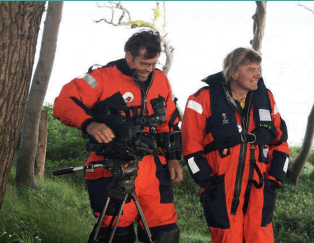
Gennem bøgeskoven: SVANEN og THYRAS sejlsads filmes gennem bøgeskoven på Æbelø

land, Flåden passer på,” fortæller Troels Kløvedal.