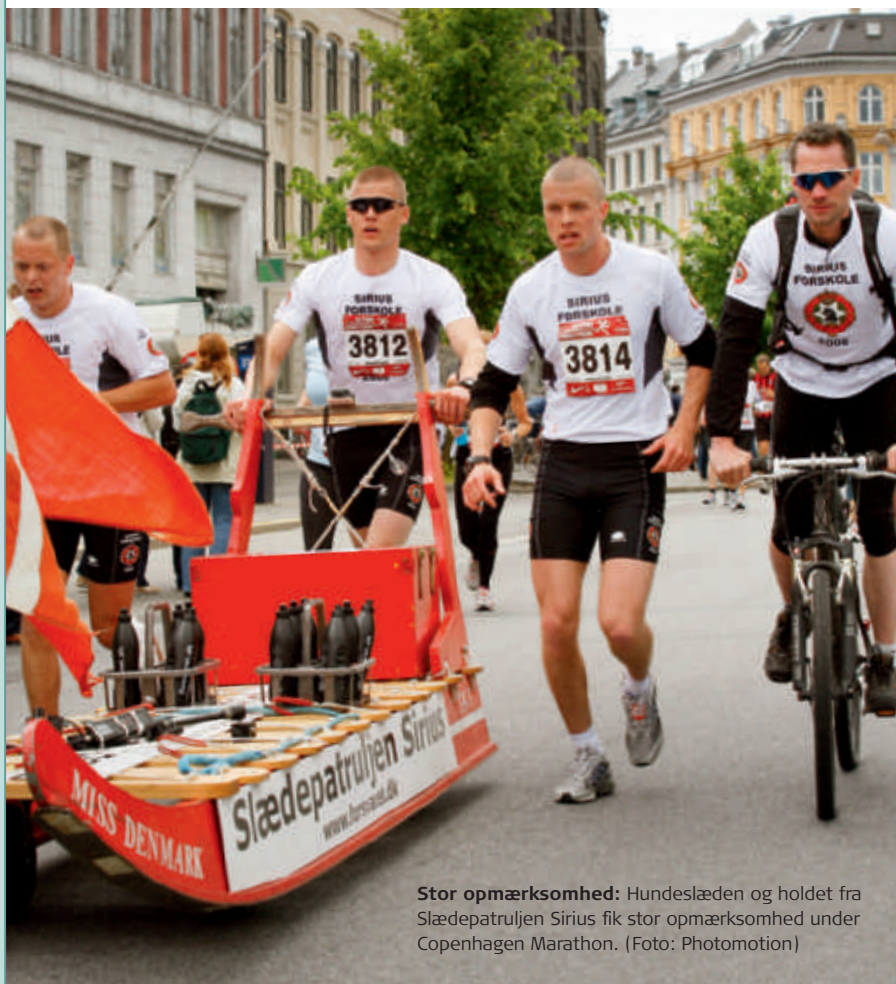
Stor opmærksomhed: Hundeslæden og holdet fra Slædepatruljen Sirius fik stor opmærksomhed under Copenhagen Marathon.

"Copenhagen Marathon var en god fælles oplevelse for holdet, og løbet gik rigtigt godt. Vi slog sidste års hold med 12 minutter. Desuden fik vi en masse opmærksomhed. På den måde var det fin reklame for Slædepatruljen Sirius, at vi deltog".