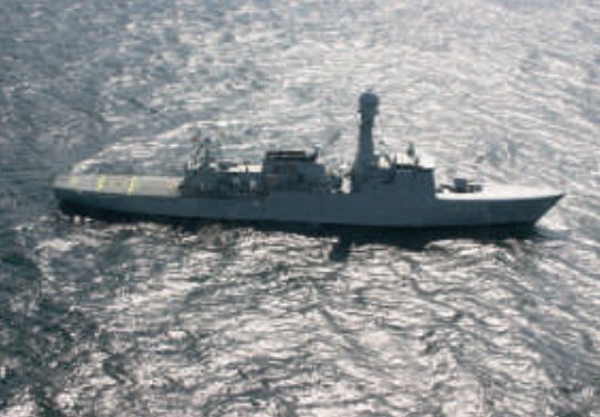
Kommandoskib: THETIS bliver kommandoskib for SNMCMG1 i 2009