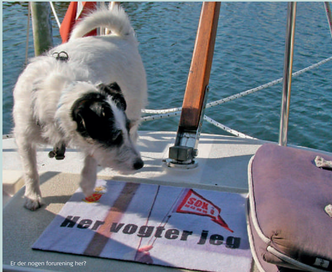
Er der nogen forening her?

Ebeltoft Marineforenings sangkor SLUP-KORET har indspillet en CD med titlen "Bølgeskulp". CD'en indeholder 15 sange og kan bestilles hos: Ebeltoft Marineforening Stockflethsvej 7 8400 Ebeltoft tlf. 8634 30 30 e-mail: marineforeningen-ebeltoft@mail.dk