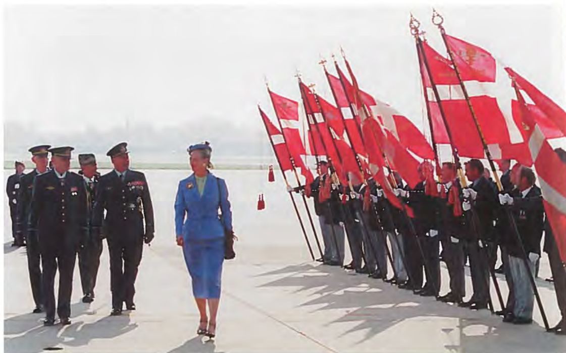
Hendes Majestæt Dronning Margrethe II inspicerer de opstillede repræsentanter for flyvevåbnets soldaterforeninger under besøget på Flyvestation Værløse.

Flyvevåbnets 50-års fødselsdag fejres på alle landets flyvestationer. Hendes Majestæt Dronning Margrethe besøger Flyvestation Værløse sammen med bl.a. Hans Kongelige Højhed Kronprins Frederik og Hans Kongelige Højhed Prins Henrik.