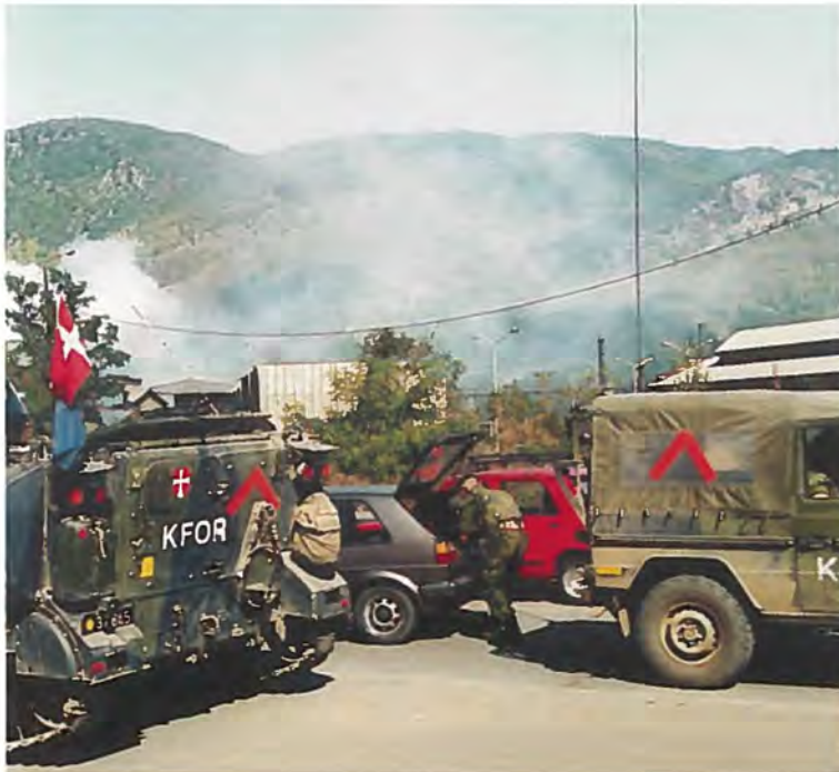
Dansk kontrolpost ved blysmelteværket i Zvecan.

Danske soldater deltager i lukningen af det forurenende blysmelteværk i Zvecan ved Mitrovica i Kosovo.