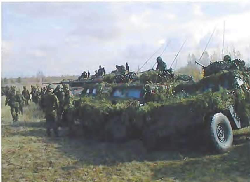
Danske soldater under øvelse BALTIC EAGLE får besøg af chefen for Hærens Operative Kommando.

Forsvarsminister Hans Hækkerup deltager i uformelt NATO-forsvarsministermøde i Birmingham i Storbritannien. Forsvarsministrene drøfter bl.a. situationen på Balkan og muligheden for at rationalisere styrkestrukturen uden at svække den militære tilstedeværelse i Kosovo og Bosnien, Forsvarskapacitetsinitiativet, herunder muligheden for at styrke og tilpasse NATO's forsvarsplanlægning samt den europæiske sikkerheds- og forsvarsidentitet. Forsvarsministrene mødes tillige med den russiske forsvarsminister Igor Sergejev.