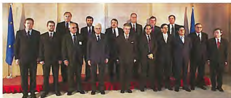
Forsvarsminister Hans Hækkerup deltog i kapacitetskonferencen i Bruxelles 20. november 2000.

EU's mål er fortsat det såkaldte Headline Goal, som man blev enige om på mødet i Det Europæiske Råd i Helsingfors i december 1999. Her enedes man om opstillingen af et Headline Goal – dvs. en mål-sætning om, at EU i år 2003 skal være i stand til med 60 dages varsel at udsende en styrke på 50-60.000 mand og opretholde denne styrke mindst et år. Det blev endvidere slået fast, at der ikke er tale om en Europahær forstået som en overnational myndighed eller stående styrke. Der er derimod tale om en udrykningsstyrke til militær krisehåndtering – ikke kollektivt forsvar. Dette ligger fortsat alene