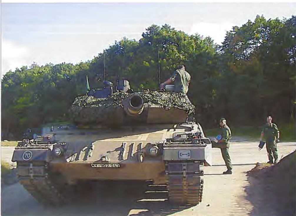
Tysk LEOPARD 2A5 testes af Hærens Kampskole i Oksbøl