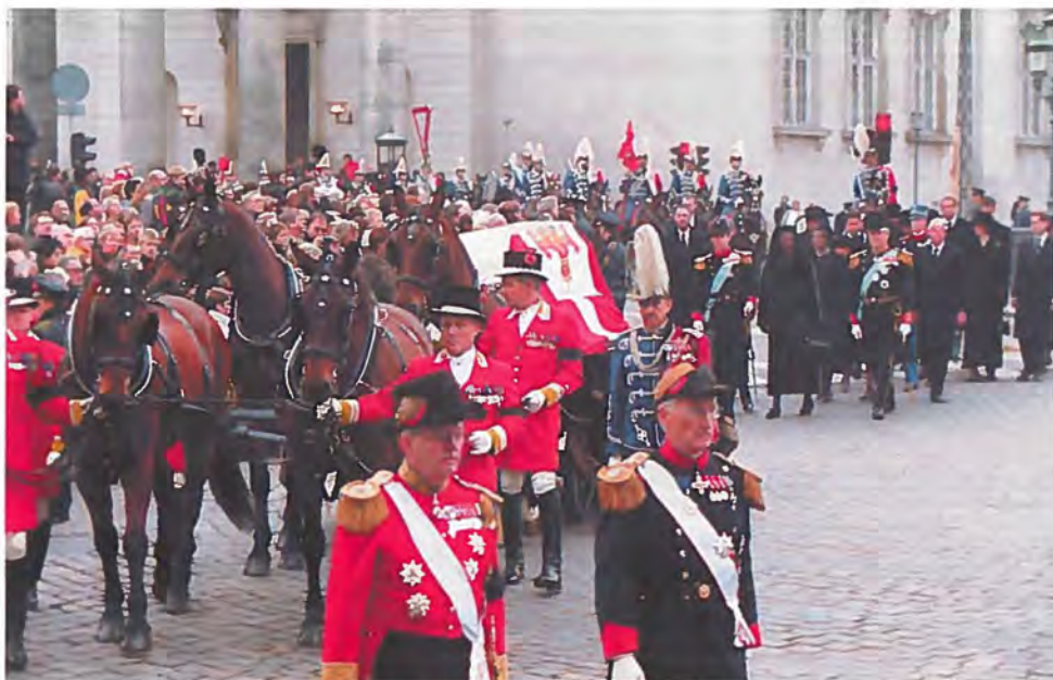
Hendes Majestæt Dronning Ingrid's kiste føres fra Christiansborg Slotskirke med bereden eskorte fra Gardehusarregimentet.

Forsvaret støtter arrangementet ved Hendes Majestæt Dronning Ingrid's begravelse.