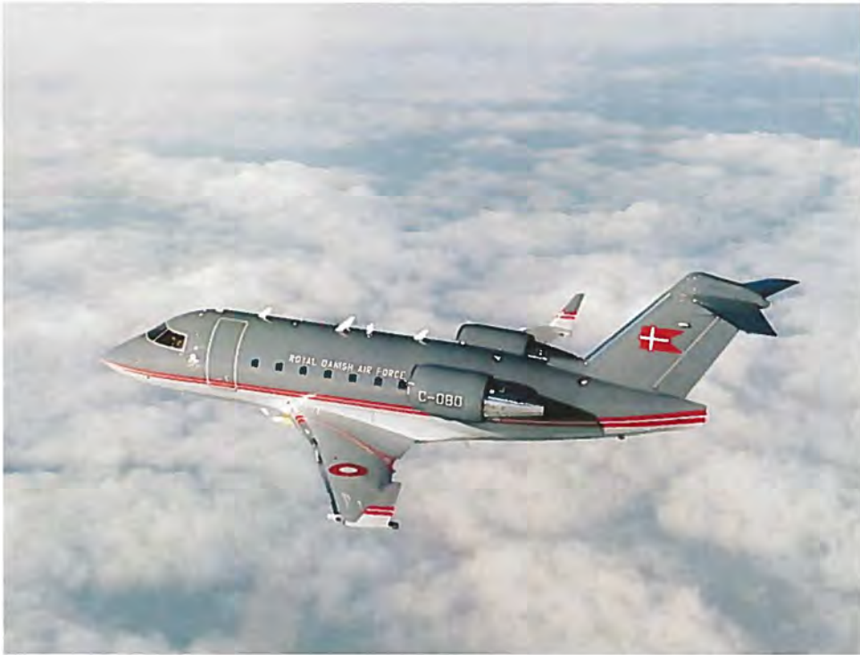
Flyvevåbnet indkøber to Challenger til erstatning for Gulfstream III.

Finansudvalget tiltræder erstatningsanskaffelse for forsvarrets to resterende Gulfstream III inspektionsfly til et samlet beløb på ca. 497 millioner kroner.