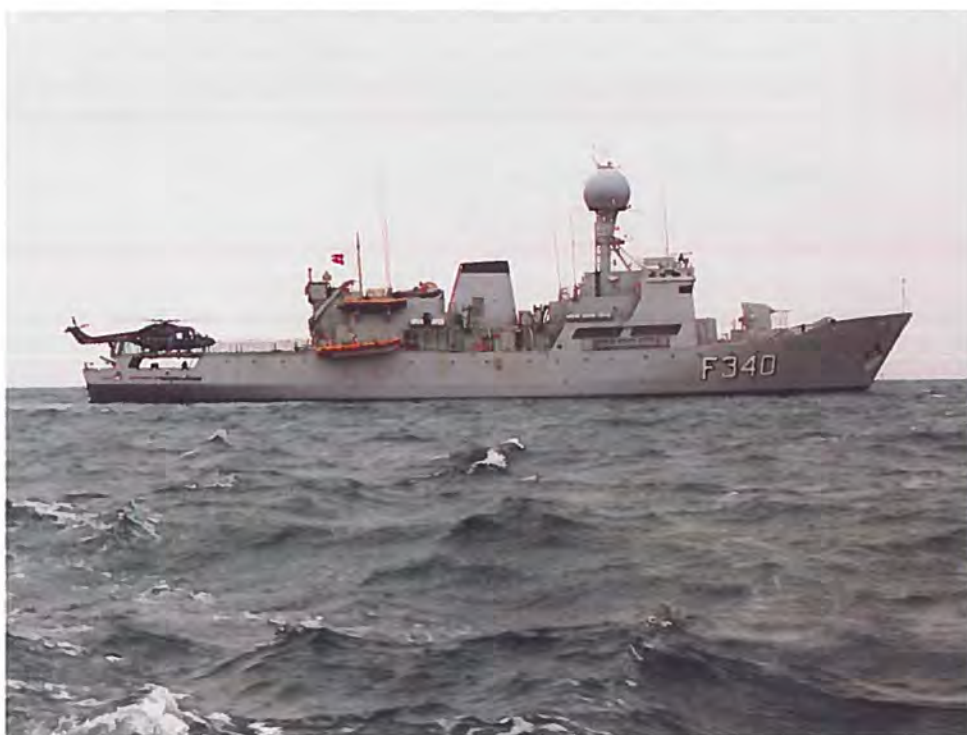
Inspektionsskibet BESKYTTEREN blev i 2000 doneret til Estland.

Finansudvalget tiltræder gennemførelse af vederlagsfri donation af inspektionsskibet BESKYTTEREN til Estland til et samlet beløb på ca. 30 millioner kroner. Donationen omfatter overdragelse af BESKYTTEREN samt tilhørende kommunikations- og navigationsudstyr, inventar, brand- og redningsmateriel mv. Endvidere omfatter projektet uddannelse af estisk personel i betjening og vedligeholdelse af skibet under dansk rådgivning i op til ca. 1 år efter overdragelsen.