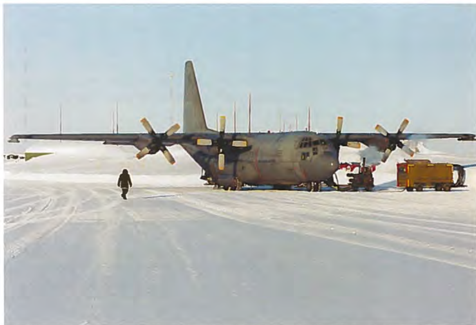
Flyvevåbnets C-130H Hercules på Grønland under øvelsen PITUGFIK 2000.

Finansudvalget tiltræder anskaffelse af nye transportfly af typen C-130-J-30 som erstatning for de eksisterende tre transportfly af typen C-130H Hercules til et samlet beløb på ca. 2.184 millioner kroner.