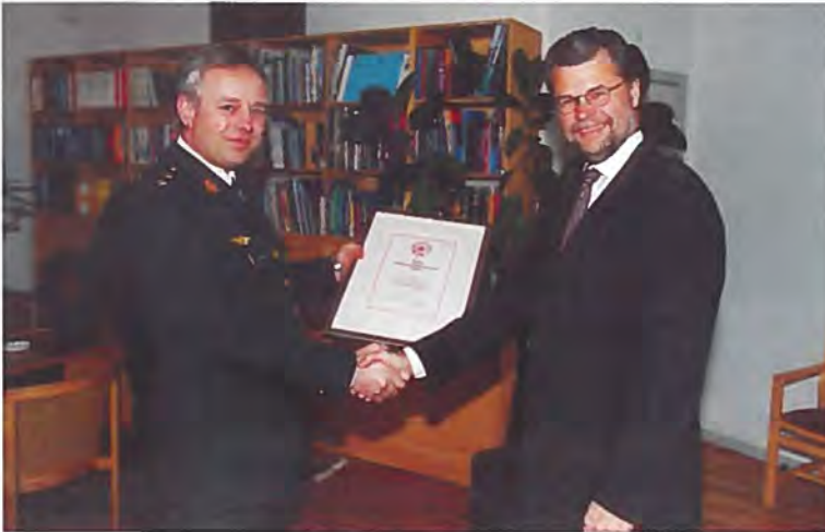
Forsvarsminister Hans Hækkerup overrækker miljøprisen til Hærens Sergentskole.

Hærens Sergentskole i Sønderborg modtager Forsvarsministeriets Miljøpris 1999.