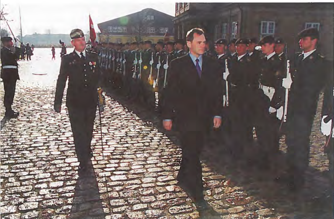
Forsvarsminister Jan Trøjborg inspicerer æreskommando i anledning af den canadiske forsvarsminister, Arthur Eggleton's, besøg den 8. Februar 2001