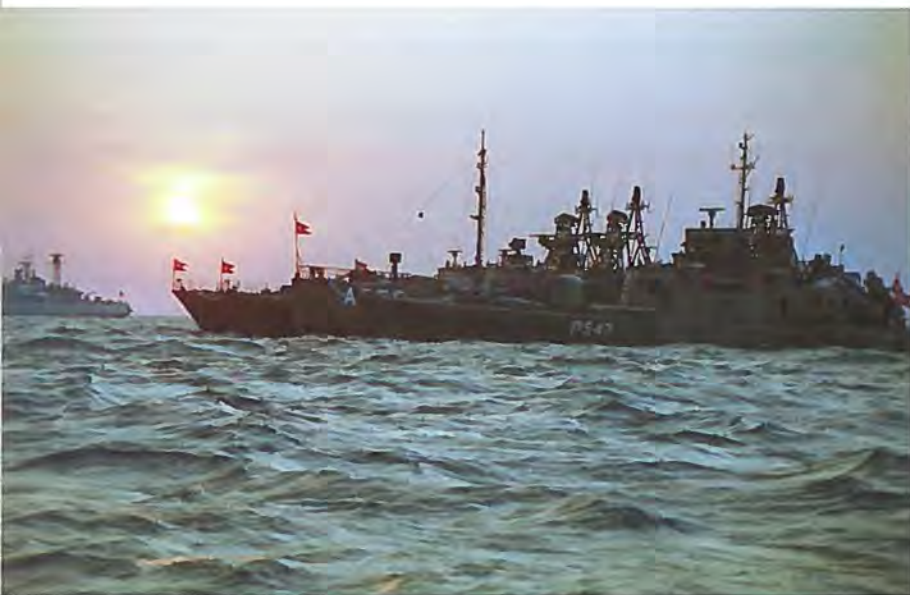
Missiltorpedobåde af WILLEMOES-klassen, forrest SEHESTED, under bunkring til søs ved et tankfartøj af FAXE-klassen. Begge klasser er udfaset.

Skive, ligesom Gardehusarregimentet, Danske Livregiment og Sjællandske Livregiment ved årsskiftet 2000/2001 blev sammenlagt under navnet Gardehusarregimentet og flytter til Slagelse. Nørrejske Artilleriregiment og Sønderjyske Artilleriregiment blev 1. november 2000 sammenlagt som Dronningens Artilleriregiment og flytter til Varde. Sammenlægning af hærens militærregioner med hjemmeværnets regioner blev påbegyndt den 1. juli 2000 med oprettelsen af Lokalforsvarsregion Bornholms Værn, hvori indgår den tidligere Militærregion VII og Bornholms Hjemmeværn.