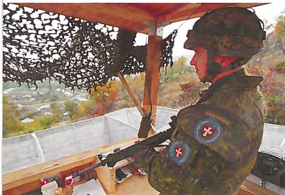
Dansk soldat på post i det tidligere Jugoslavien.