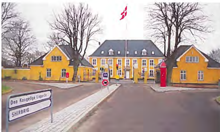
SHIRBRIG Planning Element og det danske hovedkvarter-kompagni ligger på Høvelte Kaserne i Nordsjælland.

Lokalforsvarsregion Bornholms Værn oprettes. I regionen indgår Militærregion VII og Hjemmeværnet på Bornholm. Regionen består bl.a. af 3. opklaringsbataljon, der opstilles af Gardehusarregimentet, og som skal uddanne lette opklaringsenheder til de umiddelbare reaktionsstyrker og SHIRBRIG.