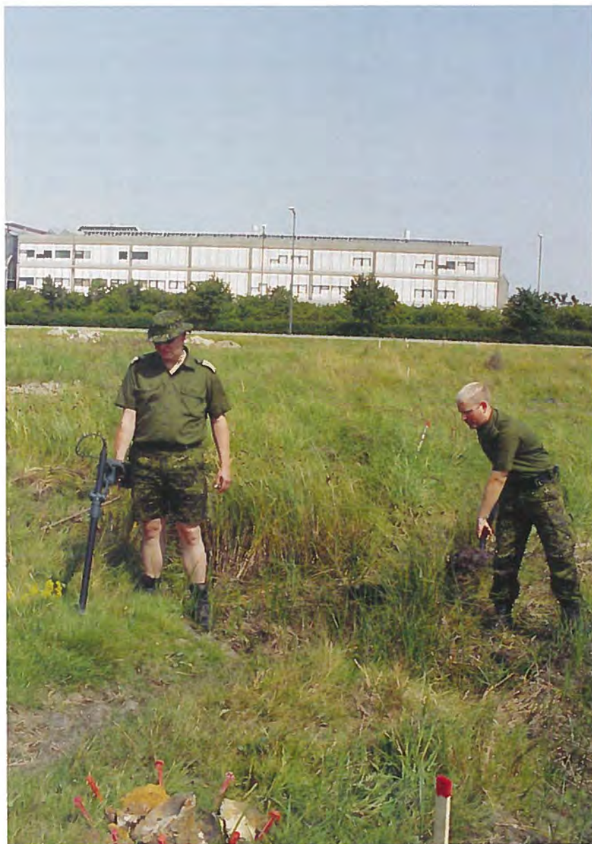
Ammunitionsryddere på arbejde på Amager

nyt og bedre søge- og rydningsmateriel. Ved udgangen af 1999 var der ryddet ca. 150 af de 300 ha. For ikke at forsinke byggeriet i Ørestaden var der behov for at intensivere rydningen yderligere.