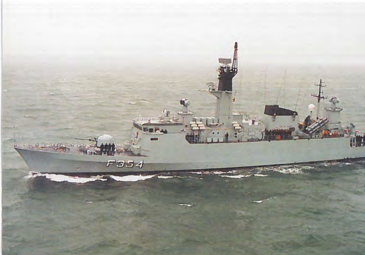
Forsvarets materiel må til stadighed leve op til Danmarks forpligtelser. Her ses korvetten NIELS JUEL efter den seneste opdatering.

Forsvarsudgifternes opgørelse bygger på fælles NATO-definition, som for Danmarks vedkommende adskiller sig fra det af Folketinget vedtagne forsvarsbudget. NATO-definitionen indebærer, at visse udgifter uden for §12 (Forsvarsministeriet) medregnes, herunder f.eks. dele af Danmarks Meteorologiske Institut og Kort- og Matrikelstyrelsens budgetter, de faktisk udbetalte pensioner og moms. Endvidere medtages visse driftsudgifter under den civile virksomhed ikke.