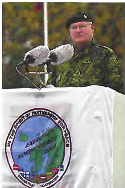
Chefen for Østre Landkommando indleder øvelse Nordic Peace 2000.

art. Det overordnede formål med NORDIC PEACE øvelserne er at udvikle de nordiske landes muligheder for sammen at kunne bidrage til internationale operationer. Øvelsen i Danmark fokuserede særligt på at udvikle relationerne mellem de militære enheder og de civile aktører som fx Røde Kors, UNHCR og Red Barnet i et potentielt uroligt eller krigshærget område. Der deltog i alt elleve forskellige ikke-statslige hjælpeorganisationer (Non Governmental Organisations) i øvelsen. Øvelsen blev gennemført som en stabs- og signaløvelse på Antvorskov Kaserne. Ud over stabsofficerer fra Danmark, Norge, Finland og Sverige deltog også stabsofficerer fra Estland, Letland og Litauen på lige fod med deres nordiske kolleger.