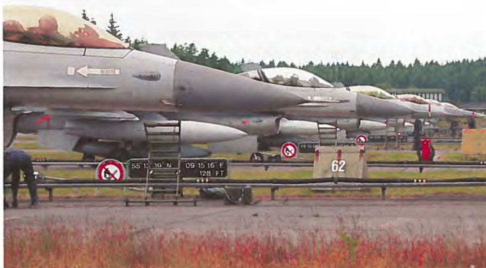
F 16 jagerfly på Skrydstrup.

Det danske flybidrag til Balkan Air Operations (BAO) justeres, idet de danske F-16 jagerfly tages hjem fra Italien. Det danske bidrag udgør herefter seks F-16 jagerfly på beredskab i Danmark med periodiske deployeringer til Italien (se også 15. – 29. september).