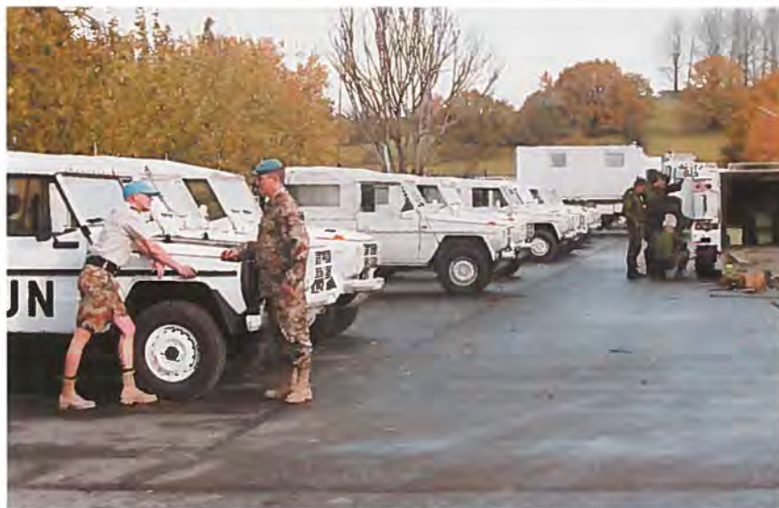
Uddannelsen af SHIRBRIG-personallet foregik bl.a. på Høvelte Kaserne.

Med udsigten til en hurtig israelsk tilbagetrækning fra Sydlibanon blev det primo maj besluttet at aktivere den del af SHIRBRIG personallet, der havde tegnet rådighedskontrakt, således at den missionsforberedende uddannelse og træning mv. kunne påbegyndes med udgangen af maj måned.