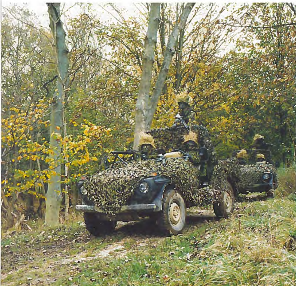
Hjemmeværnets Lokalforsvarsstyrke vil få moderne materiel til løsning af de nye opgaver.

Hjemmeværnet har endvidere fundet det hensigtsmæssigt at ændre på opstillingen og uddannelsen af alle hjemmeværnets enheder for at gøre dem mere fleksible. En bevogtningsdeling skal eksempelvis for fremtiden kunne løse alle typer af bevogtningsopgaver indenfor enhedens indsættelsesområde.