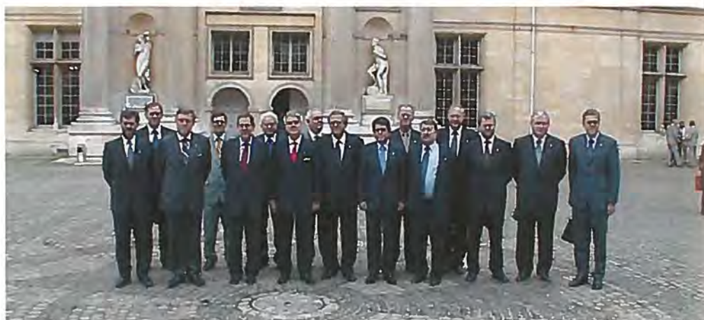
Forsvarsminister Hans Hækkerup deltog i EU-forsvarsministtermøde 22. september 2000.

På WEU-ministtermødet i Marseille 13. november 2000 tog man den endelige beslutning om en reel afvikling af WEU. Beslutningen indebærer bl.a., at man er klar til at overføre forskellige WEU-elementer til EU. I EU tog man samtidig en principbeslutning om overførsel til EU af WEU's Satellitcenter i Torrejón i Spanien og WEU's Sikkerhedspolitiske Institut i Paris.