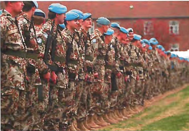
Parade før udsendelsen af SHIRBRIG, hvor de nye uniformer og de blå baretter lyser op.

SHIRBRIG holder afskedsparade på Høvelte Kaserne i Nordsjælland forud for udsendelsen til Eritrea.