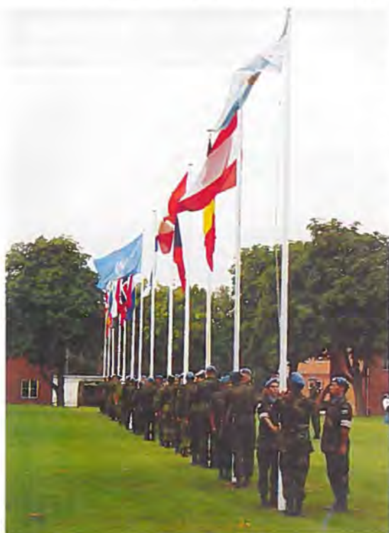
Flagparaden ved oprettelsen af SHIRBRIG i Høvelte.

Den overordnede politiske ledelse og kontrol forestås af Styringskomiteén, der kan sammenlignes med en bestyrelse. Formandskabet varetages af landene et år ad gangen. Danmark havde indledningsvis formandskabet indtil udgangen af maj 1998. Siden har Holland og Sverige varetaget hvervet, der for nærværende og indtil sommeren 2001 varetages af Polen.