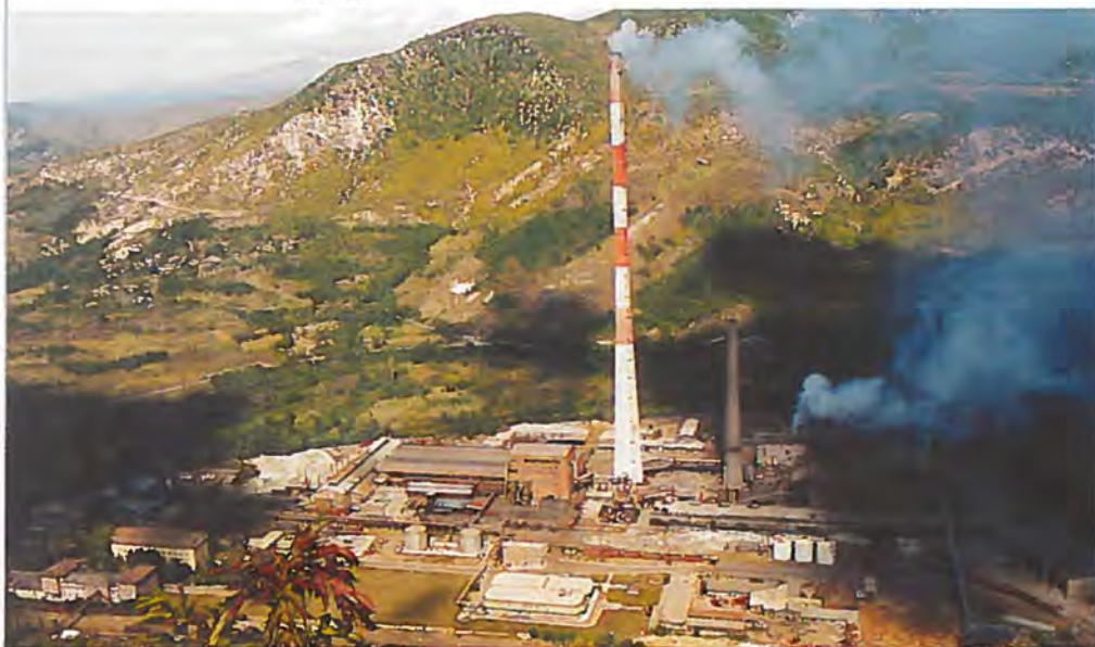
Blysmelteværket i Zvecan var en væsentlig forureningskilde i området.

UNMIK havde dog generelt svært ved at håndtere problemerne i byen på grund af en svag civil administration. Som en konsekvens heraf og ikke mindst på grund af voldsom forurening iværksatte UNMIK og KFOR den 14. august en operation mod blyværket i Zvecan uden for Mitrovica for at gennemtvinge en midlertidig lukning af værket. Operationen forløb forholdsvis fredeligt, idet FN overtog forpligtelsen til at udbetale lønninger til værkets arbejdere.