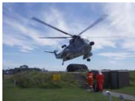
En redningshelikopter kommer sikkert ned på Flådestationen. Den skal demonstrere sine kapaciteter for kursister på Søredningskursus. se side 6....