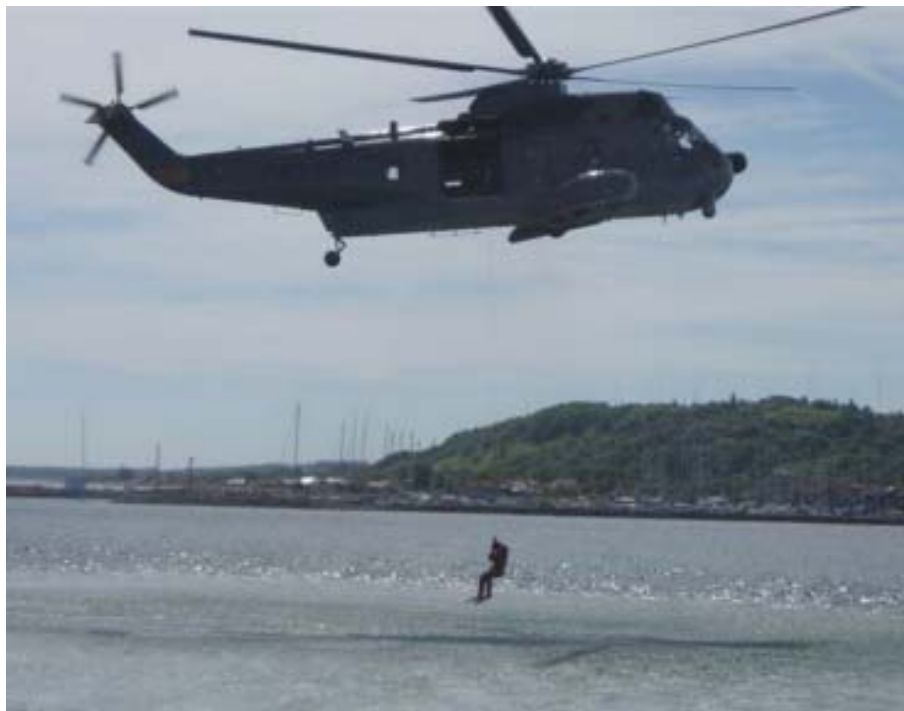
En Sikorsky helikopter demonstrerer redning af personer fra havet