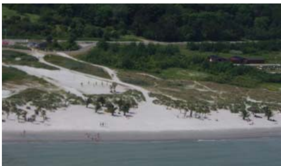
Kursisterne kan beskue Frederikshavn's palmestrand under en demonstrationstur med helikopteren

Vel tilbage på TAK, bød onsdag eftermiddag hele torsdagen og fredag formiddag, på fire planlagte simulerede øvelse i SAR/NAV træneren. Træneren består af 8 små afdelinger (kubikler) samt et antal instruktørpladser. Her kan instruktørerne så planlægge øvelserne, og de kan under gennemførelsen overvåge kom-