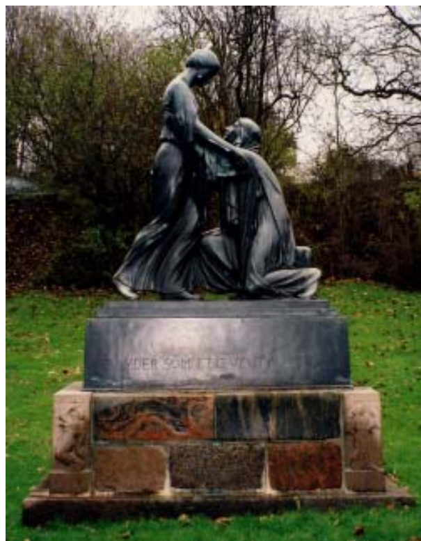
Monument for genforeningen 1920, opstillet i Randers

Derimod er det typiske 1. verdenskrigsmonument uden for Sønderjylland en søjle med relieffer ved havnen, hvilket afspejler, at de omkomne var søfolk og fiskere. Danmark var neutralt under krigen, og de omkomne var derfor hovedsageligt folk, der sejlede på de mine- og ubådsfyldte farvande. Men i Sønderjylland, som dengang hørte under Tyskland, og hvor befolkningen var pålagt tysk krigstjeneste, er det typiske monument en natursten, der står på kirkegården og minder de faldne, som ellers blev begravede på en fjern slagmark. Over 4000 sønderjyder omkom under krigen.