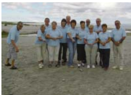
SIF Petanque spillere i mange sammenhænge. se side 14....