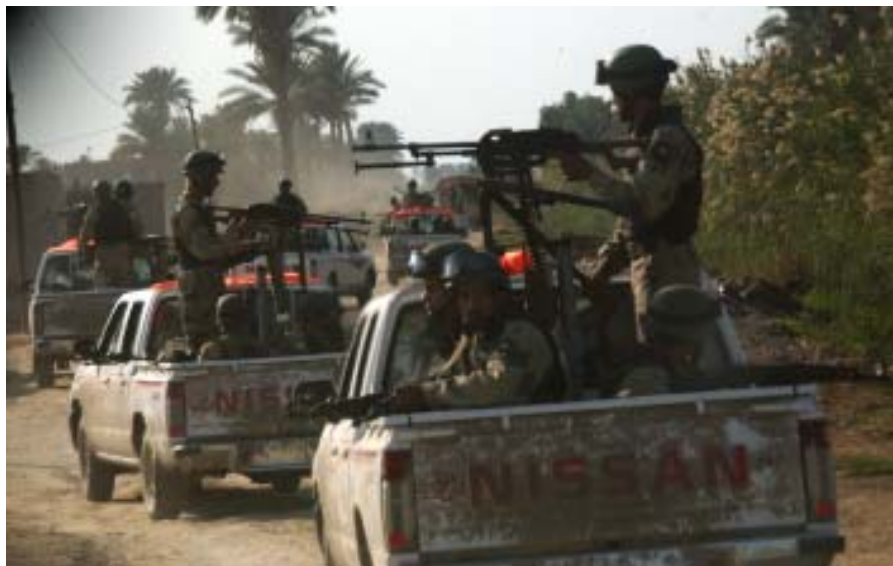
Den nye irakiske hær er ikke så imponerende som tidligere tiders militærparader