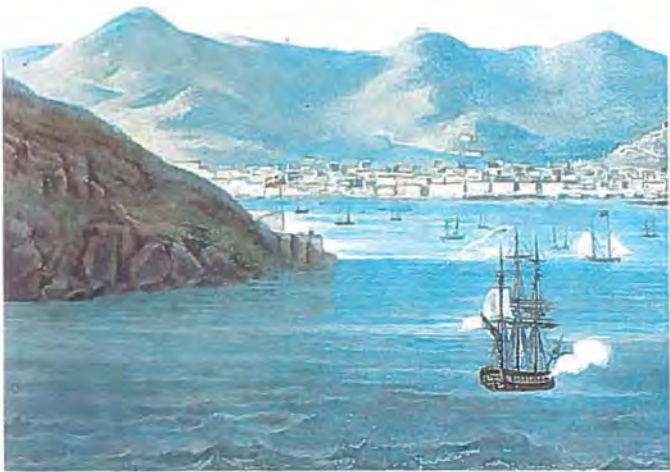
Prospekt af St. Thomas, farvelagt litografi.

Byen, viste sig snart; thi da vi til Tidsfordriv gik bagefter en som det syntes anstændig Familie med 2 Døttre viste disse sig meget rede til at gjøre vort nærmere Bekjendtskab. Men det Mærkeligste var egentlig, at da vi næste Dag vare iland – civile – og efter at have besøgt Messen spadserede et Øieblik paa Alamedaen for at høre paa Musiken, viste den høie smukke Dame fra Gaardsdagen sig igjen med sin Veninde og klædt i Dannebrogfarver, det vil sige hvid Kjole med lange røde Baand. Til Forklaring af dette mærkelige Fænomen, som jeg ikke udelukkende turde betragte som en Virk-