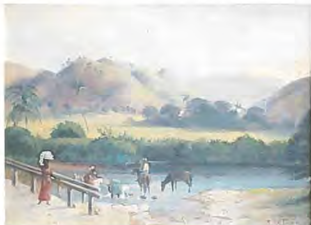
Landskab nær West End med vaskeplads, maleri af Fr. Visby ca. 1880. Handels- & Søfartsmuseet.

Den 18de om Morgenen Kl. 6 satte vi atter Steamen op og efter en hurtig Overfart seilede vi for sidste Gang ind i Basinet; jeg saae paa de deilige Omgivelser og tænkte paa første Gang, jeg havde seet dem. Hvormegen Glæde, hvormeget Haab havde de ikke fremkaldt, og havde de skuffet mig! Tilvisse nei, kun var Løfterne fremtraadte under en lidt anden Form. Det Grønne havde Solen bleget en Del og Høiderne vare hist og her næsten gule, men endnu smilte med et tropisk Smil Palmer inde i Bugten og de lysegrønne Sukkermarker paa de lave Skraaninger. Hist og her saa man Sukkermøllerne i Gang og Røgen fra Kogerierne stige tilveirs; thi Sukkerhøsten var begyndt et Par Maaneder senere end den pleiede. —