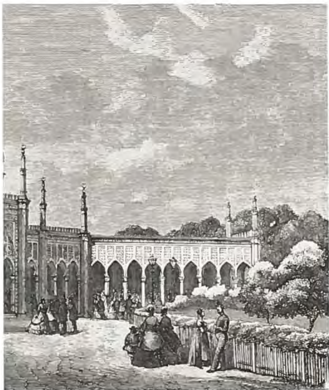
Efter bygningsinspektør Stillings tegning. Træsnit.

relse; kun syntes man at have hørt noget om Brylluppet, da man den næste Dag talte meget om 2 Dannebrogssflag og Krandskage. Jeg lod som Intet.