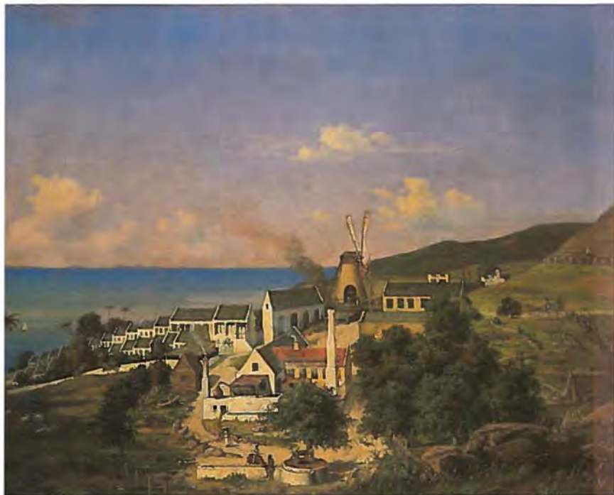
Christianssted på St. Croix, litografi af J. F. Fritz 1837. Handels- & Søfartsmuseet.

kunde opdage noget Skjønt. Ligeoverfor os ved Indløbet til Floden fandtes nogle høie ujævne, mørke Skrænter, hvorpaa Fortets forfaldne Mure traadte uhyggeligt frem; fra et Taarn veiede det spanske Flag. Længere inde langs Floden saaes Ruinerne af et nok aldrig fuldendt Kloster samt nogle forfaldne Stenhuse og Træboder; længst inde fandtes et nyt anlagt Fort, hvis Kanoner ogsaa kunde vendes mod Byen og udenfor dette laae Marker. Ogsaa inde paa Floden laae nogle spanske Krigsskibe foruden en Del Koffardimænd. Fra Skibet af