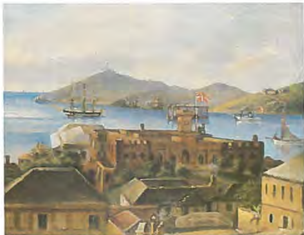
Udsigt over St. Thomas havn fra guvernementshusets trappe med fortet Christiansværn i mellemgrunden. Orlogsfregatten „Sjælland” ses i midten. Maleri fra 1881. Handels- & Søfartsmuseet.