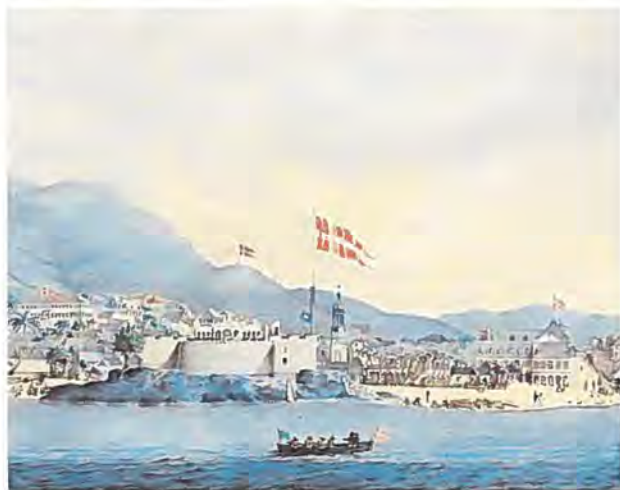
Christianssted på St. Croix, farvelagt litografi. Nationalmuseet.