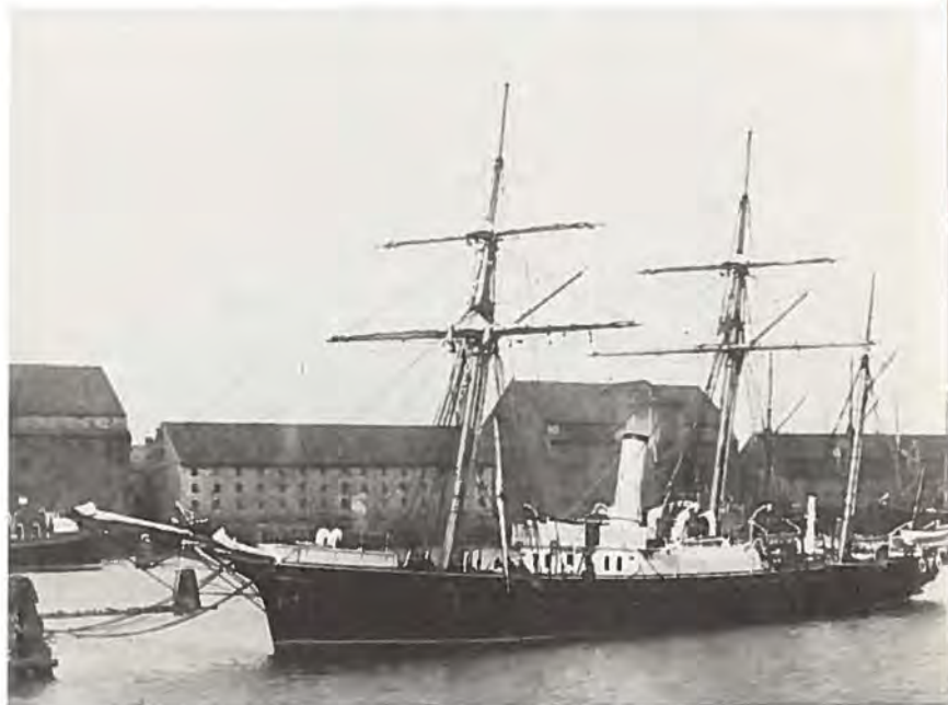
„Fylla” i Københavns havn. Orlogsmuseet.

Jeg skulde nu til at see, hvorledes det egentligen gaaer her paa St. Thomas; om Byttet virkelig er saa meget daarligere! Jeg kan dertil endnu kun svare ja, hidtil har det været daarligere, men det lover mere for Fremtiden.