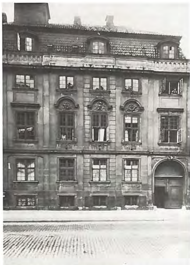
Den kgl. Fødselsstiftelse. Det kgl. Bibliotek.