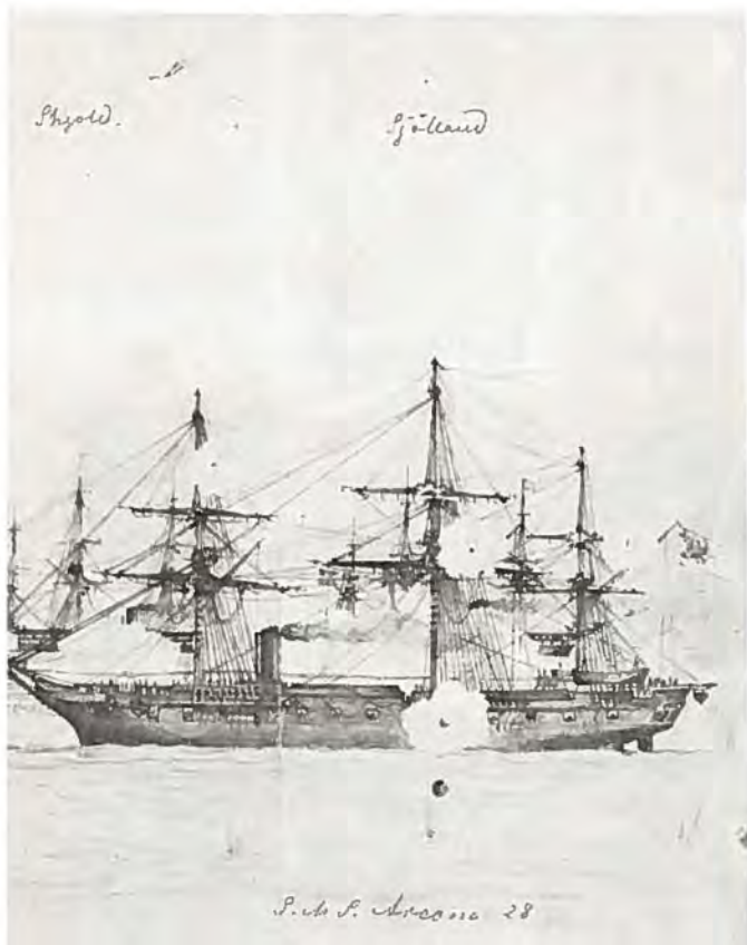
Tegnet af en tysk kunstner. Marinehistorisk Selskab.

17., da jeg først og fremmest maa undgaae at see the Dove, om ikke Andet, saa for hendes Skyld; det forekommer mig nemlig som om Familien (idetmindste min og maaske ogsaa hendes) søger at bringe os sammen, og det maa ikke skee. —