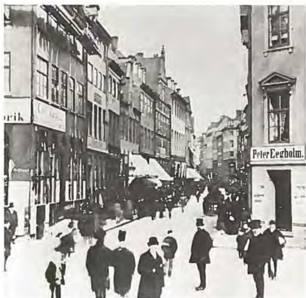
Østergade ved „Ranchs Hjørne”.