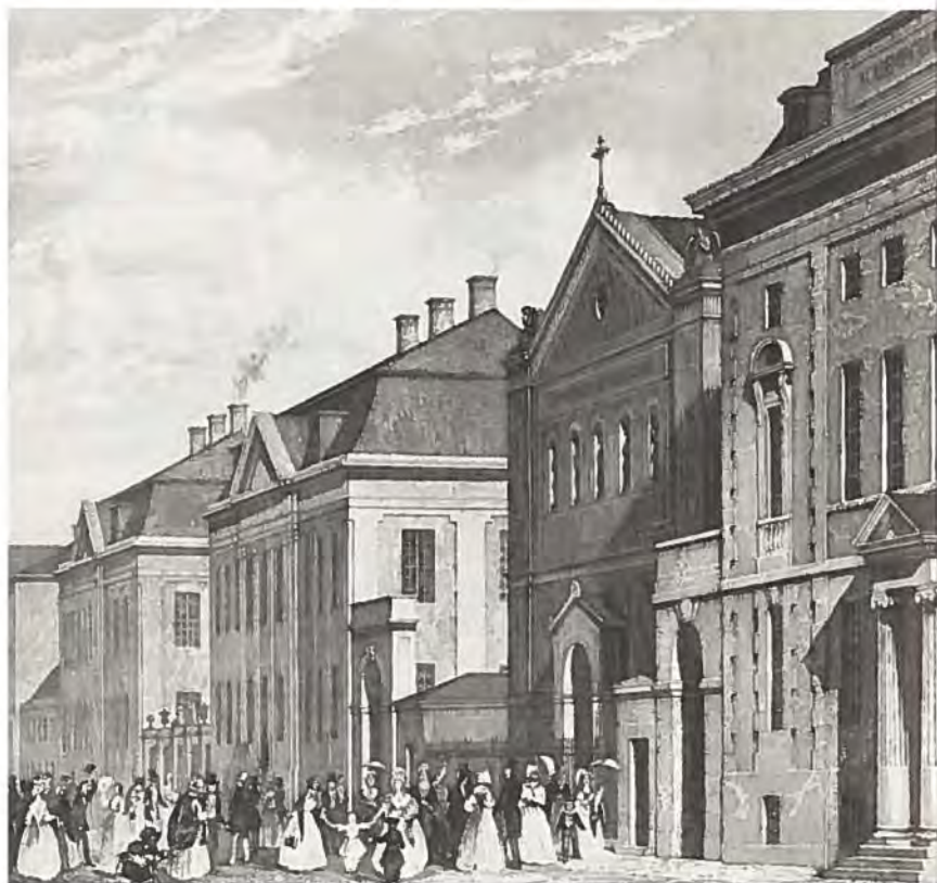
Bredgade med Frederiks Hospital ca. 1830.