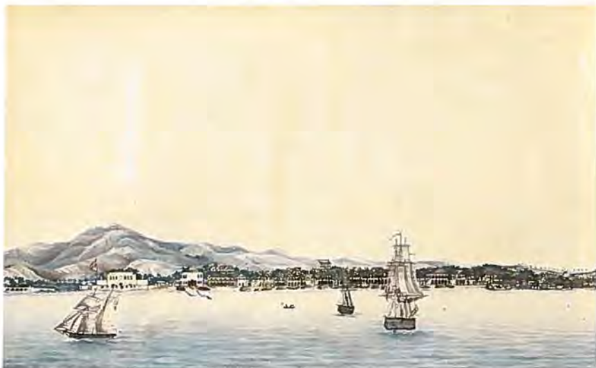
Frederikssted på St. Croix, akvarel af H. G. Thorsøe ca. 1820. Handels- & Søfartsmuseet.

fandt mig rigtig vel og først viste mig paa Dækket, da vi var udenfor byen Isabel Secunda. Gjæsterne omringede mig og spurgte deltagende til mit Befindende saavel psychisk som somatisk. Heldigvis var der ikke Tid til lang Forklaring, man gik i Baaden, efter at en Baad fra Land havde bragt officielle Invitationer til Gjæsterne og Officiererne.