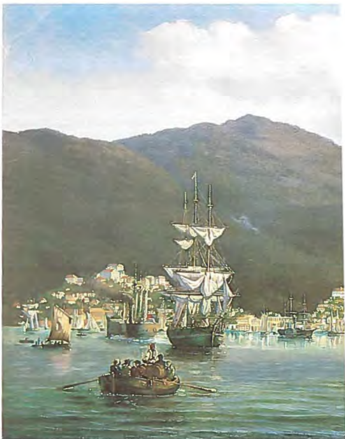
Charlotte Amalie, hovedstaden på St. Thomas.