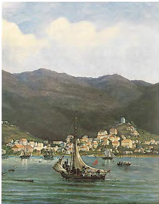
Maleri af Fritz Melbye 1852. Handels- & Søfartsmuseet.

jeg overbragte en Invitation til Magens Bal, som hun modtog. Faderen hilste jeg flygtigt paa, men saae ikke Noget til de andre Damer. –