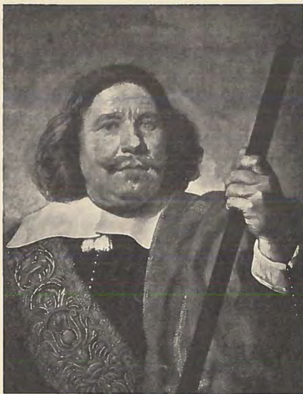
EGBERT MEEUWZOOM KORTENAER.

Angreb, maa utvivlsomt hans Næstkommanderende dele Æren med ham. Egbert Meeuwzoon Kortenaer var steget op fra simpel Matros. Han var Styrmand hos gamle Tromp i 1652. Aaret efter havde han som Kaptajn paa samme Skib udmærket sig saaledes, at han i det Slag, hvor Tromp faldt, med Paabud om at fortie dette, fik Ordre til at lade Admiralflaget vaje og selv føre Kommandoen. Han var