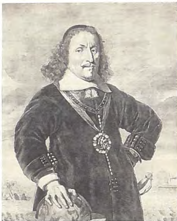
WITTE CORNELISZOOM DE WITT.

endnu findes. En gribende Episode var det, da den tapre Witte de Witt, som med Heltemod længe forsvarede sig mod Overmagten, saaret til Døden i sit synkende Skib, endnu kæmpede staaende paa sine Knæ med nogle svenske Matroser og vægrede sig ved at overgive den Kaarde, han i 30 Aar med Ære havde ført mod sit Lands Fjender, uden til en Officer. I sine sidste Øjeblikke tilraabte han sine Folk :