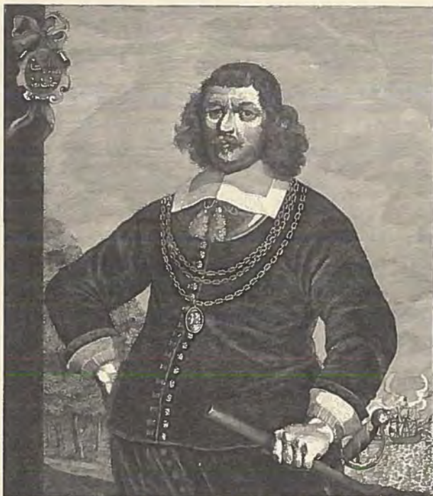
DEN E. MANHAFTEN ZEEHELDT PIETER FLORISZ. VICE- ADMIRAAL VAN HOLLAND EN WESTFRIESLAND IN 'T NOORDERK QUARTIER.

»Det Billed viser Witt, og i de Witt en Helt, hvis Tapperhed berømt i Verdens Kres er bleven. Hans Hoved kløgtigt var, og skarpt hans Skud i Felt. en lys og munter Sejr paa Kaarden stod indskreven. Paa alle Have brugt til Gavn for Land og Hjem, til Dødens Lod mod ham i Øresund blev rettet, hvor skønne Lavrbær af hans dyre Blod sprang frem, mens vore Lavrbær af det samme Blod blev plettet. Først naar i Cedertræ fra Libanon han skæres, et Billed værdigt ham til fjerne Slægter bæres.»