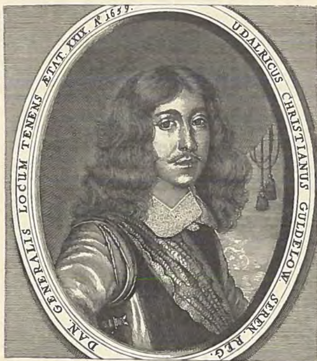
ULRIK CHRISTIAN GYLDENLØVE.

Kongen havde haabet, at Drengen med sit lette Nemme skulde bane sig Vej ved Bogen; men deri blev han skuffet. 12 Aar gammel kunde han vel glæde Faderhjertet ved en latinsk Tale; men Studie-aarene paa Sorø Akademi gav kun ringe Udbytte; hans Hu stod til Krigen, og Kongen maatte lade ham raade. Ved Nyaarstid 1648 drog han ud i Verden og gensaa aldrig senere sin Fader eller Moder.