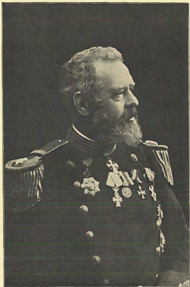
Memoirernes Forfatter Kontreadmiral VICTOR HANSEN.