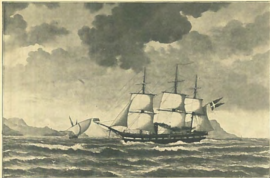
Corvetten „DAGMAR“ staar Gibraltar ud 23. Dec. 1862 paa Vej til Vestindien. Efter Maleri af Victor Hansen .