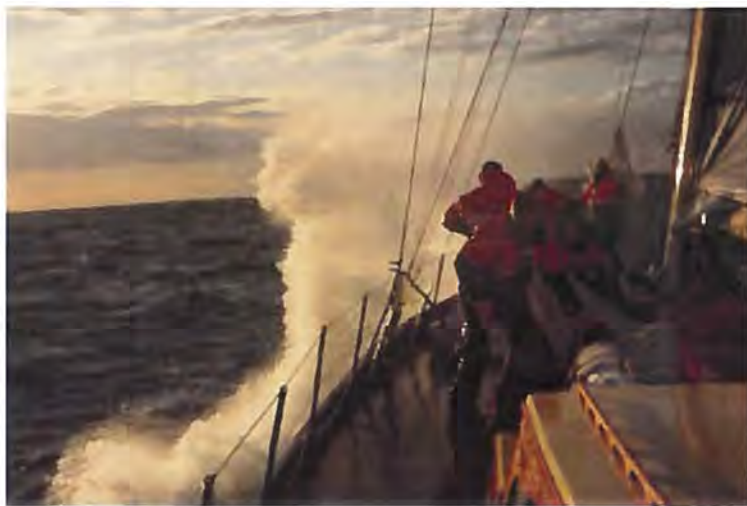
Skift af forsejl under gang.

Den faste besætning er tilkommanderet skibene fra tilrigning (først i APR) til afrigning (sidst i OKT).