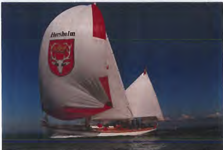
SVANEN for spiler og mesanstagej1.

Sejlkutterne er gode søskibe som kan bjerge sig i alle vindstyrker. Stabiliteten er god og der kan holdes fuld sejlføring i op til 15 m/s under hensyntagen til besætningens opnåede færdigheder. Letvejrsspiler kan føres op til ca. 10 m/s, og stormspiler op til ca. 18 m/s, idet styringen, samt de sikkerhedsmæssige aspekter under arbejdet med det tunge grej sætter begrænsninger.