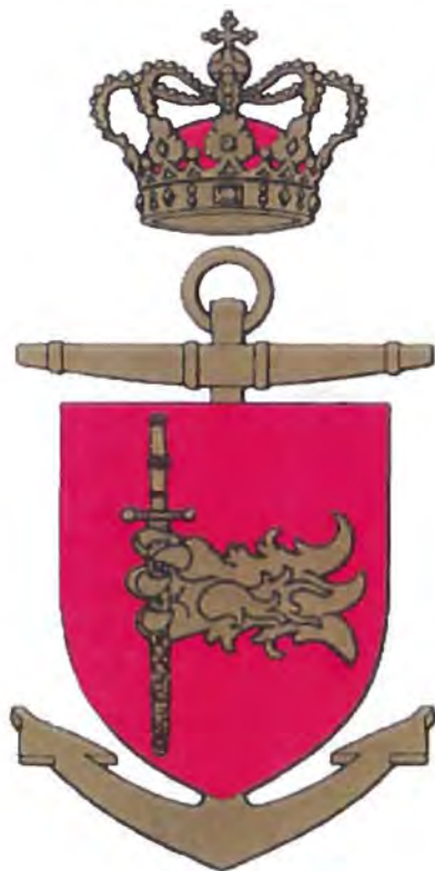
Søværnets Officersskole våbenskjold

SVANEN og THYRA har ikke eget våbenskjold, og gør derfor brug af Søværnets Officersskoles våbenskjold.